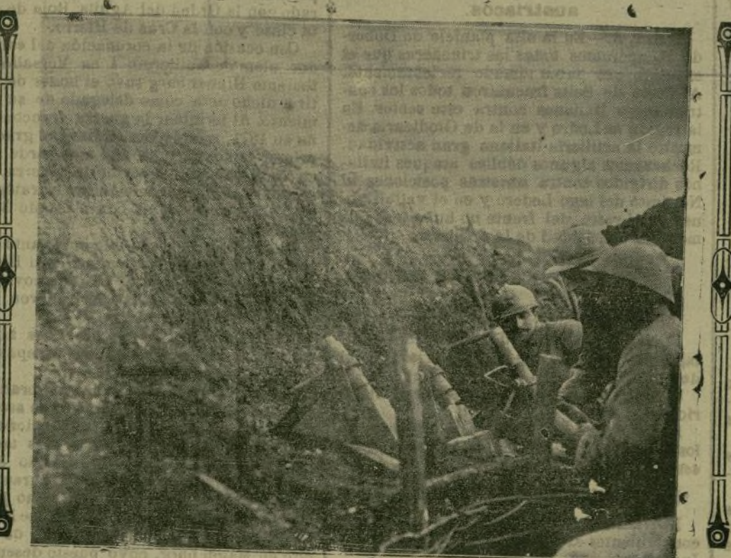
Pequeños lanzabombas del ejército alemán dispuestos a disparar sus proyectiles.