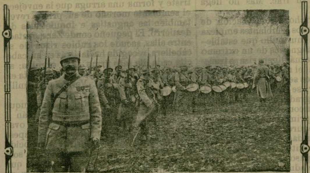
Regimiento francés presentando armas durante una revista.