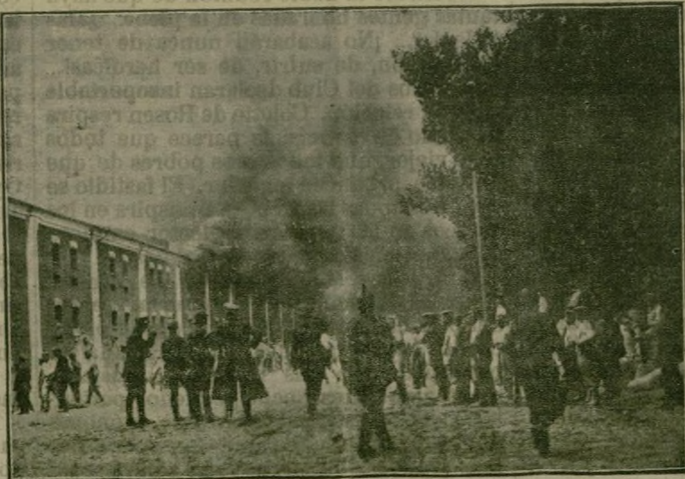
Soldados alemanes poniendo a salvo las provisiones en la fortaleza de Brest-Litovsk.

En los cuarteles rusos se busca constantemente a sospechosos de espionaje.»