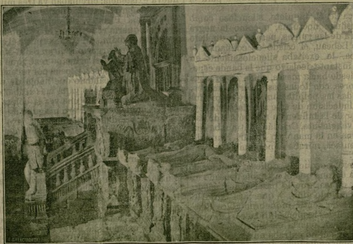
Santa María la Real de Nájera.—Panteones reales.

CINEMA. Tarde y noche: VARIETÉS Importantes debuts todos los días.