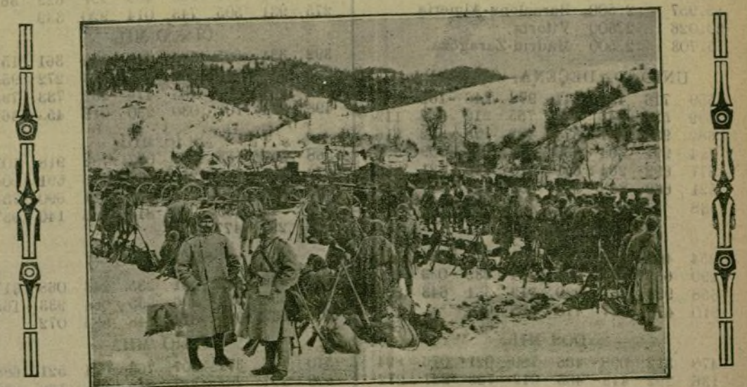
Un descanso de las tropas austrohúngaras durante la lucha en los Cárpatos.