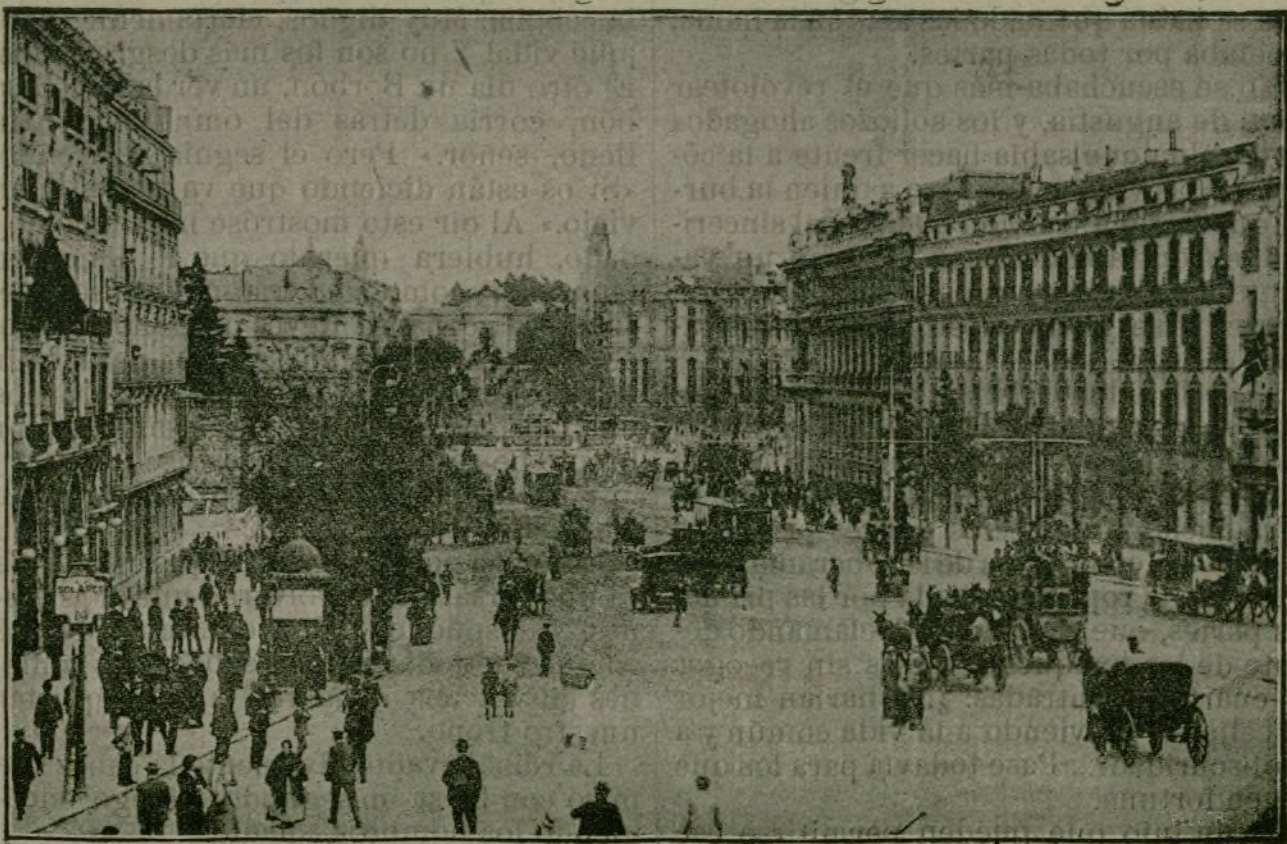
Aspecto de la calle de Alcalá durante la entrada de los toros en la corrida de inauguración.

CINEMA. Tarde y noche: VARIETÉS Importantes debuts todos los días.