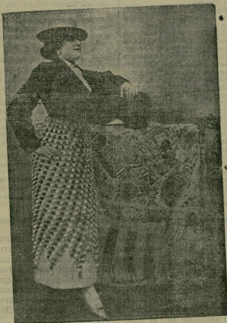
Encantadora artista de canto flamenco que ha debutado con gran aplauso en el teatro Alvarez Quintero.

En el teatro Alvarez Quintero está levantando una revolución de entusiasmo, con su canto flamenco, esta encantadora artista, que, en su excursión por Andaluía, ha gustado más que la supresión del impuesto de inquilinato — por aquellas tierras los Municipios se «empeñan», pero no en «cobrar» ese impuesto.