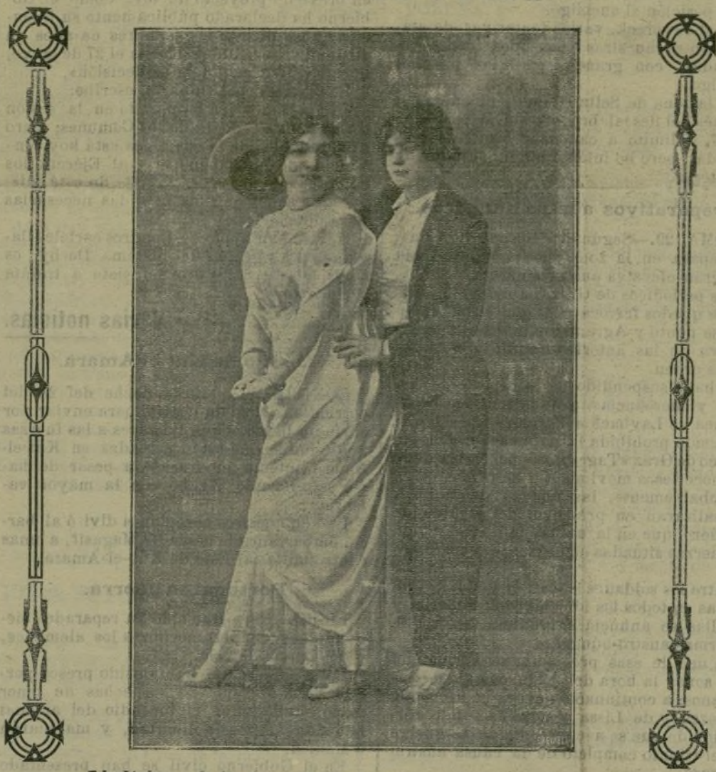
Lindísimas bailarinas y duetistas que después de hacer una brillante «tournée» en provincias, han debutado ayer con gran éxito en el «Music-Hall» de Venecia Club, el cual se inauguró anoche con un sugestivo y atrayente programa de variedades.

grandeza que tiene todo lo modesto, a que ayer asistimos en el Círculo Católico de obreros de Nuestra Señora de Covadonga.