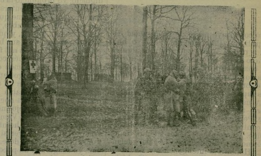
Un puesto, de la Cruz Roja germánica, cercano a la línea de fuego.