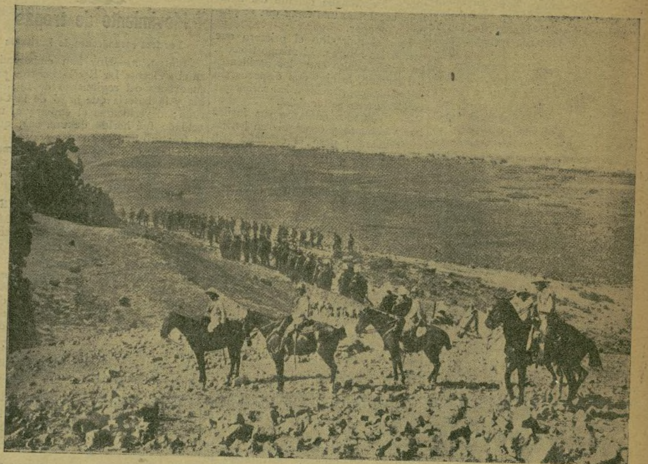
Una columna, compuesta de fuerzas de los regimientos de Mallorca y del Serrallo con caballería de Alcántara, explorando terrenos frente a la alcazaba de Zeluan.