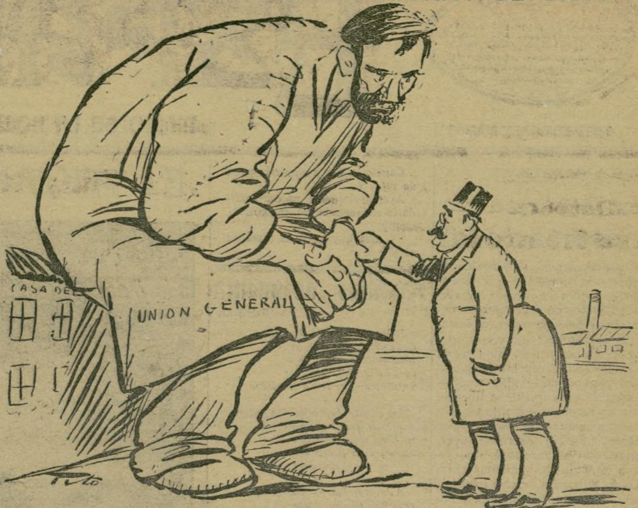
CANALEJAS (aparte).—La verdad, ¡disolver es!