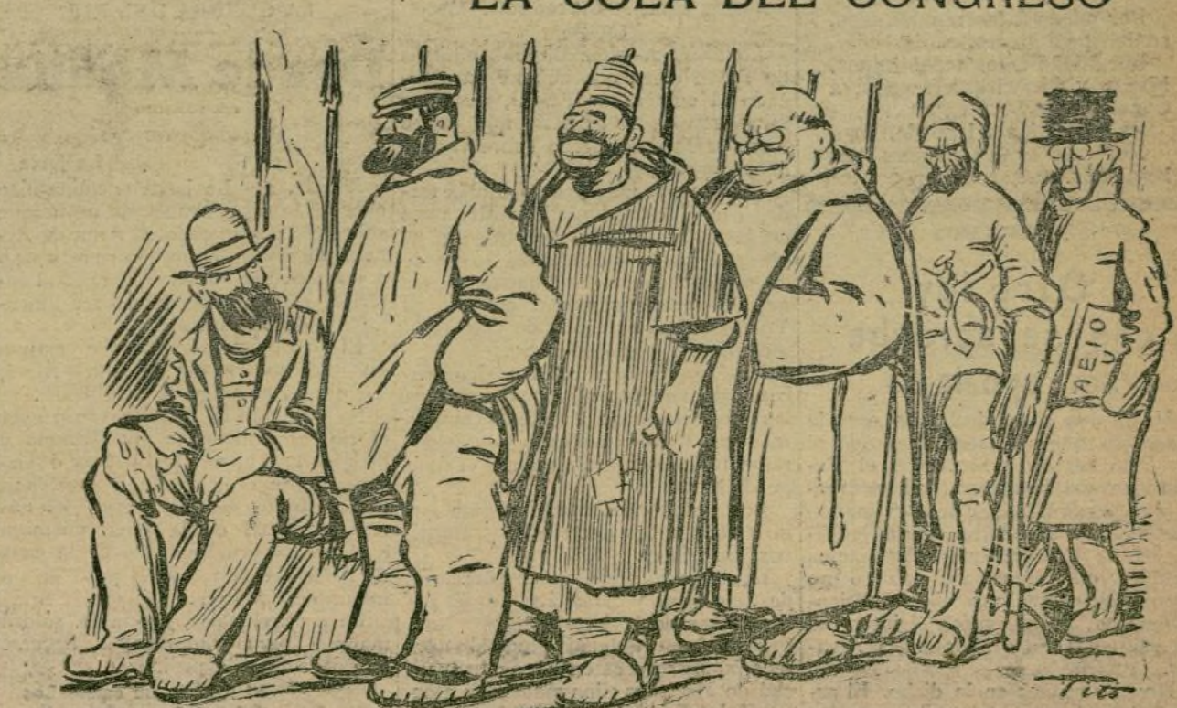
EL HABITUADO.—¡Me parece que ahora también se quedan ustedes sin entrar!