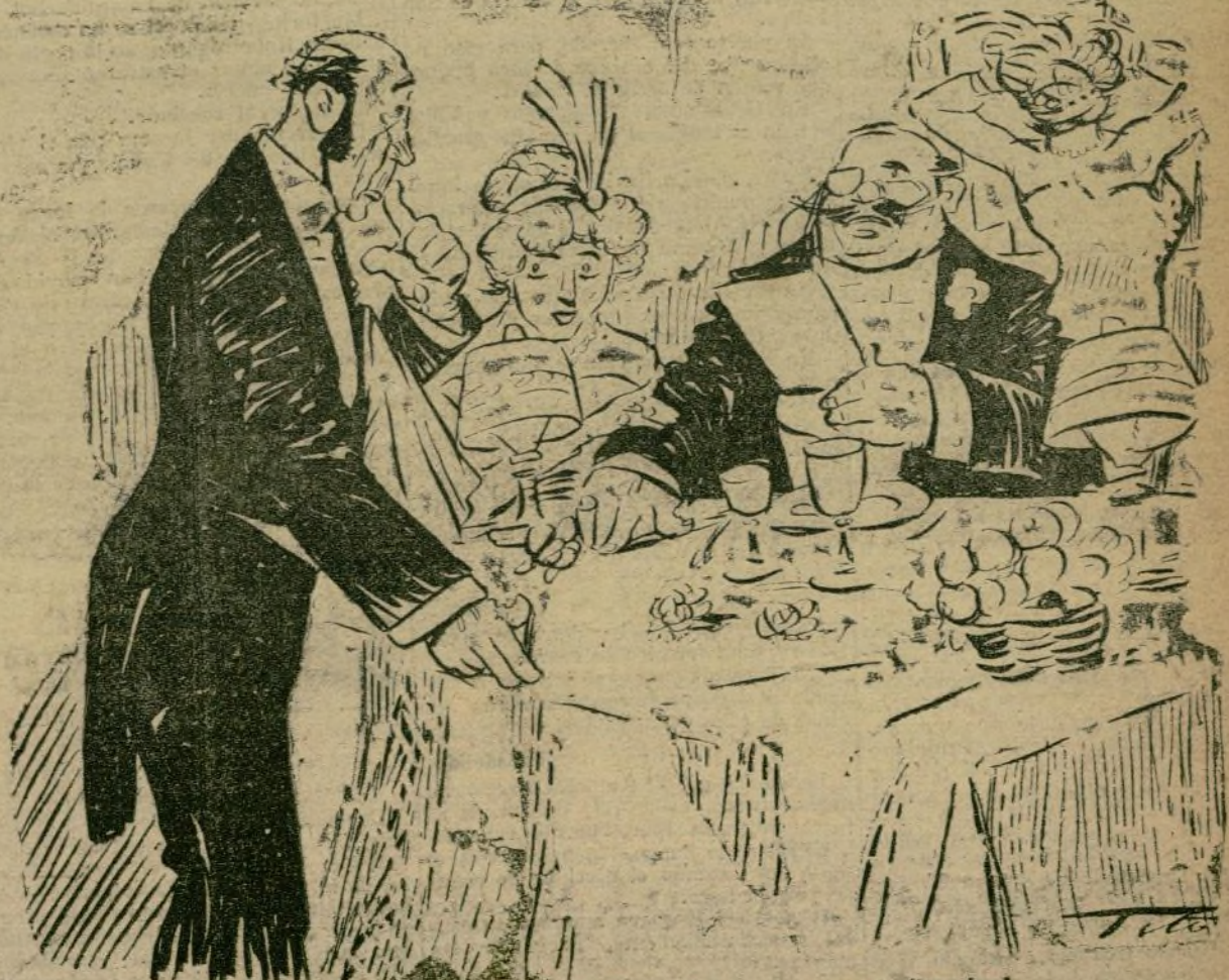
EL PARROQUIANO. —Una docena de ostras esterilizadas!