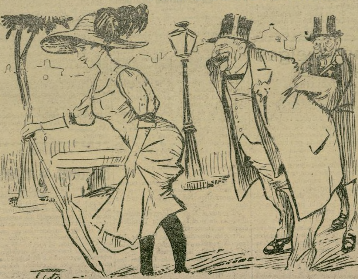
¡Vaya usted con Dios... secuestrador! Ayuntamiento de Madrid