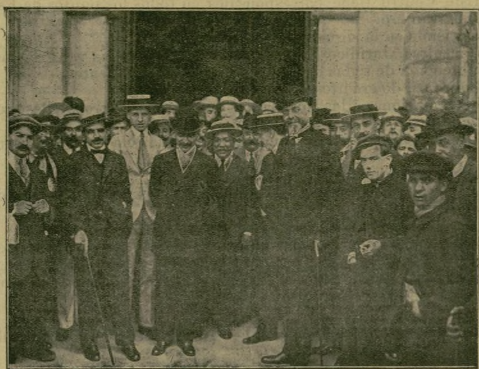
Melquiades Alvarez á su llegada á Barcelona.

La señorita «Chelito» ha debutado en Granada con un éxito loco. El gacetero felicita á la señorita «Chelito», á la que, para su mayor satisfacción, ha hecho una magnífica entrevista «El Duende».