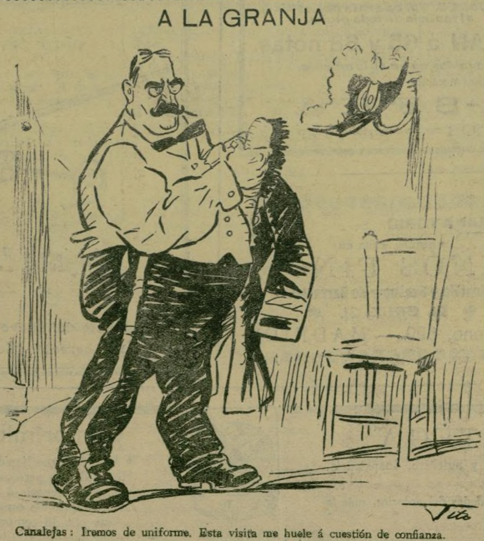
Canalejas: íremonos de uniforme. Esta visita me huele a cuestión de confianza.