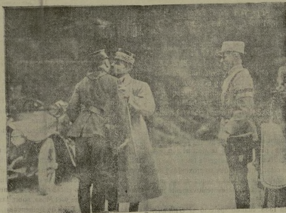
El gobernador militar de París, Mr. Galleni, despidiendo á su hijo, que sale para el frente.