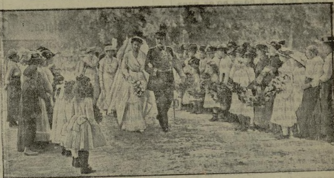
Boda de un oficial alemán, herido en los últimos combates, con su enfermera.