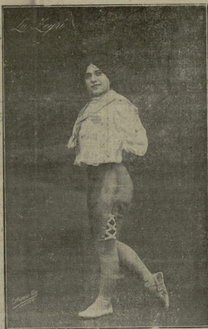
Preciosa bailarina que ha dejado muy gratos recuerdos y crecido número de admiradores en su paso por los teatros Alvarez Quintero y Romea de esta Corte.