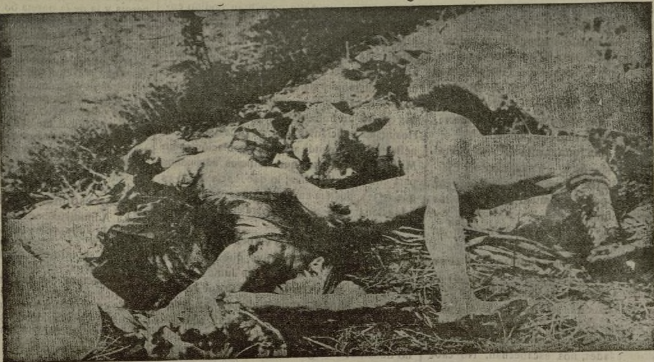
LAS CRUELDADES ALEMANAS —Muj-res servias violadas y descuartizadas por las tropas del general Mackensen, en su avance victorioso por territorio servio.