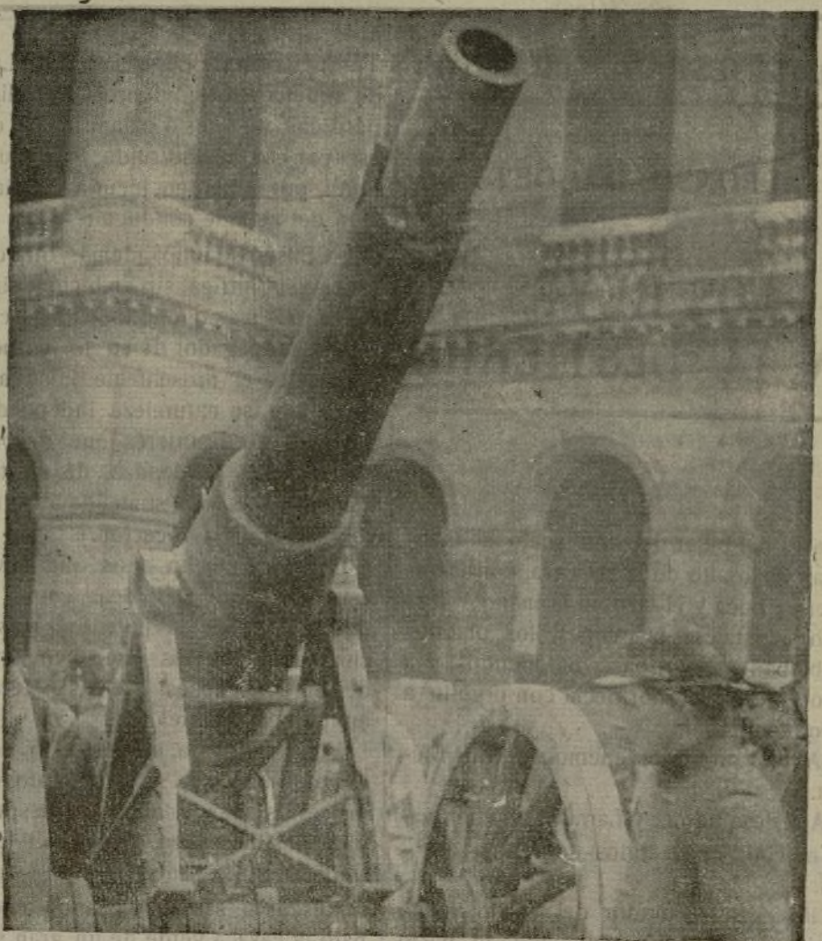
Uno de los gigantes morteros del modernísimo material de guerra que los franceses han desembarcado en Salónica.