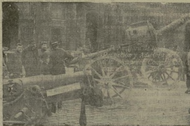
Cañones cogidos al ejército servio por las tropas austro-húngaras.