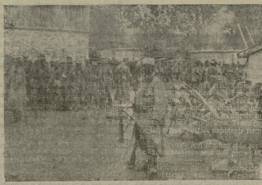
Soldados franceses pasando revista después de un encarnizado combate, para comprobar las bajas que han tenido.