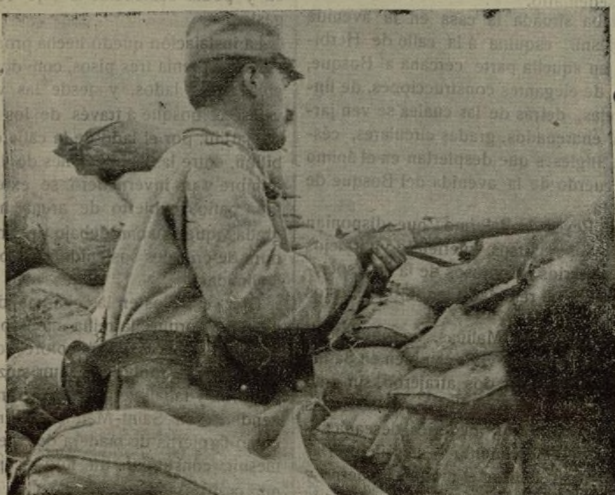
CENTINELA AUSTRIACO EN UNA TRINCHERA DEL FRENTE ITALIANO

El gobernador ha empezado á tomar energéticas medidas.