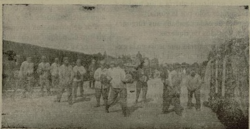
PRISIONEROS FRANCESES CARGANDO PROYECTILES CON DESTINO AL FRENTE DE BATALLA, EN UN TREN ALEMAN

BADAJOS, 27.—Se ha celebrado una manifestación obrera, pidiendo pan y trabajo. Los manifestantes, unos dos mil, recorrieron la población, dirigiéndose al Gobierno civil, donde una Comisión entregó un mensaje al gobernador.