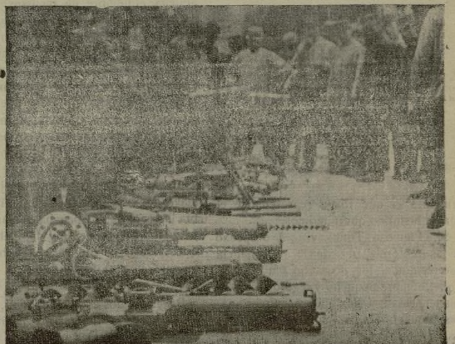
AMETRALADORAS Y MATERIAL DE GUERRA ABANDONADO POR LOS INGLESES AL RETIRARSE DE GALLI POLI