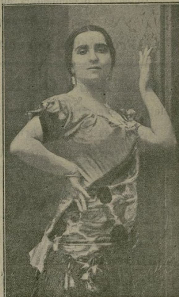
LA MINERVA Genial bailarina que con gran éxito ha actuado en los principales teatros de España.