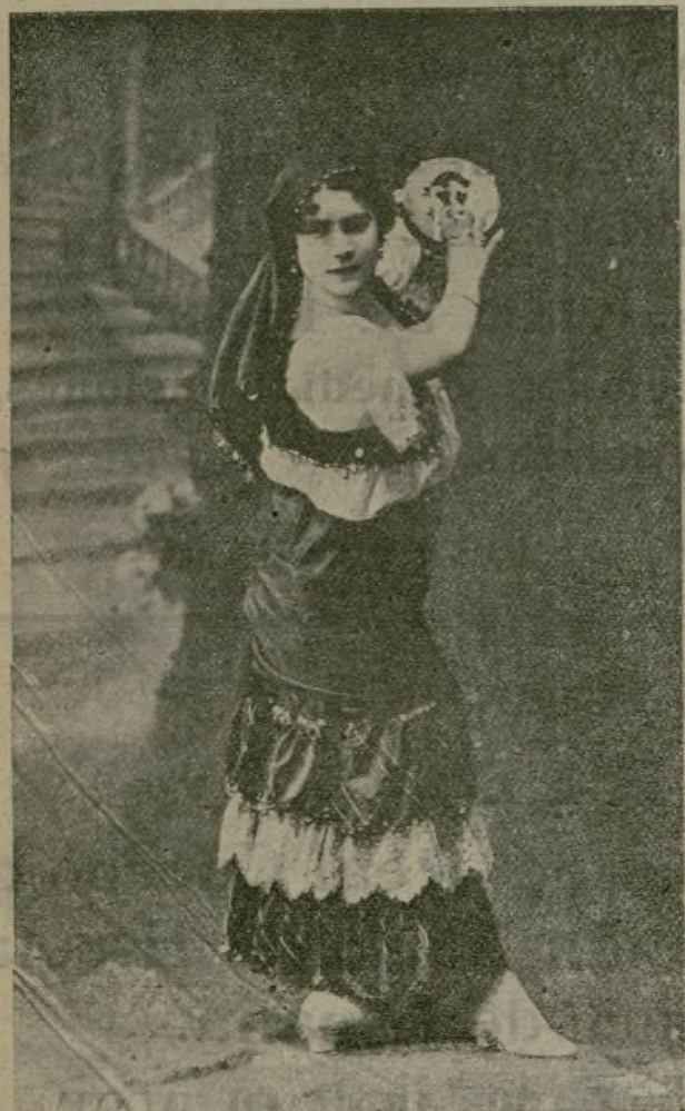
ENCARNITA UNAMUNO Lindísima bailarina que actúa en el teatro Romea, de Madrid, con gran éxito.