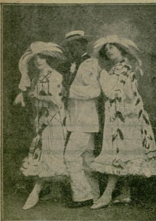
Aplaudido número de bailes excéntricos que en breve debutará en el teatro del Retiro.

Sobre el escenario del Kursaal rodarán los mayores prestigios atléticos, y los admirables señores que componen el Jurado oírán protestas en todos los idiomas.