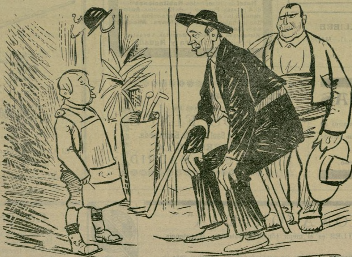
Juan Electro: ¡Qué rico está tu papá. El niño: Sí, pero ha dicho que no quiere recibir más paletos. Ayuntamiento de Madrid