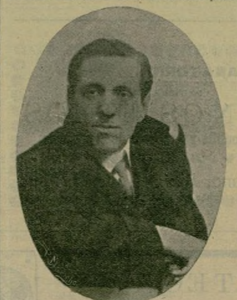
Luis de Torres, distinguido actor, que está haciendo una «tourné» por provincias.

Pascuala Mesa, que ha hecho brillantísimas campañas con Borrás, Donato Jiménez, Morano y otros colosos, recorriendo triunfalmente los principales coliseos de España y extranjero, últimamente en el Español, nuestro primer teatro, hizo su consagración definitiva distinguiéndose notablemente en «La moza de cántaro», única obra en la cual pudo