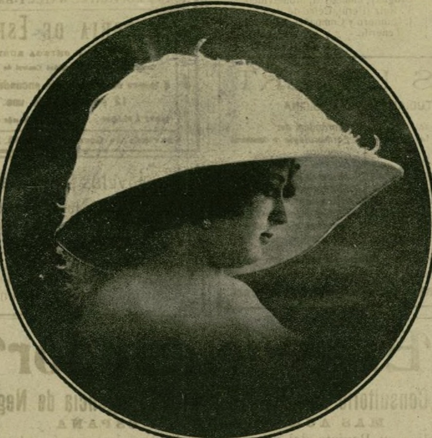
BRUNIÓ Notable cupletista transformista.—Actúa con gran éxito en el Teatro Madrileño de esta Corte