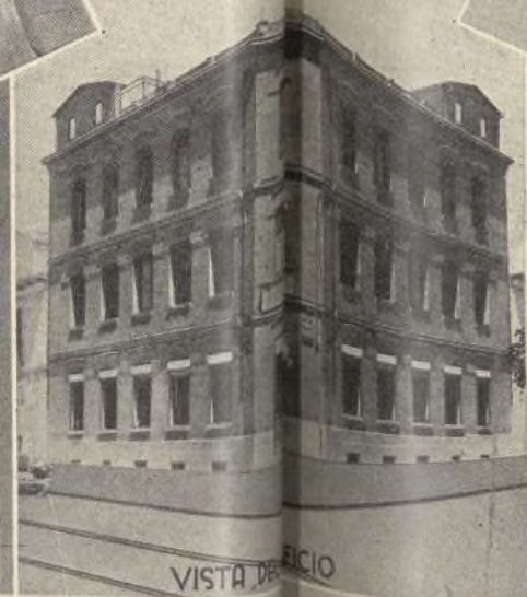
VISTA DE FACCIO