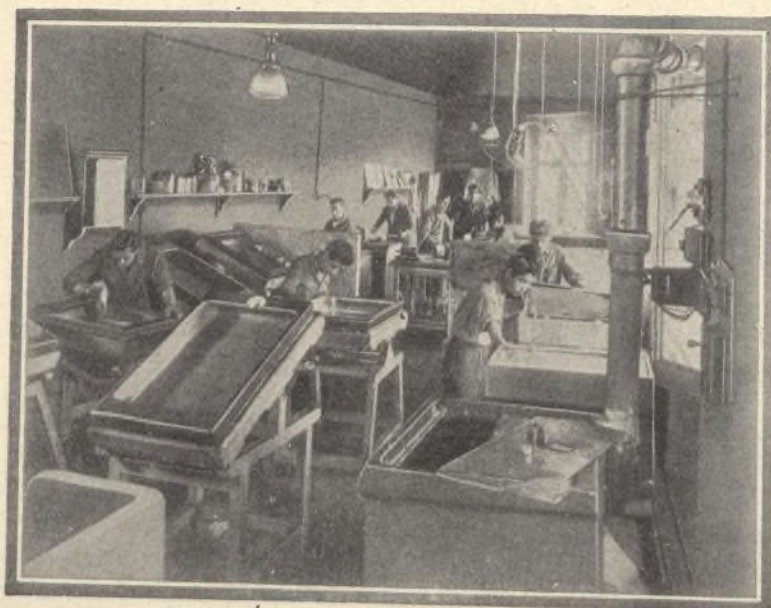
SECCIÓN DE GRABADO DE LINEA