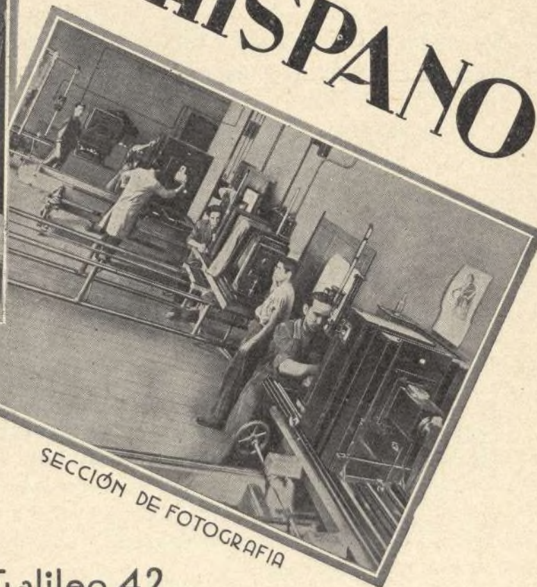
SECCIÓN DE FOTOGRAFIA