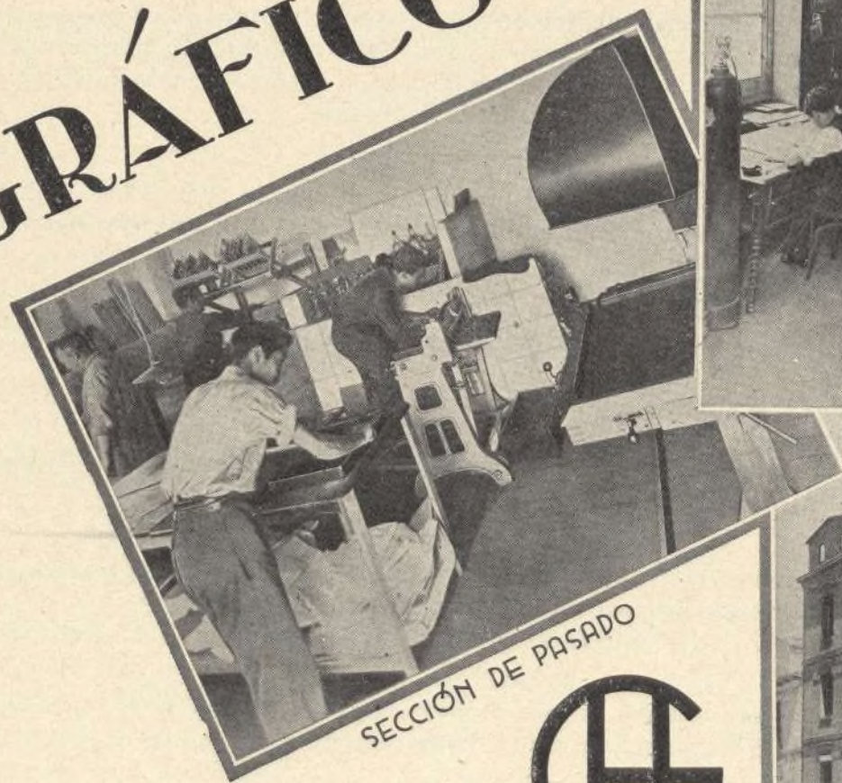
SECCIÓN DE PASADO