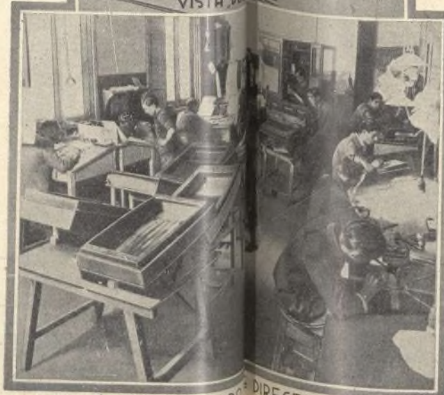
SECCIÓN DE GRABADO DIRECTO Y COLOR