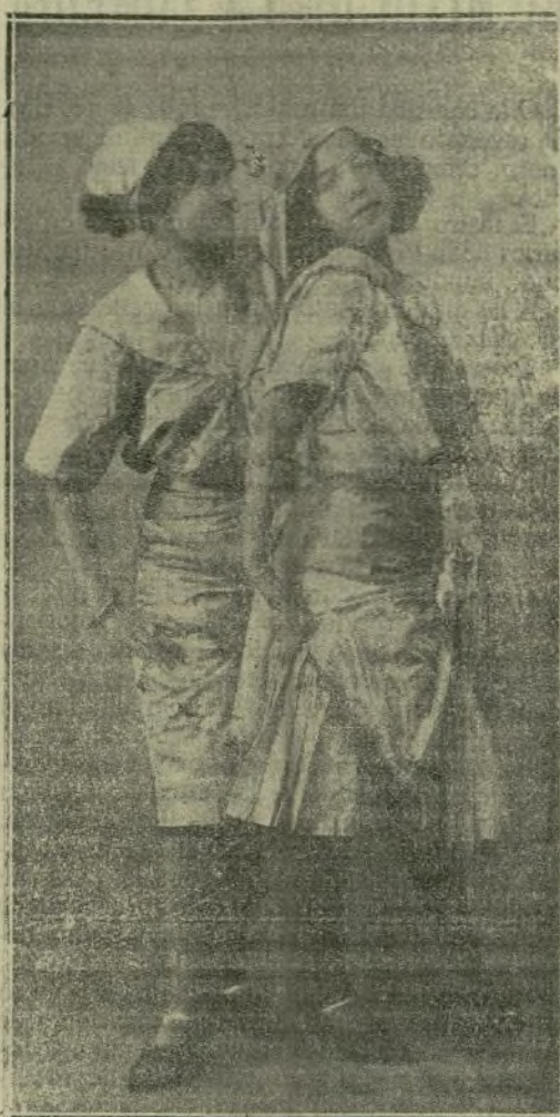
Las bellas y simpáticas Hermanas Romanis que después de brillante tournée por Andalucía y el extranjero, trabajan actualmente con extraordinario éxito en el Eden Concert de esta Corte.