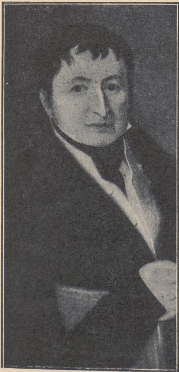
Federico Koenig, inventor de la máquina de cilindros para imprimir

Koenig, como casi todos los inventores que han dado gloria a la Humanidad, era de origen y de empleo humilde: un obrero desconocido, insignificante, ni mejor ni peor que otro cualquiera dedicado a la tipografía. Pero llevaba en su cerebro la semilla del genio, y en su voluntad, el vigor y la perseverancia. Había nacido en Eisleben en 1774, y veinte años después ingresaba en los talleres de imprenta de Breitkopf y Hartel. Observando diariamente las máquinas, más que sencillas, rudimentarias, de aquel tiempo concibió la idea, al principio vaga y confusa, de una revolución en el procedimiento. Comenzó por buscar los conocimientos básicos más elementales, de que carecía en absoluto. Era un modelo de auto-educación, que no necesitaba mentores ni consejeros. Y cuando terminaba su tarea profesional, restando horas al descanso y con absoluta privación de recreo, se entregó a los estudios mecánicos. Durante varios años hizo esa vida de aislamiento, de sacrificio, y practicó luego algunos ensayos. No disponía de medios suficientes, y decidió trasladarse a Inglaterra,