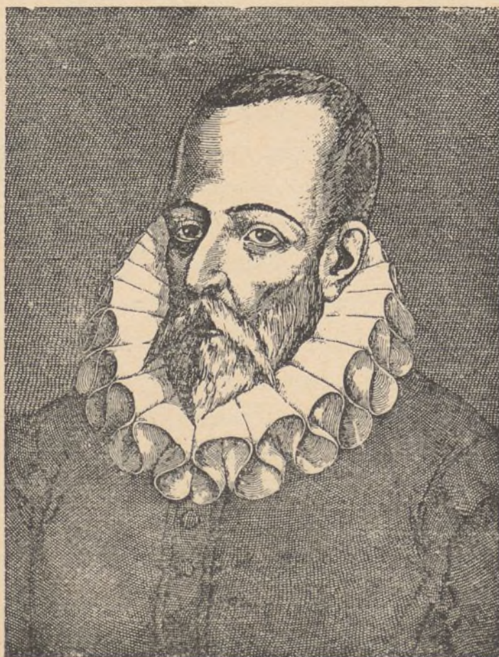
Juan de Jáuregui. Pinta

“Este que veis aquí de rostro aguileño, de cabello castaño, frente lisa y desembarazada, de alegres ojos y de nariz corva, aunque bien proporcionada, las barbas de plata que no ha veinte años que fueron de oro; los bigotes grandes, la boca pequeña, los dientes no crecidos, porque no tiene sino seis y esos mal acondicionados y peor puestos, porque no tienen correspondencia los unos con los otros; el cuerpo entre dos extremos, ni grande ni pequeño; la color viva, antes blanca que morena, algo cargado de espaldas, y no muy ligero de pies: éste digo que es el rostro del autor de “ La Galatea ” y de “ Don Quijote de la Mancha ” y del que hizo el “ Viaje del Parnaso ...” y otras obras que andan por ahí descarriadas, y quizá sin el nombre de su dueño: llámase comúnmente Miguel de Cervantes Saavedra.”