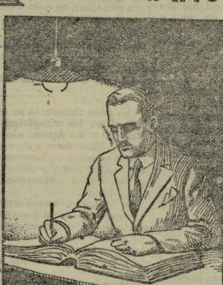
TRABAJANDO con "PHILIPS ARGAT" LLENA DE GAS ARGON