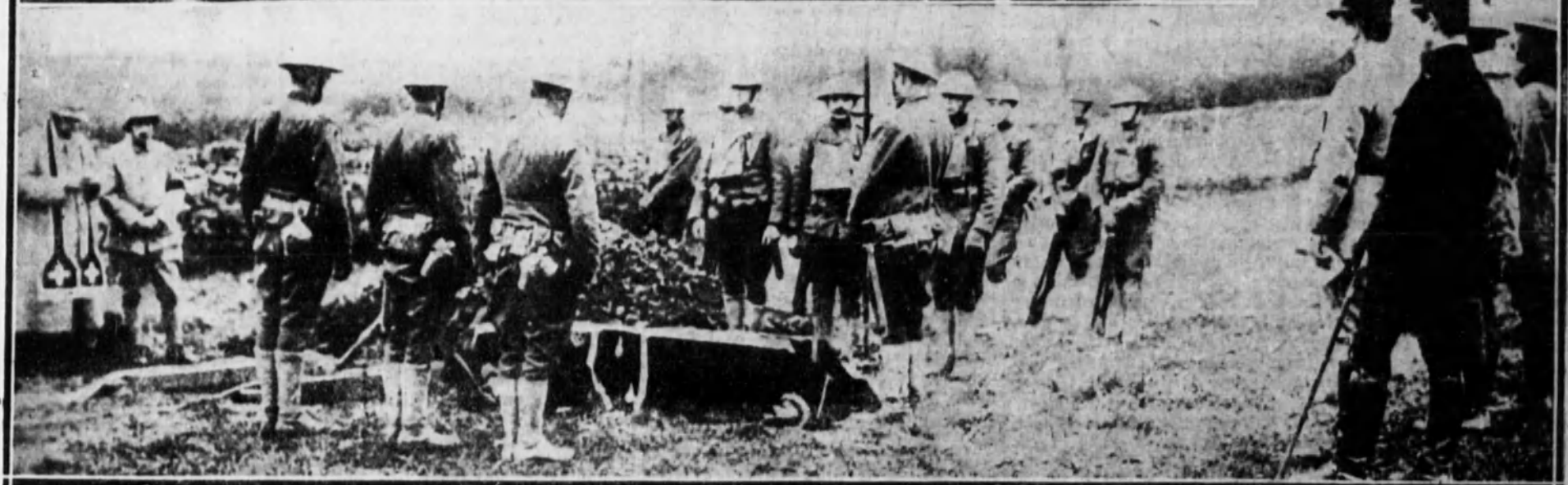
Funerales de un oficial americano muerto heroicamente en el campo de batalla.

LOS HORRORES DE LA GUERRA. — La crueldad inevitable de la lucha y la moral militar de las represalias obligan a los ejércitos beligerantes de uno y otro bando a ejecutar actos de rígida disciplina en que la clemencia del humano corazón ha de enmudecer ante la voz severa e inflexible de la justicia militar. El duro concepto de la moral guerrera castiga con la muerte al espía que se sacrifica por su patria, igual que al traidor que la vende y deshonor.