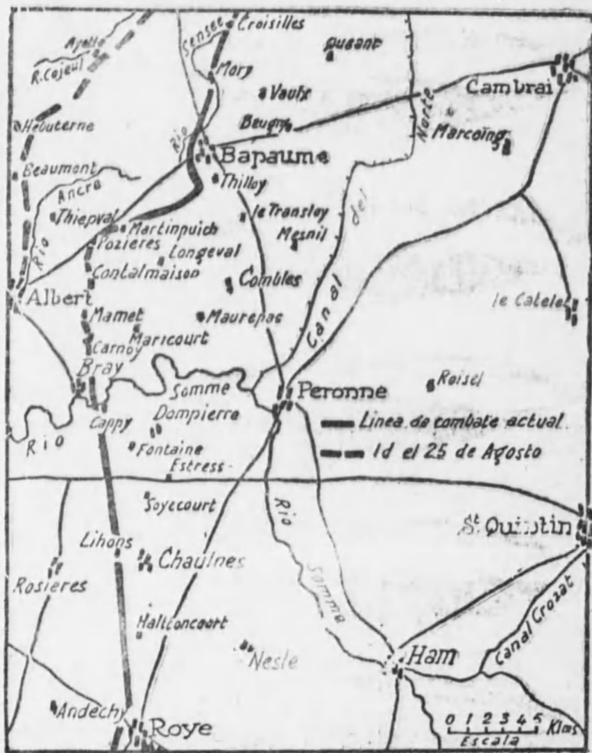
Gráfico de los lugares últimamente ocupados por los ejércitos franco-ingleses en la región de Bapaume

LONDRES 27. — Ayer al mediodía y por la tarde tuvieron lugar violentos combates en el antiguo campo de batalla del Somme, entre Maricourt y Bapaume, así como al Norte de esta población.