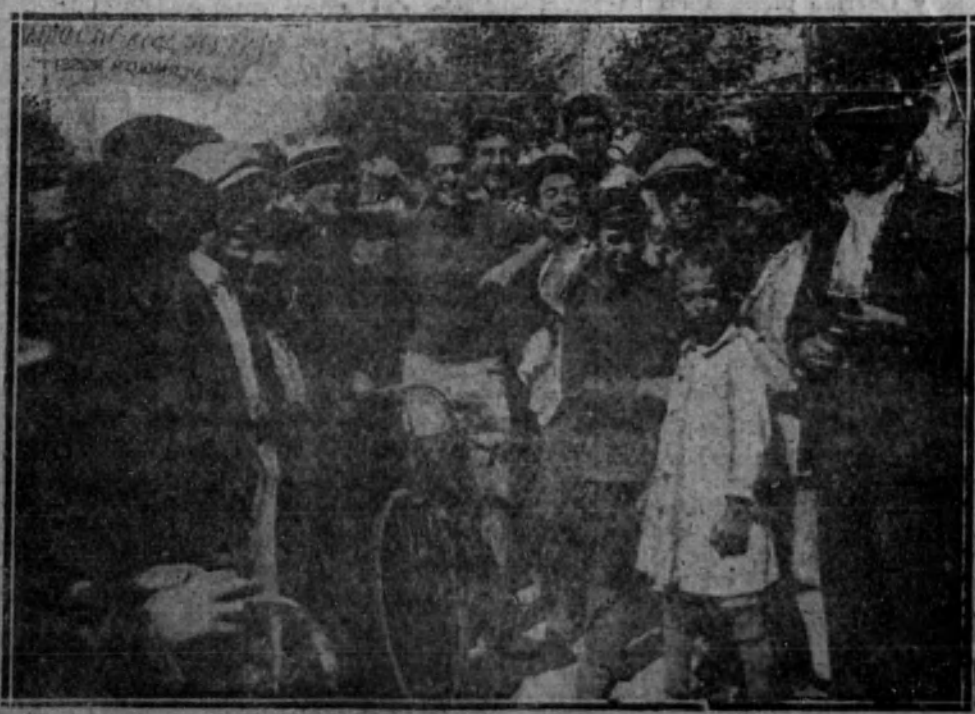
De la carrera ciclista cinematográfica organizada en el Parque.