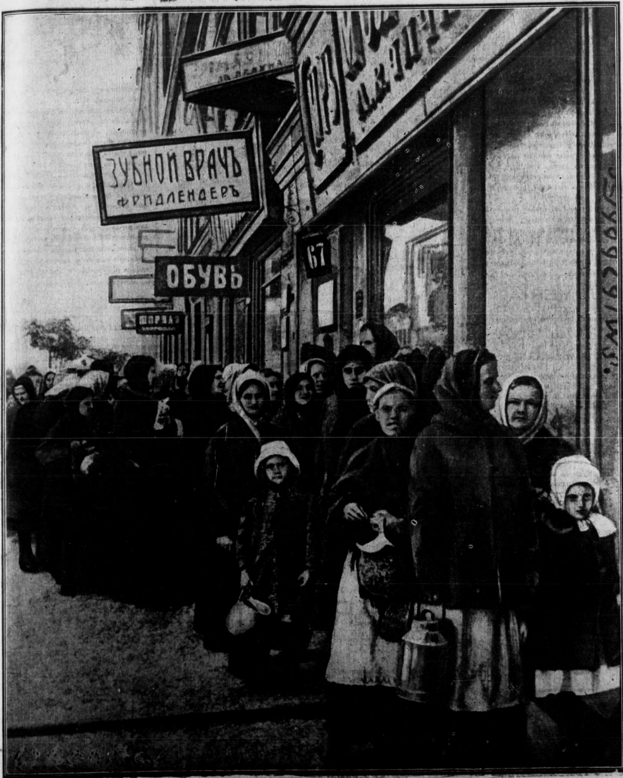
EL HAMBRE EN PETROGRADO. — Mujeres del pueblo ruso esperando a la entrada de un establecimiento de comestibles, para adquirir subsistencias