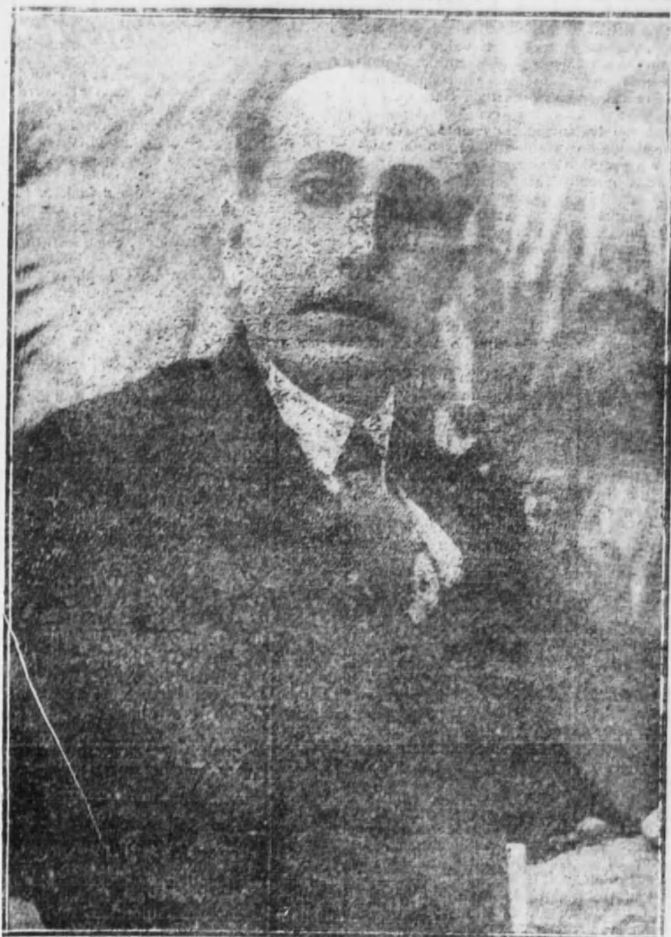
El admirable poeta Amado Nervo ha sido agasajado al llegar a México y al pasar por la Habana con las más efusivas manifestaciones de admiración y entusiasmo. He aquí el último retrato del poeta que tantos años ha vivido en España, y en una tarea literaria sin descanso ha enriquecido desde Madrid, en singular medida, las bellas letras castellanas.