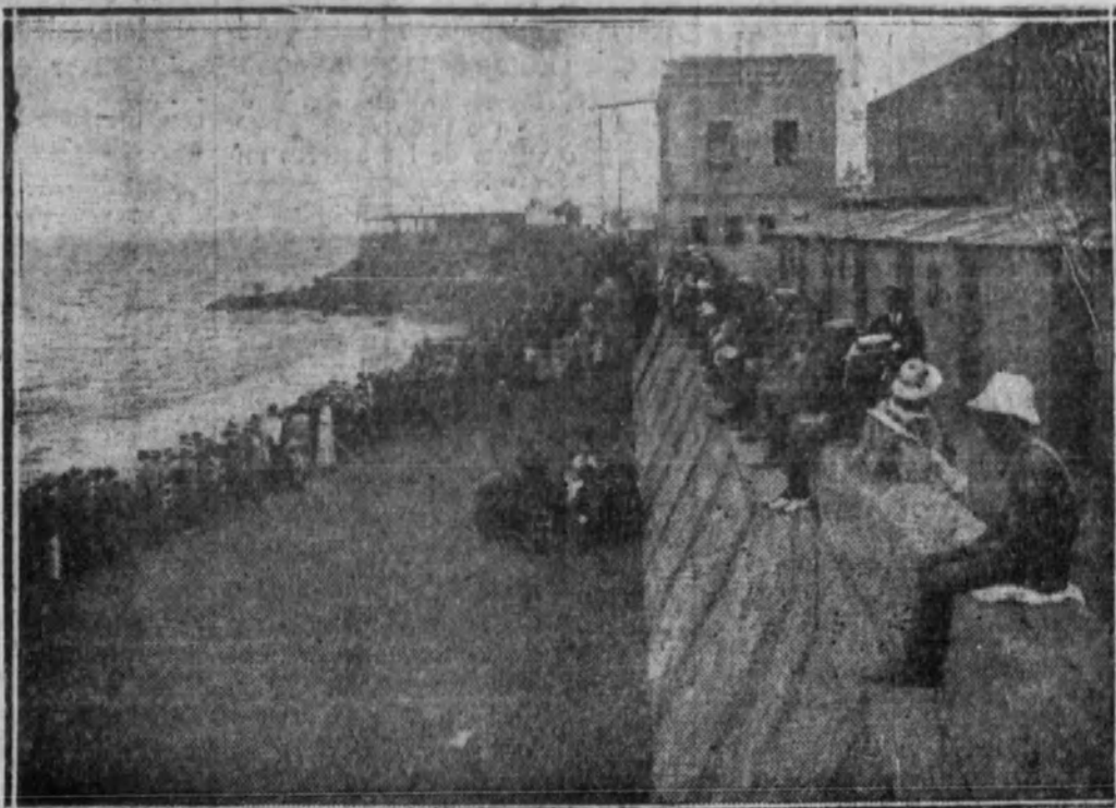
Aspecto que ofrecía la playa durante el concurso de natación.