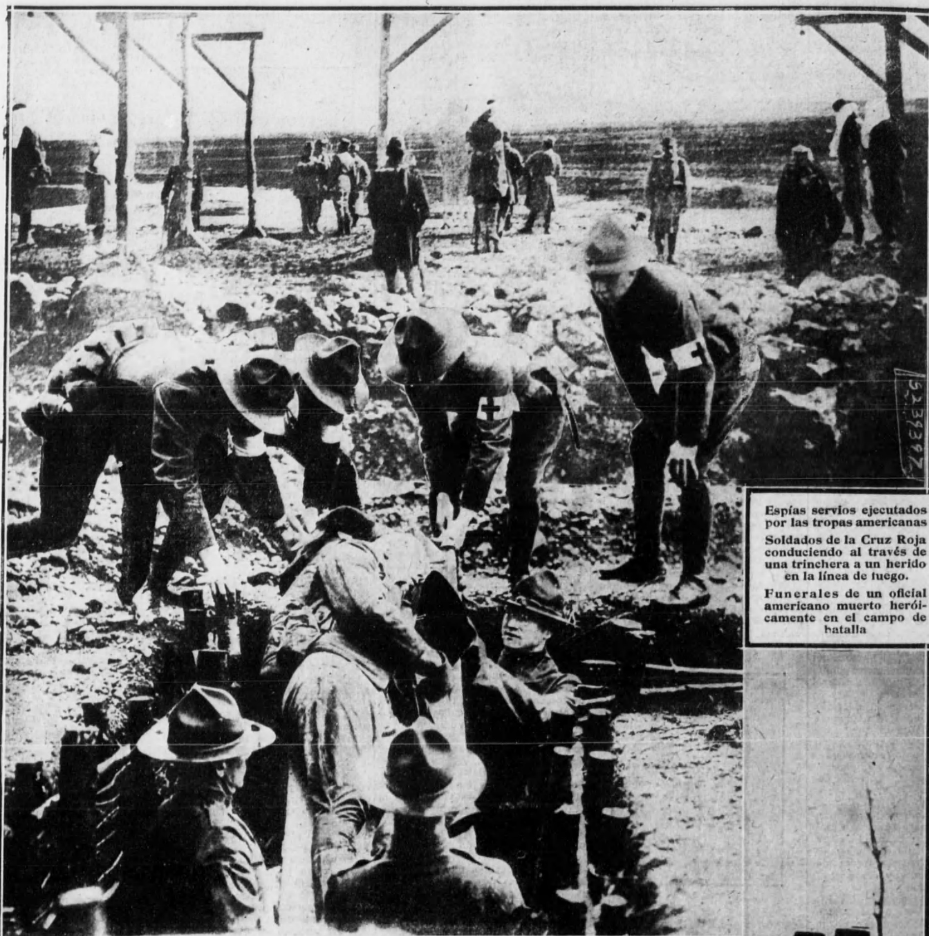
Espías serbios ejecutados por las tropas americanas. Soldados de la Cruz Roja conduciendo al través de una trinchera a un herido en la línea de fuego.

DIARIO GRAFICO DE INFORMACION (SEGUNDA EPOCA)