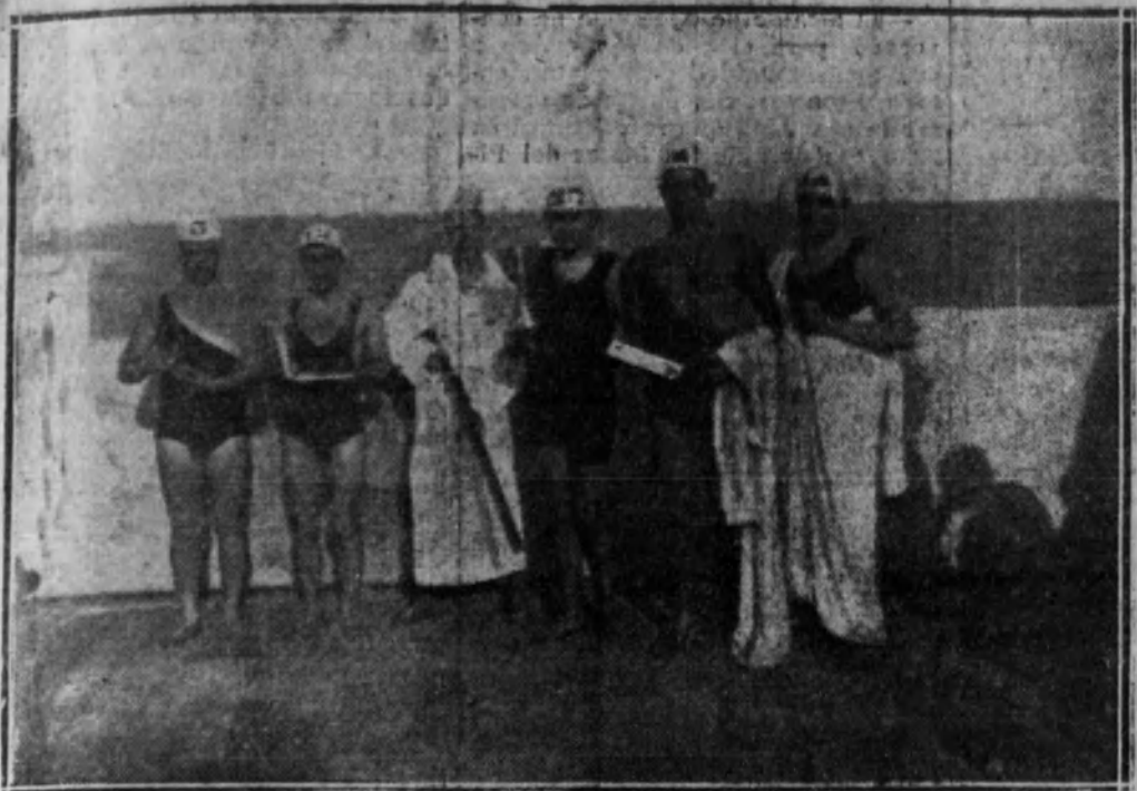
Los nadadores antes de comenzar la carrera.