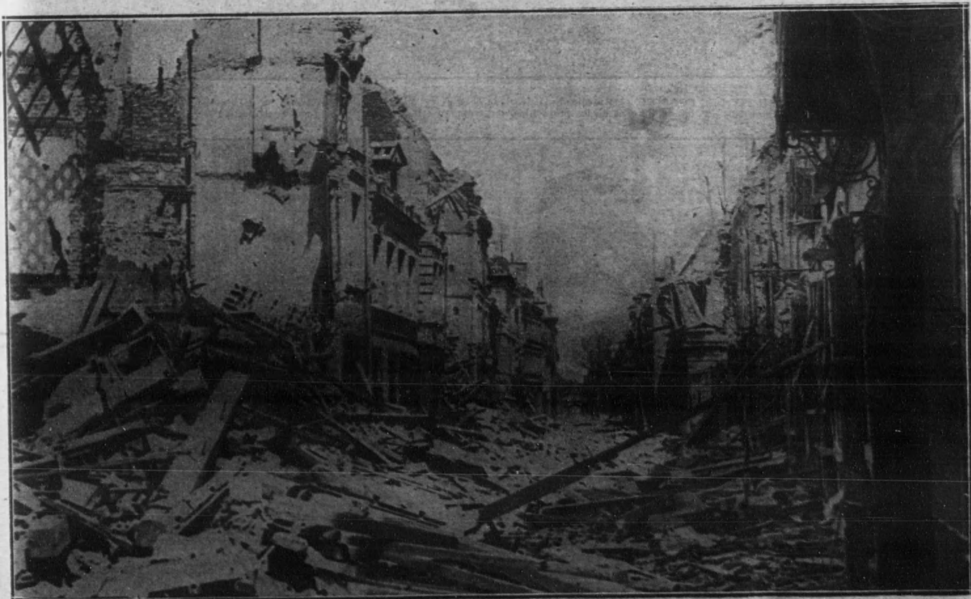
La calle del Presidente Sadi Carnot, en Bethune.