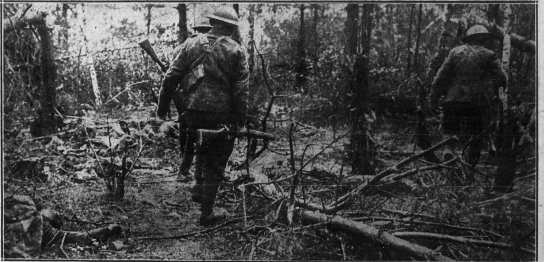
LA LUCHA EN FRANCIA.—Patrulla de soldados ingleses avanzando al través de un bosque evacuado por el enemigo. (En primer término, a la izquierda del grabado, el cadáver de un alemán.)