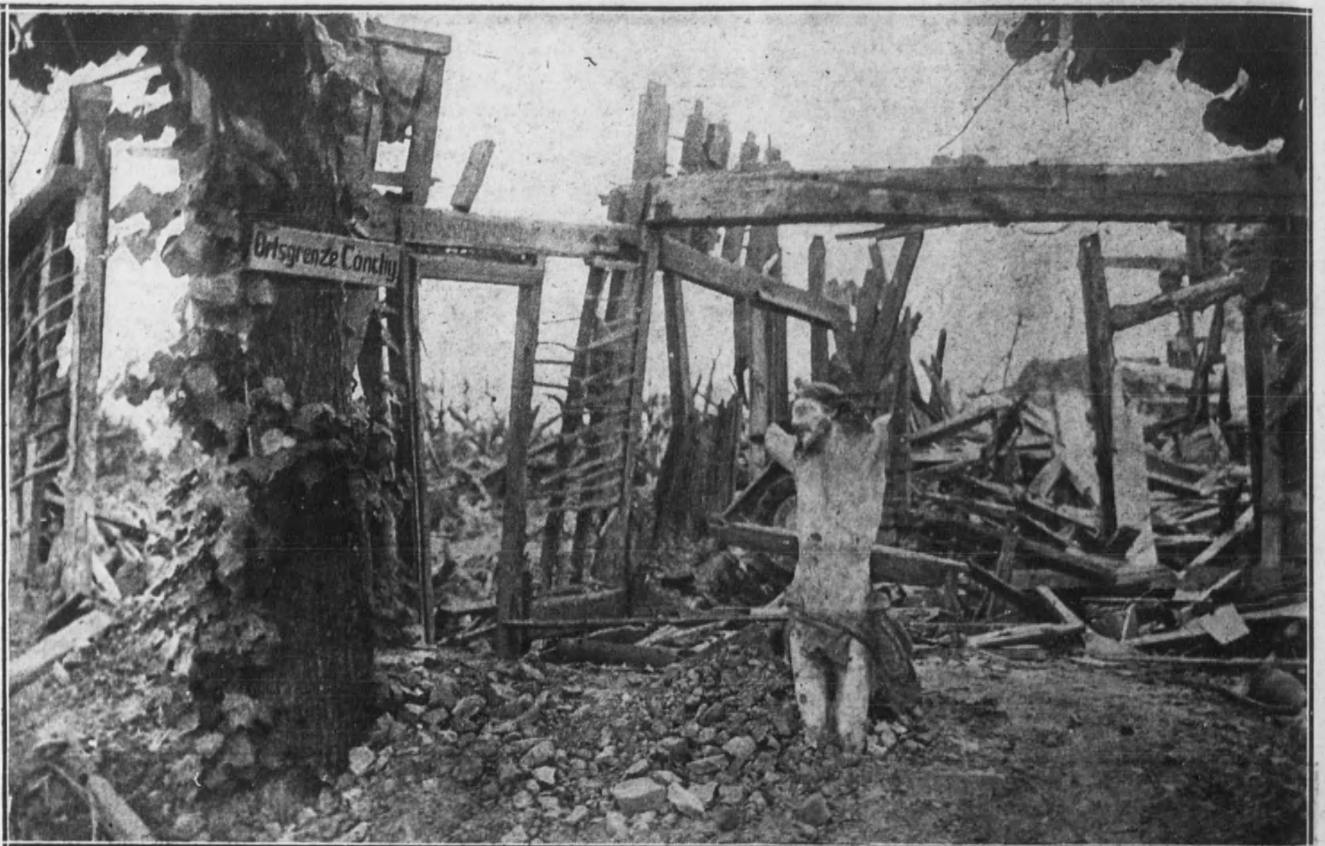
RUINAS DE LA VILLA DE COUCHY LES POI-OISE.—En medio de la desolada destrucción que el paso de la Muerte ha dejado impreso en estas ruinas, la imagen del Salvador, mutilada por las explosiones de los proyectiles, se yergue en este solitario rincón, como simbolizando la paz del futuro.