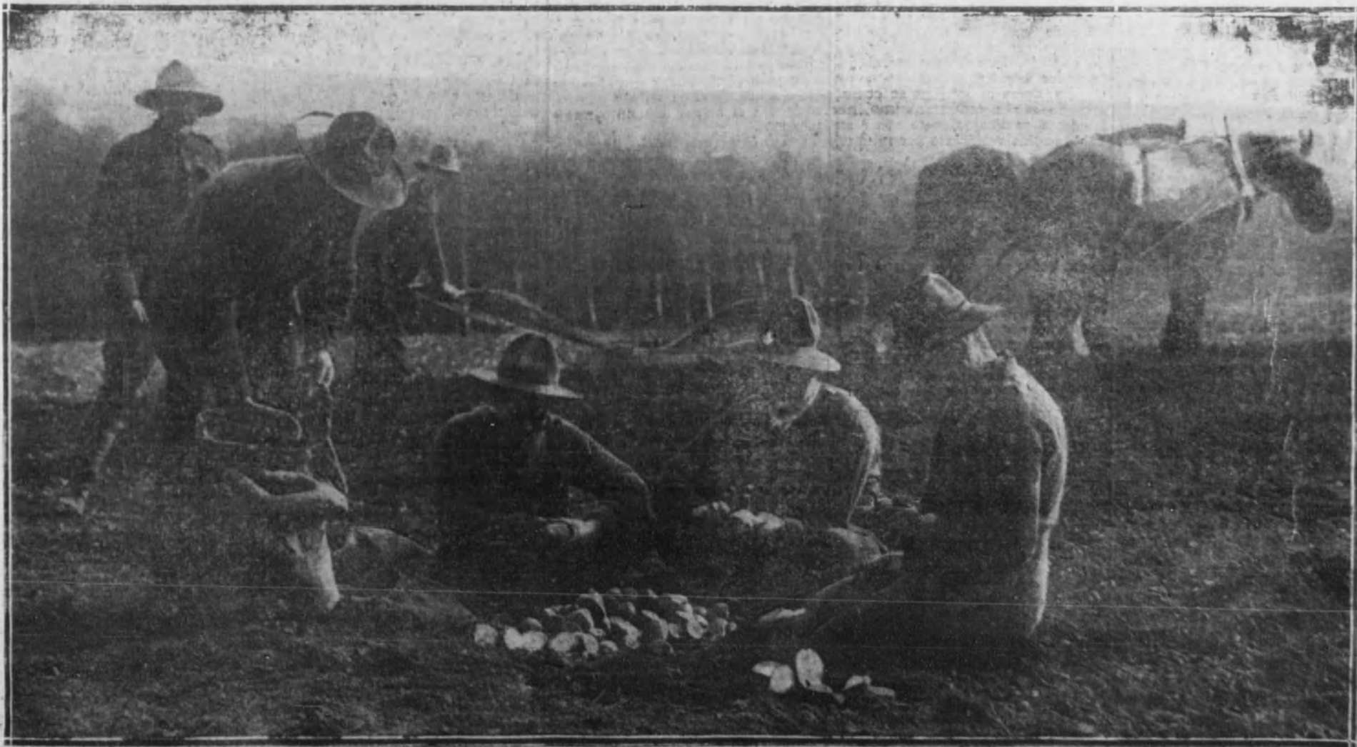
Soldados canadienses dedicados a las faenas agrícolas de la siembra en los campos conquistados de Francia