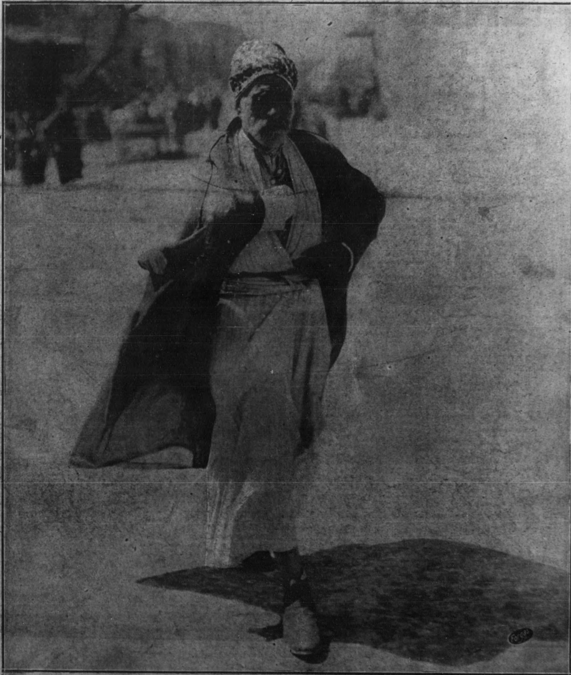
LA GUERRA EN ORIENTE.—Mendigo, en una calle de Bagdad.