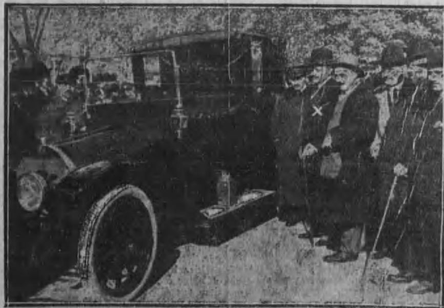
El alcalde de Madrid pasando revista a los automóviles de alquiler

Art. 2.º Las defensas terrestres de las bases navales, con todos los elementos de material terrestre fijo y móvil, comprendiendo las