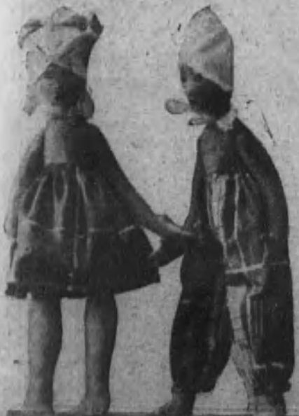
Matrimonio «algo» indostánico y algo amigo de Baby.