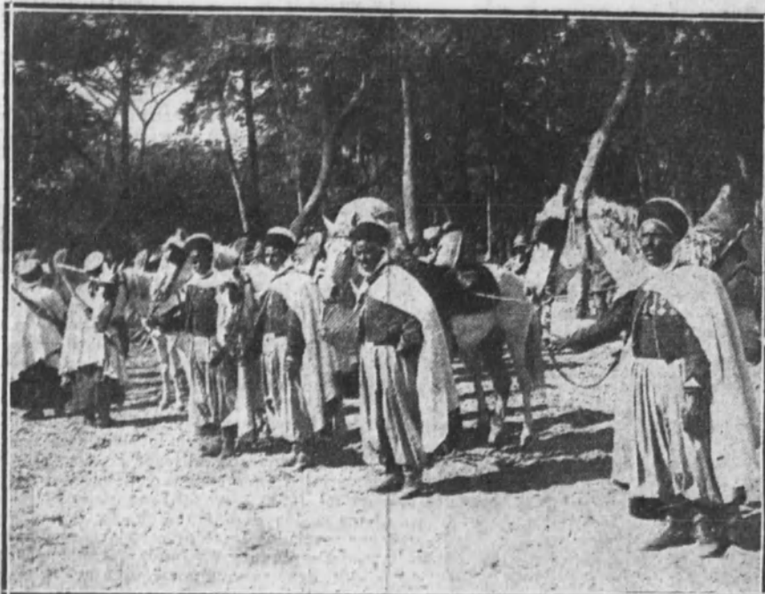
EN EGIPTO.—Regimiento de caballería de «spahis», pertenecientes a las tropas coloniales francesas, durante una revista de caballos en el campamento.