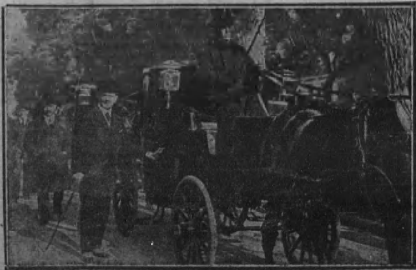
El alcalde de Madrid revistando los coches de punto

baterías de costa, los parques, cuarteles y demás establecimientos dependientes del ramo de Guerra, así como las fuerzas del Ejército, seguirán al mando de un general del Ejército. El capitán general de la región, por lo que se refiere únicamente a lo que integran las defensas terrestres, ejercerá su jurisdicción en cuanto se refiere al mando, disciplina y orden en éstas.