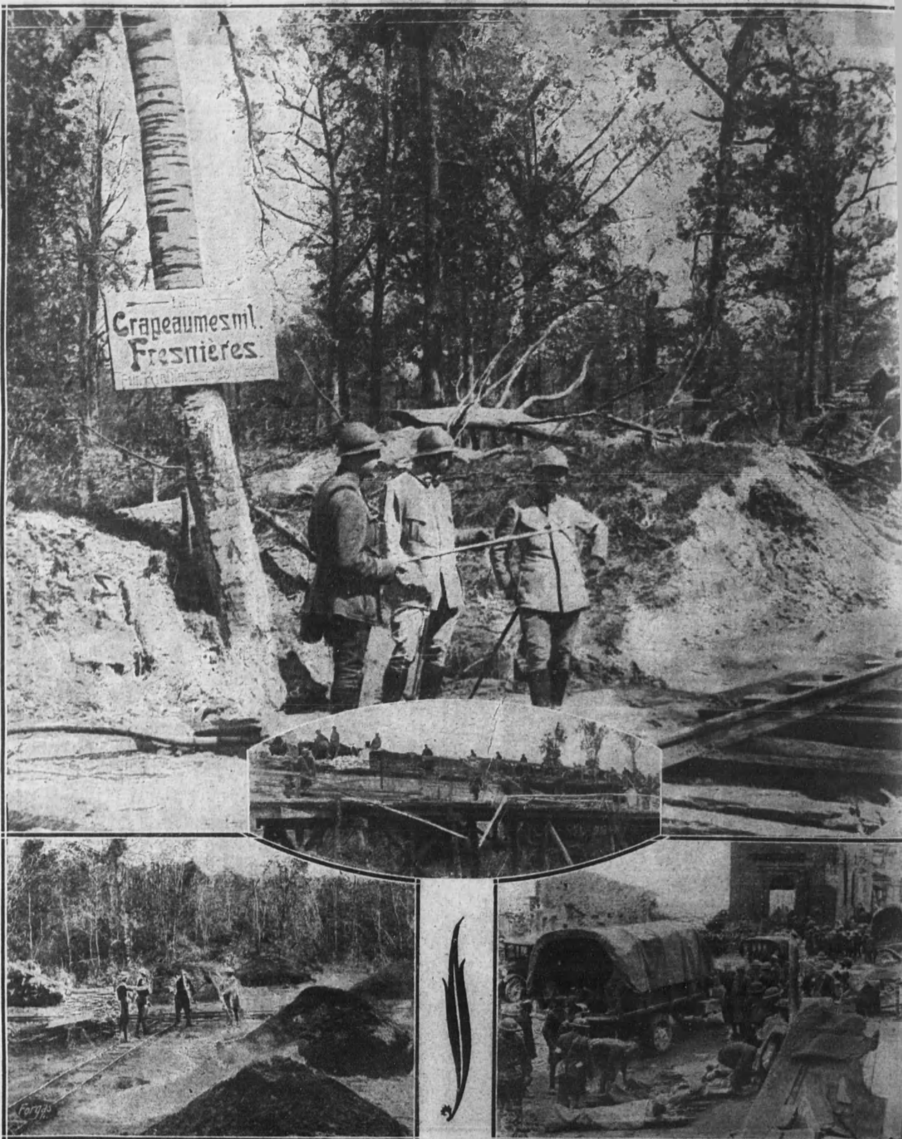
1. Oficiales franceses reconociendo la línea férrea instalada por los alemanes entre Crapeaumesnil y Fresnières, cuya zona fué reconquistada al principio de la actual ofensiva.—2. Artillería ligera norteamericana cruzando un puente reconstruido por los ingenieros después de haber sido volado por los alemanes durante su retirada en este sector.—3. «Tommies» utilizando los hornos de carbón que los alemanes tenían preparados para la invasión en los bosques de Benoit, y que abandonaron en la actual retirada.—4. Camiones de la Cruz Roja norteamericana transportando a un hospital de sangre, instalado en el sector, a los soldados alemanes heridos, hechos prisioneros durante el combate.