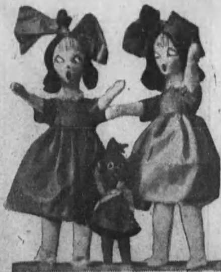
Dos hermanitas, con su «Kiriki» negro, muy amigas de Baby.