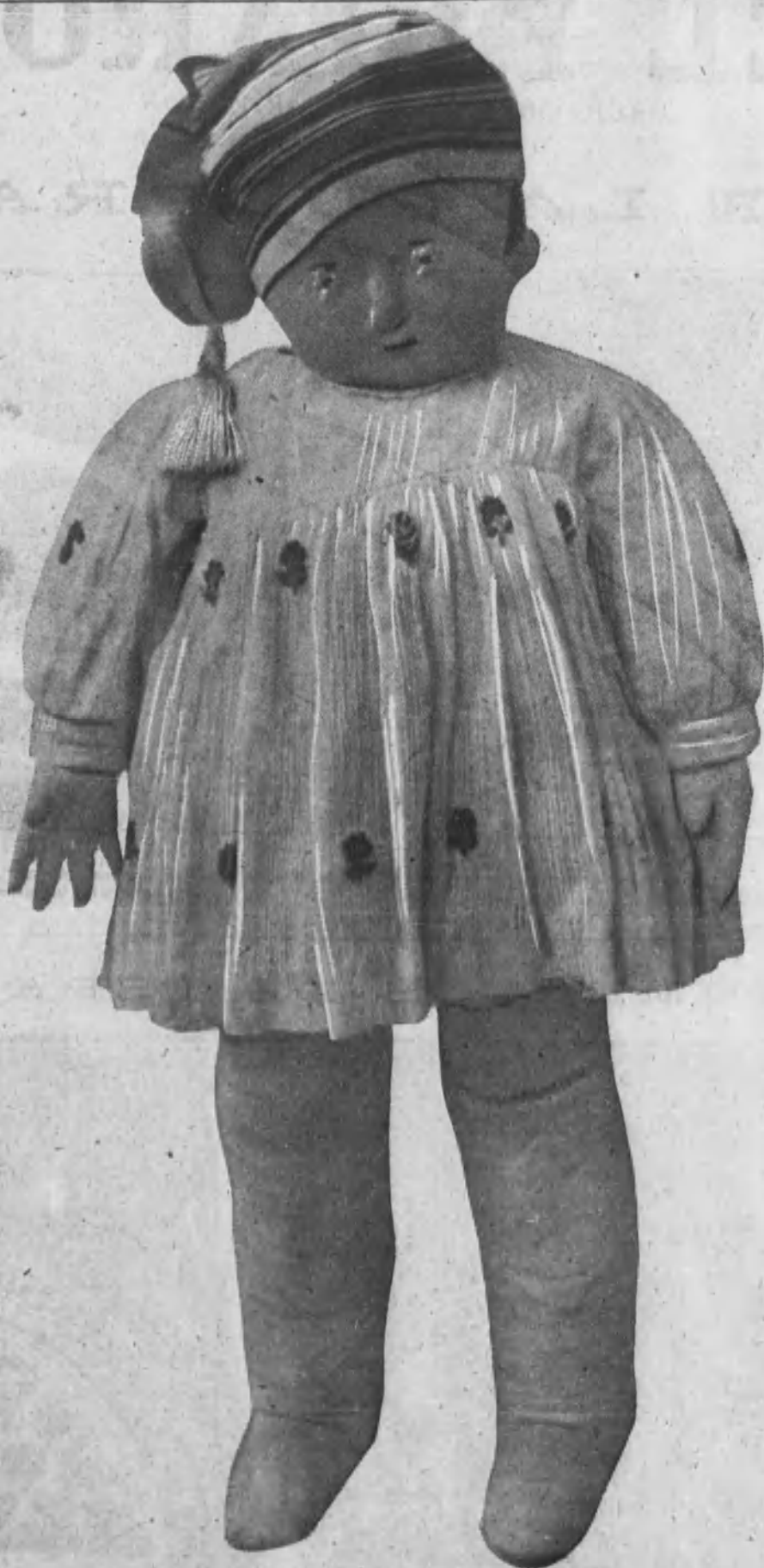
El señor Baby en traje de «andar por casa».

Todas las fantasías arquitectónicas en su múltiple variedad de estilos se nos muestran de pronto a los ojos en una tumultuosa exposición mareante y deslumbradora: estas perspectivas y estos escorzos de recias fábricas acuden por todas partes a nuestra mirada en un bello y grato desorden perfectamente organizado; naves de templos románicos; claustros de opulenta columnata con capiteles floridos; barrocos frontis de puertas del Renacimiento; camaretas y miradores del más puro arte árabe, con la piedra