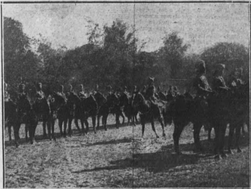
EN EGIPTO.—Regimientos de caballería indostánica, pertenecientes a las tropas coloniales inglesas que combaten en Oriente.