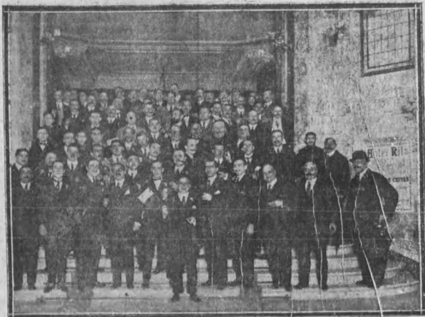
Los comerciantes del ramo de automóviles que celebraron, con un banquete en el Palace, el triunfo de las armas aliadas, que ha traído la paz a Europa.