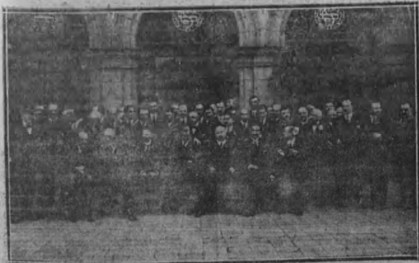
EN SAN SEBASTIAN.—Banquete celebrado en el Gran Casino para festejar el triunfo de las naciones aliadas.

La Escuela Central de Comercio especial de intendentes mercantiles anuncia una serie de conferencias, que se darán en su local (Carretas, 14) en los días y por los profesores que se indican en el tablón de anuncios de dicho Centro de enseñanza.