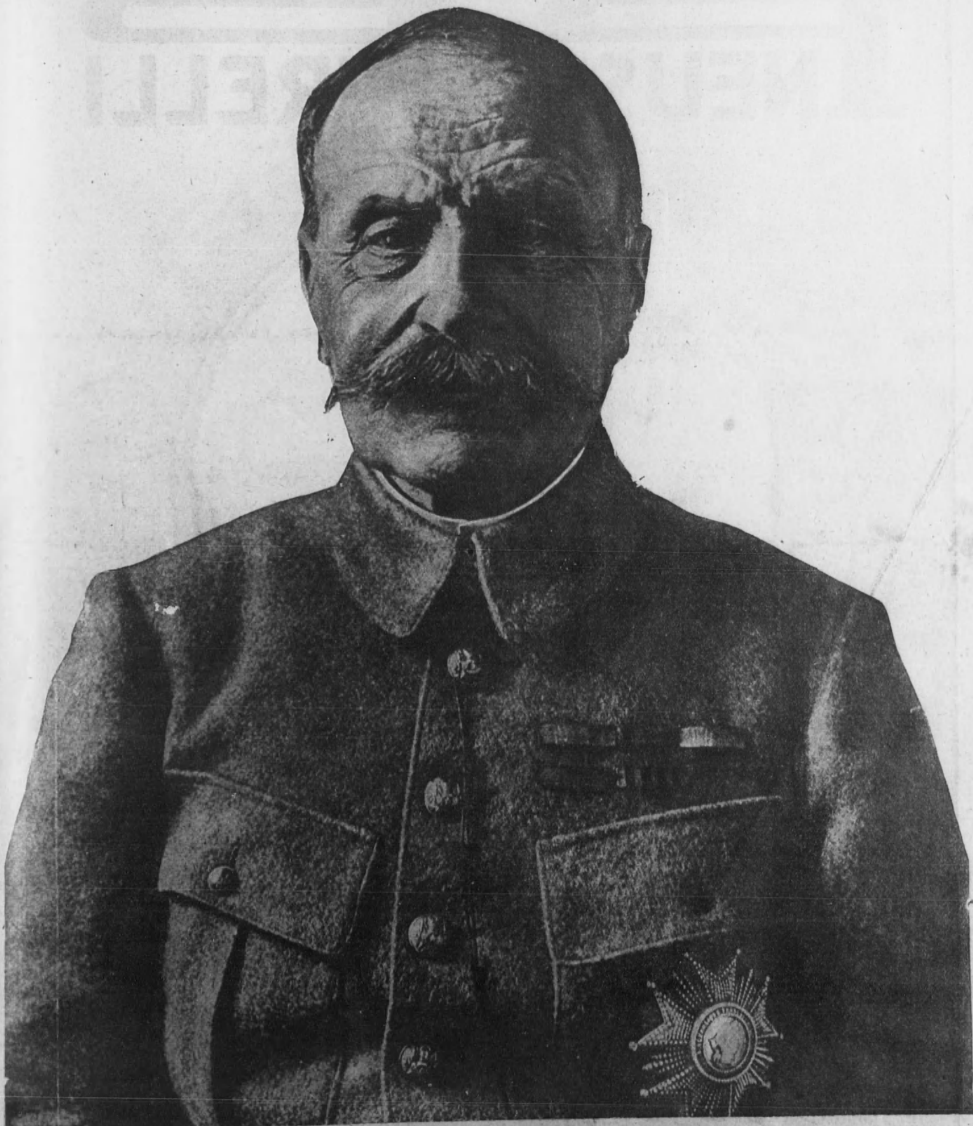
FIGURAS DE LA GUERRA.—El generalísimo Foch, héroe de Francia.

Francia, la de los grandes destinos, vuelve, en la hora presente, a libertar al mundo de la esclavitud de las viejas normas autocráticas. Como en el 93, aquellos hombres libertarios que escalaron los tronos y derrumbaron monarquías, hoy también los hombres de la Francia inmortal conmueven los pretorianos sillones, donde el despotismo y la ambición tienen vieja raigambre. El héroe de Francia es, en la hora presente, el héroe del mundo. Foch, viejo mosquetero, que, como D'Artagnan, ha conquistado el bastón de mariscal en el campo de batalla, dicta al enemigo vencido la ley de la Victoria, severa, pero justa. Y otra vez Francia la grande, con el sacrificio generoso de sus hijos, fecunda la tierra de espíritu de libertad, ahuyentando definitivamente el negro espectro de la opresión esclavizadora de los tronos de hierro. Foch, el genio que ha vencido a la ciencia militar, proclamada por los fanáticos como invencible, la espada que ha dado el golpe certero y definitivo al monstruo de la guerra, merece bien de todos los pueblos.