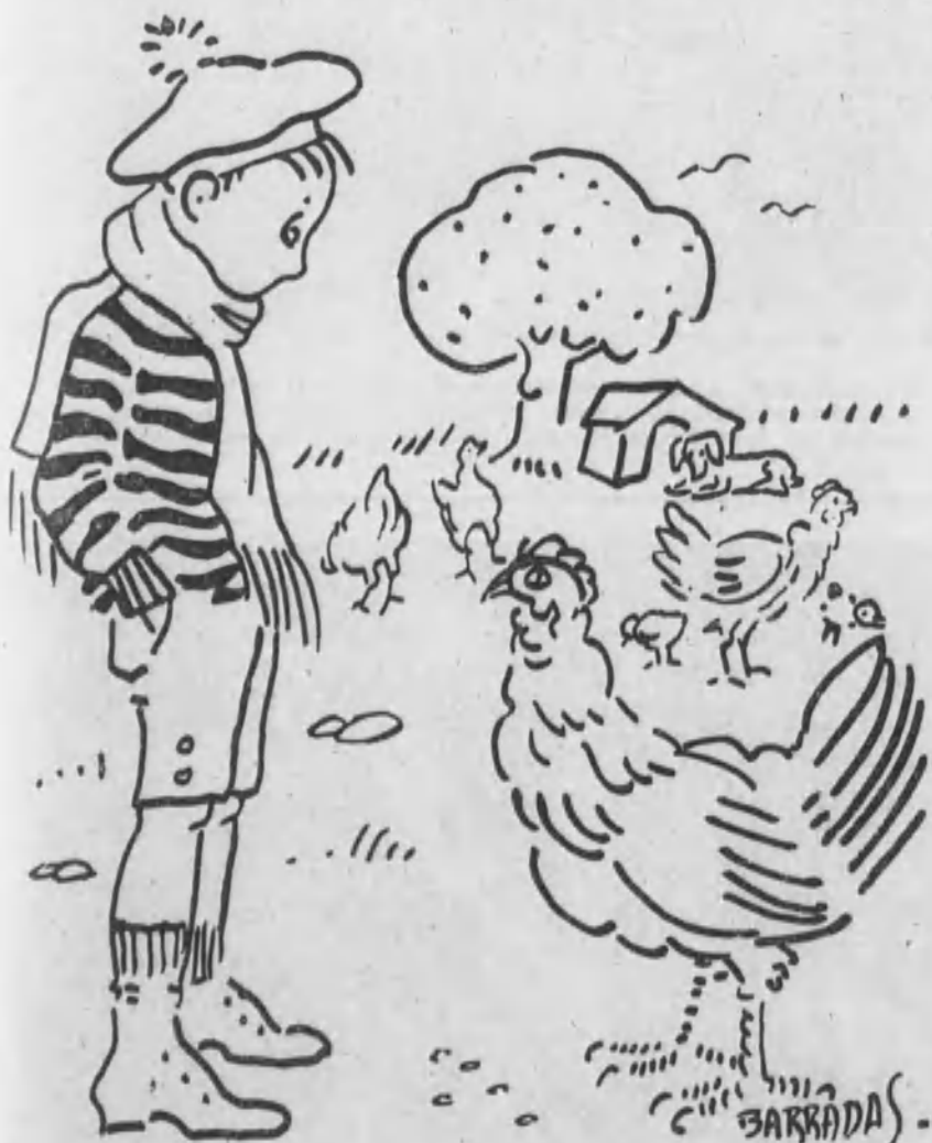
Llevó a la gallina más vieja del gallinero a un lugar aparte...

tes pero como procedía siempre con método, ordenaba sus preguntas, y hasta no satisfacer una no emprendía la investigación de otra. Paquito, sin resultar niño prodigio o hacerse antipático, era un chiquitín muy inteligente y algo filósofo.