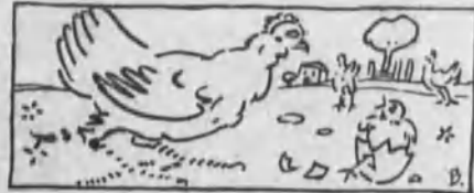
La gallina le dió unos picotazos...

engañar al zorro, y desde aquel día comió cal y caliche, para que sus hijos saliesen envueltos en yeso. Y esta precaución la adoptaron, desde ese día, todas las aves del mundo.