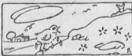
Pelusín vió de pronto, detrás de unas hierbas altas...

—Puesto que se trata de cosas pacíficas... querido Paquín, preguntame lo que quieras,