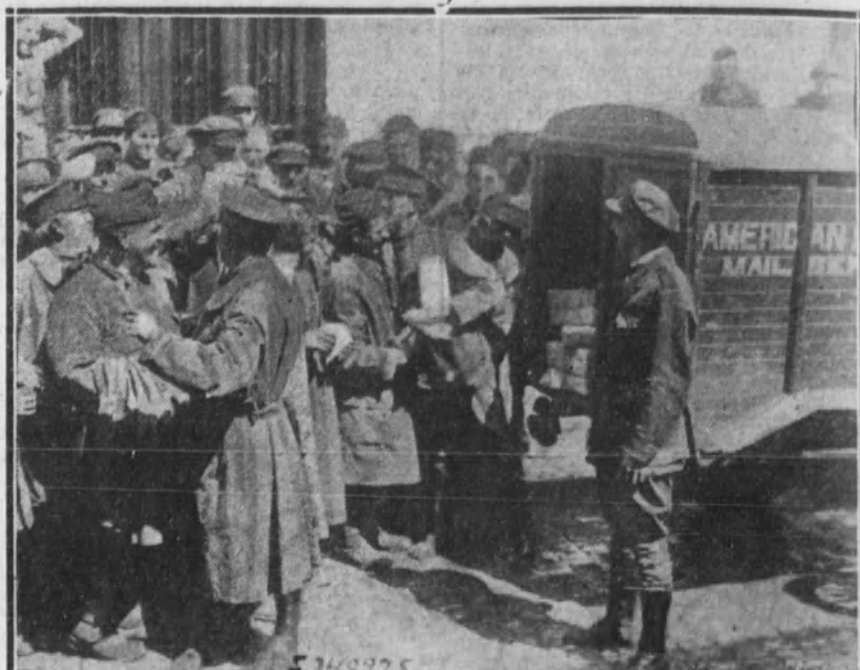
EN FRANCIA.—Grupo de conductores de ambulancias de la Cruz Roja norteamericana de servicio en el sector, recibiendo con gran júbilo la noticia del armisticio, que le es comunicada por los compañeros a su regreso de la capital de Francia.