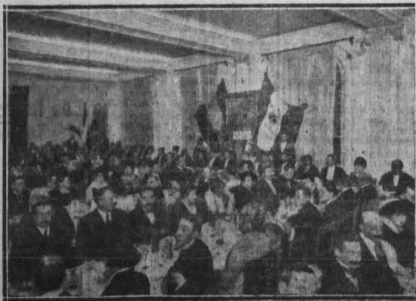
Banquete organizado por la Sociedad Victoria Italiana en el Majestic Hotel, de Barcelona

Teléfono de EL FIGARO 15-02 M. Apartado de Correos núm. 800