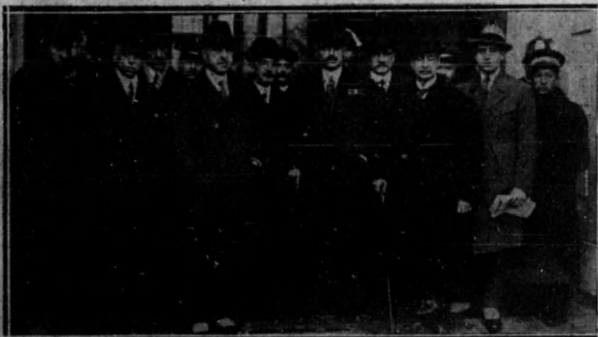
El presidente de la Diputación de Burgos saliendo con el resto de la Comisión, después de haber conferenciado con el Rey respecto de las autonomías regionales.