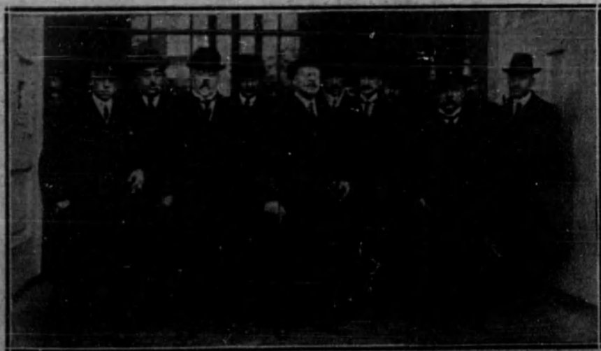
La Comisión de la Diputación de Avila saliendo de conferenciar con Su Majestad el Rey sobre el asunto de las autonomías regionales.