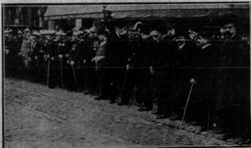
BARCELONA.—Las autoridades civiles y militares presenciando el desfile de los regimientos de Artillería, en el día de la fiesta de Santa Bárbara, Patrona de los artilleros.