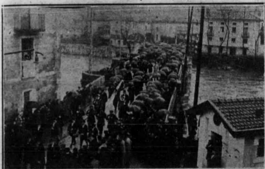
Las cuatro Diputaciones vascongadas, precedidas de los Ayuntamientos de Guipúzcoa, al llegar a Tolosa para organizar la petición de la autonomía.