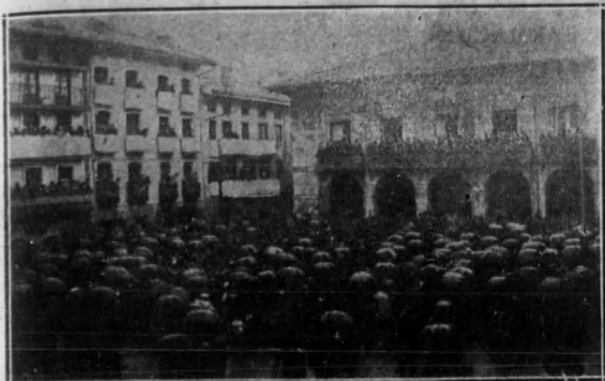
Aspecto de la plaza de los Fueros, de Tolosa, durante la Asamblea magna celebrada para organizar la petición al Poder central de la autonomía.