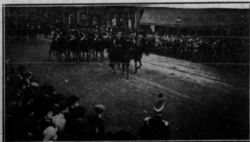
BARCELONA.—Los regimientos de Artillería en traje de gala, desfilando por las ramblas barcelonesas con motivo de las fiestas de Santa Bárbara, Patrona de este Armá.