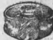
Núm. 4.—8 gramos Ptas. 30