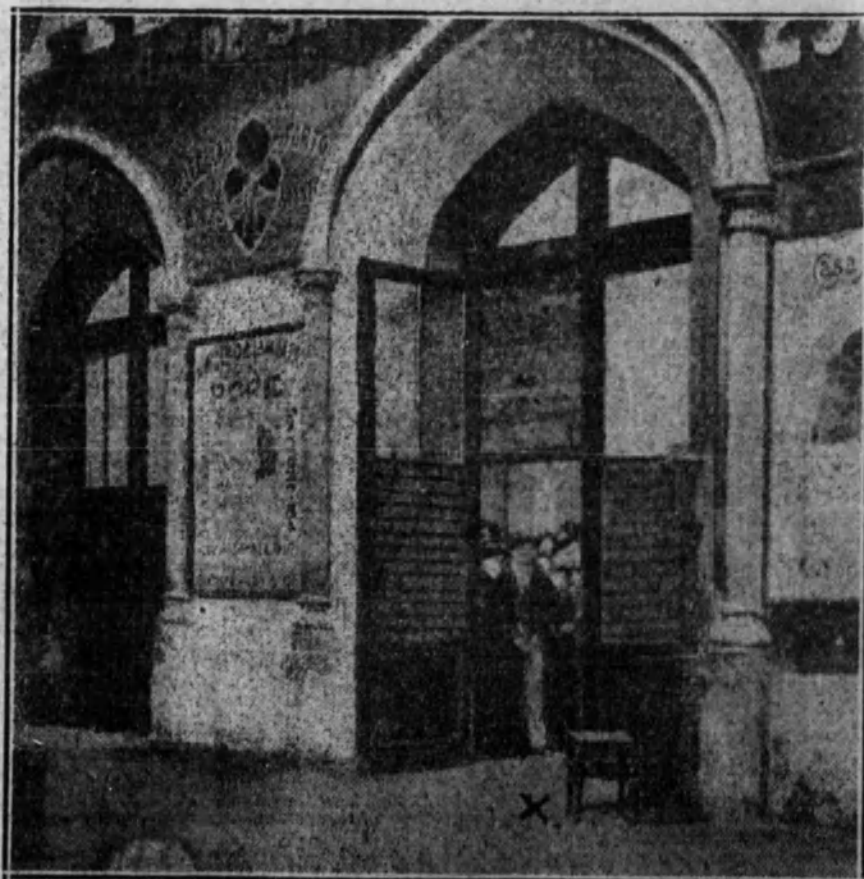
LISBOA.—Puerta de viajeros de la estación del Rocio. El lugar que aparece marcado con el aspa fué el sitio donde los anarquistas realizaron la agresión que causó la muerte al presidente portugués Sidonio Paes.