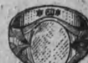
Núm. 12.—16 gramos Ptas. 60