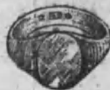
Núm. 2.—6 gramos Ptas. 22,50