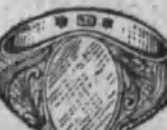
Núm. 11.—15 gramos Ptas. 56,25