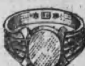
Núm. 5.—9 gramos Ptas. 33,75