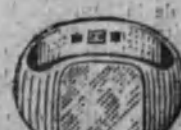
Núm. 15.—20 gramos Ptas. 75

FACTURA DE GARANTIA EN TODAS LAS COMPRAS