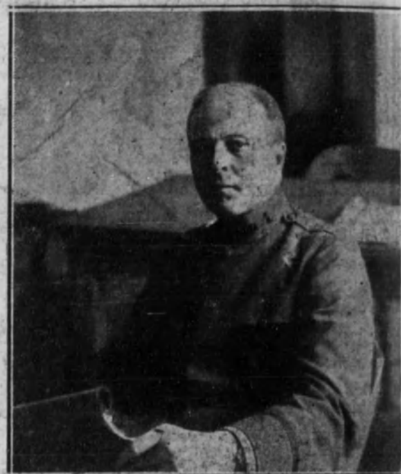
El general de brigada W. S. Pierce, que en el Ministerio de la Guerra norteamericano tiene a su cargo un departamento.