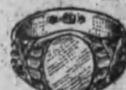
Núm. 6.—10 gramos Ptas. 37,50