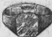
Núm. 1.—6 gramos Ptas. 18,75