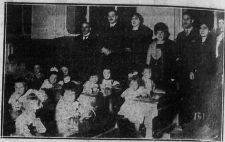
MADRID.—El alcalde en la inauguración de las escuelas de la calle de San Francisco.