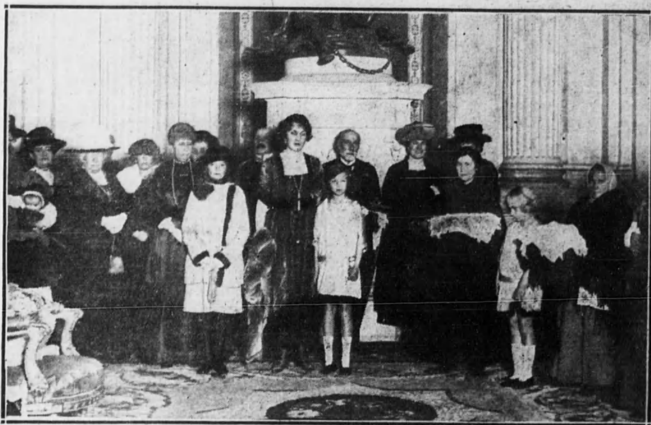
MADRID.—Sus Majestades las Reinas doña Victoria y doña Cristina, la Infanta Isabel y los Infantitos en el acto del reparto de ropas a los pobres, celebrado en el Salón de Columnas del Palacio Real.