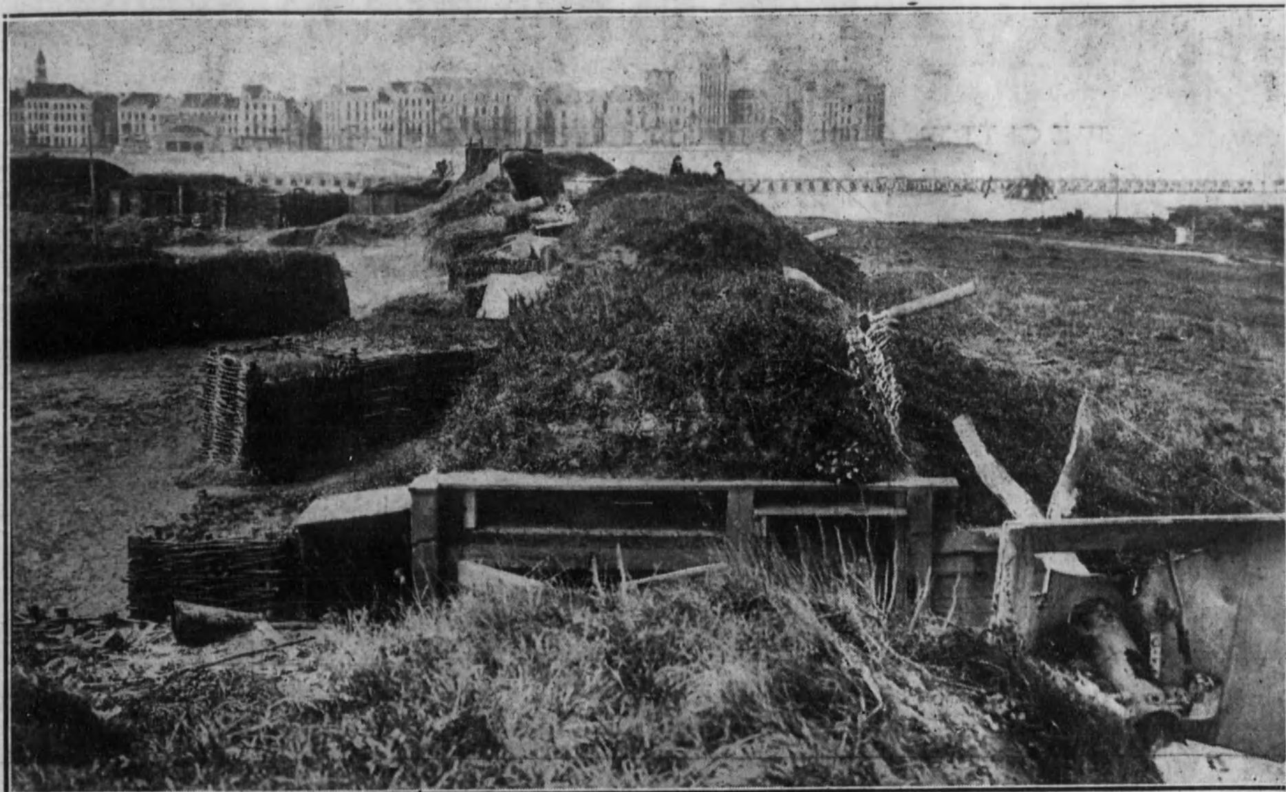
CAPTURA DE OSTENDE. —Para demostrar cómo habían fortificado la plaza los alemanes, por dondequiera que se mire se ven casamatas y cañones. En algunas de aquellas casamatas, los alemanes habían dejado mensajes para los soldados aliados, diciendo: «Mis cumplimientos para vosotros.»