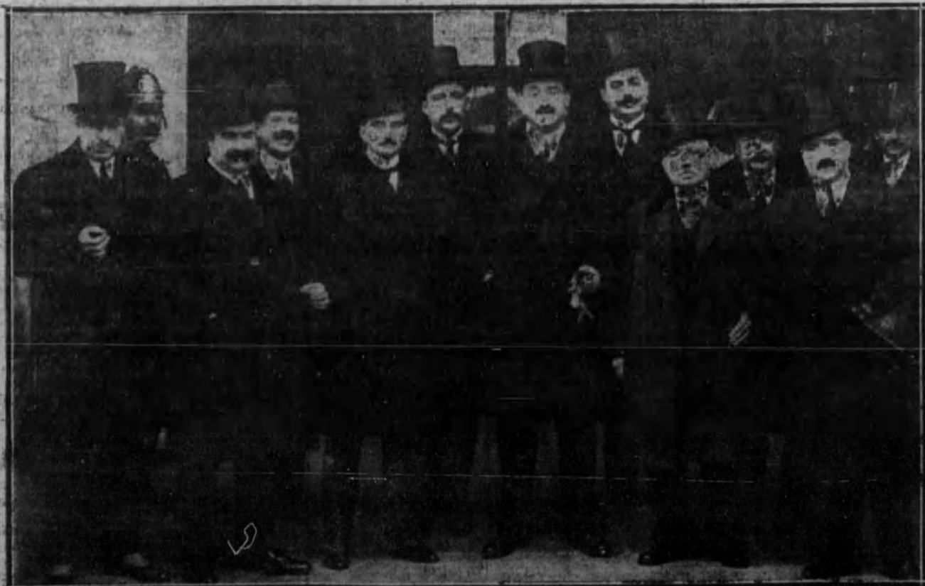
MADRID.—El alcalde y los tenientes de alcalde de Madrid, a su salida de Palacio, después de haber cumplimentado a Su Majestad.

Calle de FERRAZ, 18, al lado del estanco