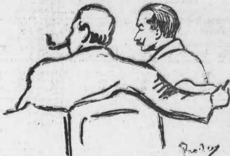
Muñoz Seca y "El Caballero Audaz" presenciando el ensayo general de "La venganza de don Mendo"

—Hola, Perico, ¿cómo le va?... Venga usted que hablemos... Y con suavidad nos apoderamos de él, arrastrándole hasta un rincón solitario del teatro.