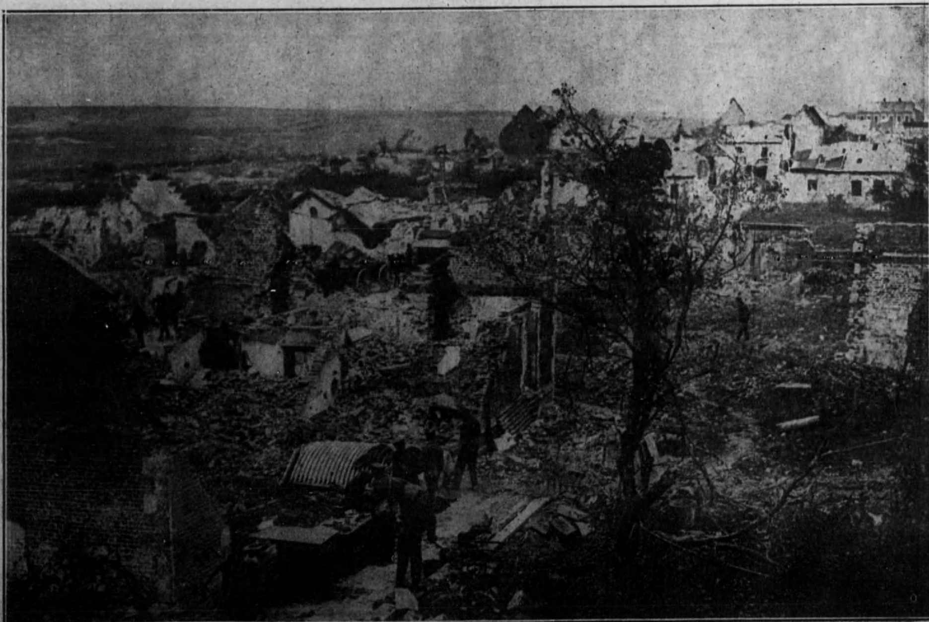
El pueblecillo de Bellicourt, abandonado por los alemanes.