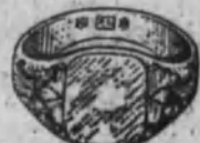
Núm. 3.—7 gramos Ptas. 26,25