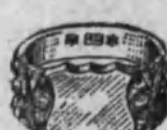
Núm. 8.—12 gramos Ptas. 45