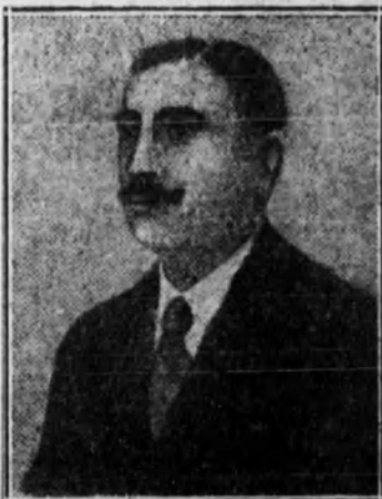
Retrato de Luis Furtado Saraiva, que fué muerto en la estación del Rocio inmediatamente después de haber cometido el asesinato del presidente de la República portuguesa.