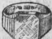
Núm. 10.—14 gramos Ptas. 52,50