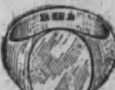
Núm. 14.—19 gramos Ptas. 71,25