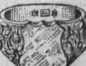
Núm. 13.—18 gramos Ptas. 67,50