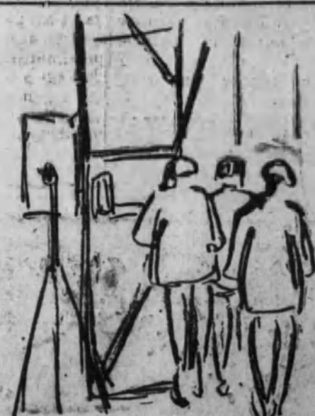
(Por dentro) Los incendiarios