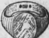
Núm. 7.—11 gramos Ptas. 41,25