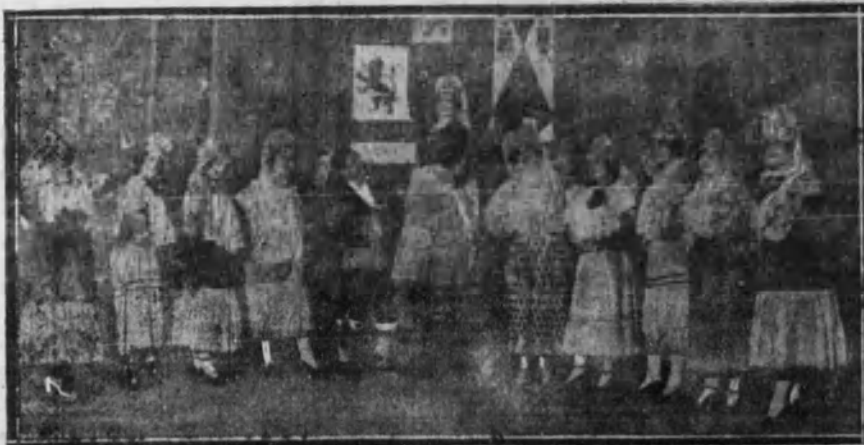
Una escena de la revista musical «El cotarro nacional», estrenada con buen éxito el miércoles por la noche en el teatro de Novedades.

FRONTON MADRID.—A las cuatro de la tarde.—Partidos a raqueta entre señoritas.