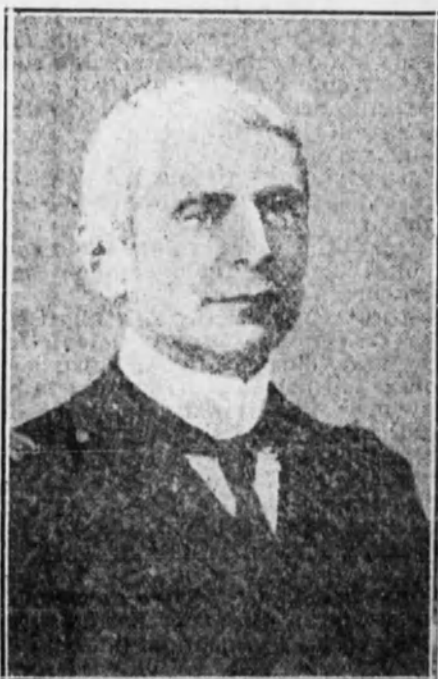
El almirante Canto de Castro, actual presidente del Gobierno portugués, con la cartera del ministerio de Marina, e interinamente la de Negocios Extranjeros.