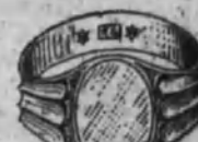
Núm. 9.—13 gramos Ptas. 48,75