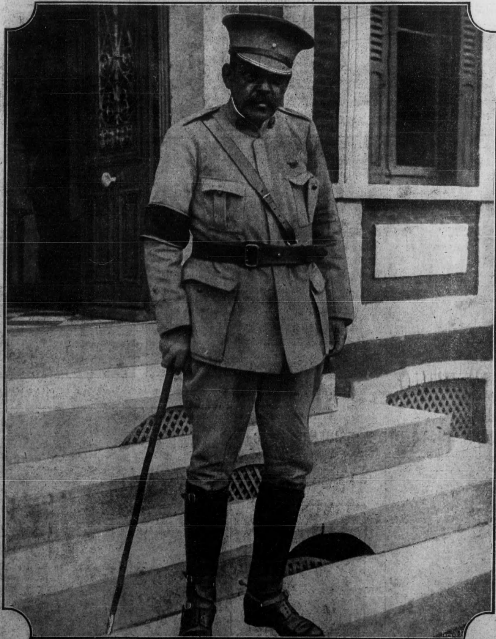
FIGURAS EXTRANJERAS. —El comandante general Tamagnini, jefe de las fuerzas expedicionarias portuguesas que han combatido en Francia. La figura de este caudillo del Ejército portugués es en la presente hora una de las personalidades más salientes de la actual situación política de la República portuguesa, a consecuencia del asesinato del presidente Paes.