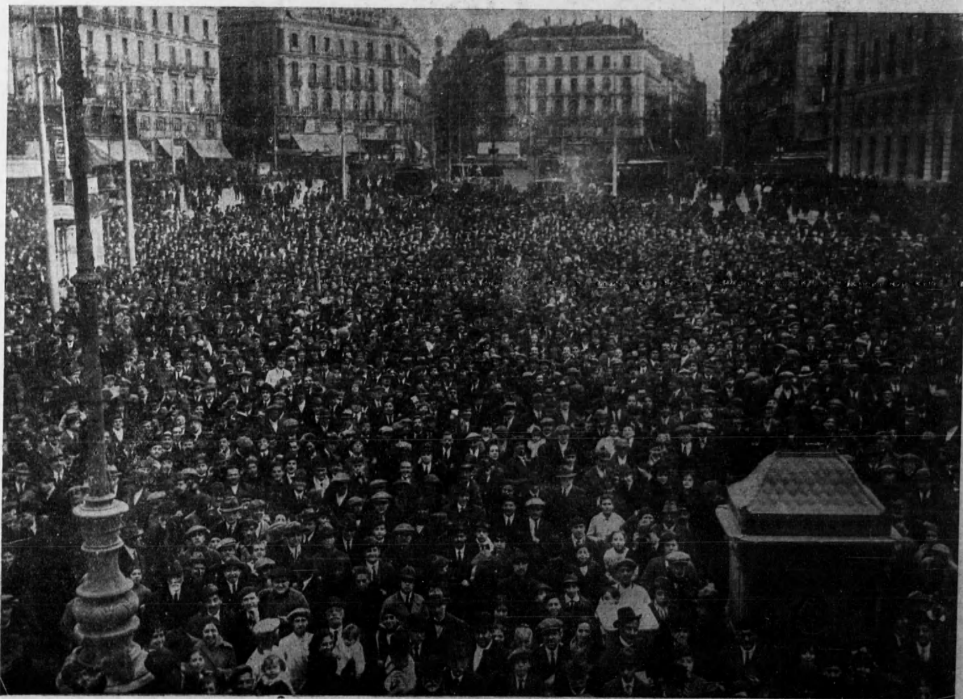
El público estacionado en la Puerta del Sol contemplando en los transparentes de los periódicos los números premiados en el sorteo durante la mañana de ayer.