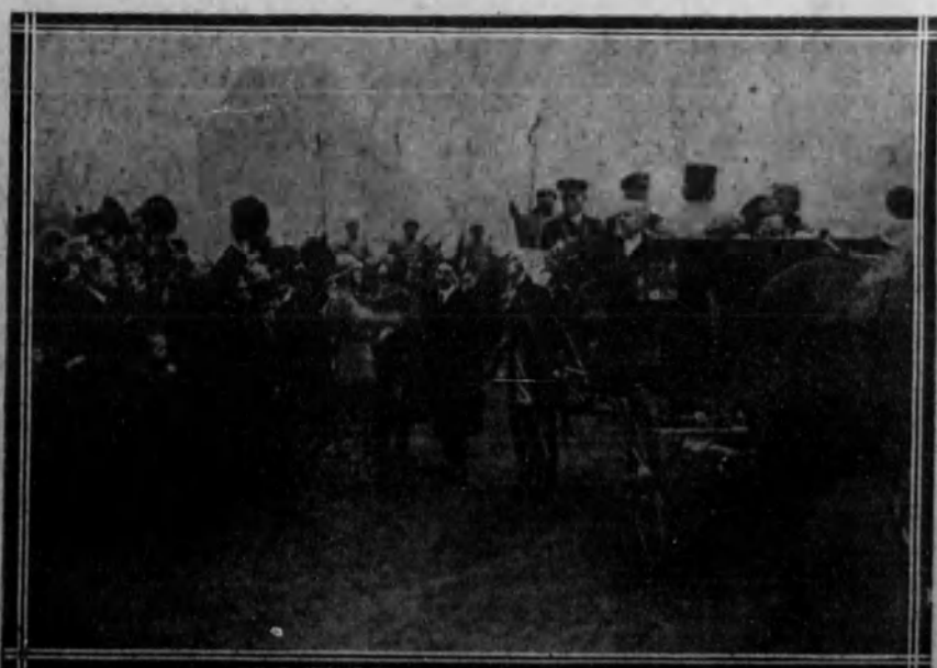
El público aclamando al presidente de la República francesa, M. Poincaré, a su entrada en la ciudad de Metz.