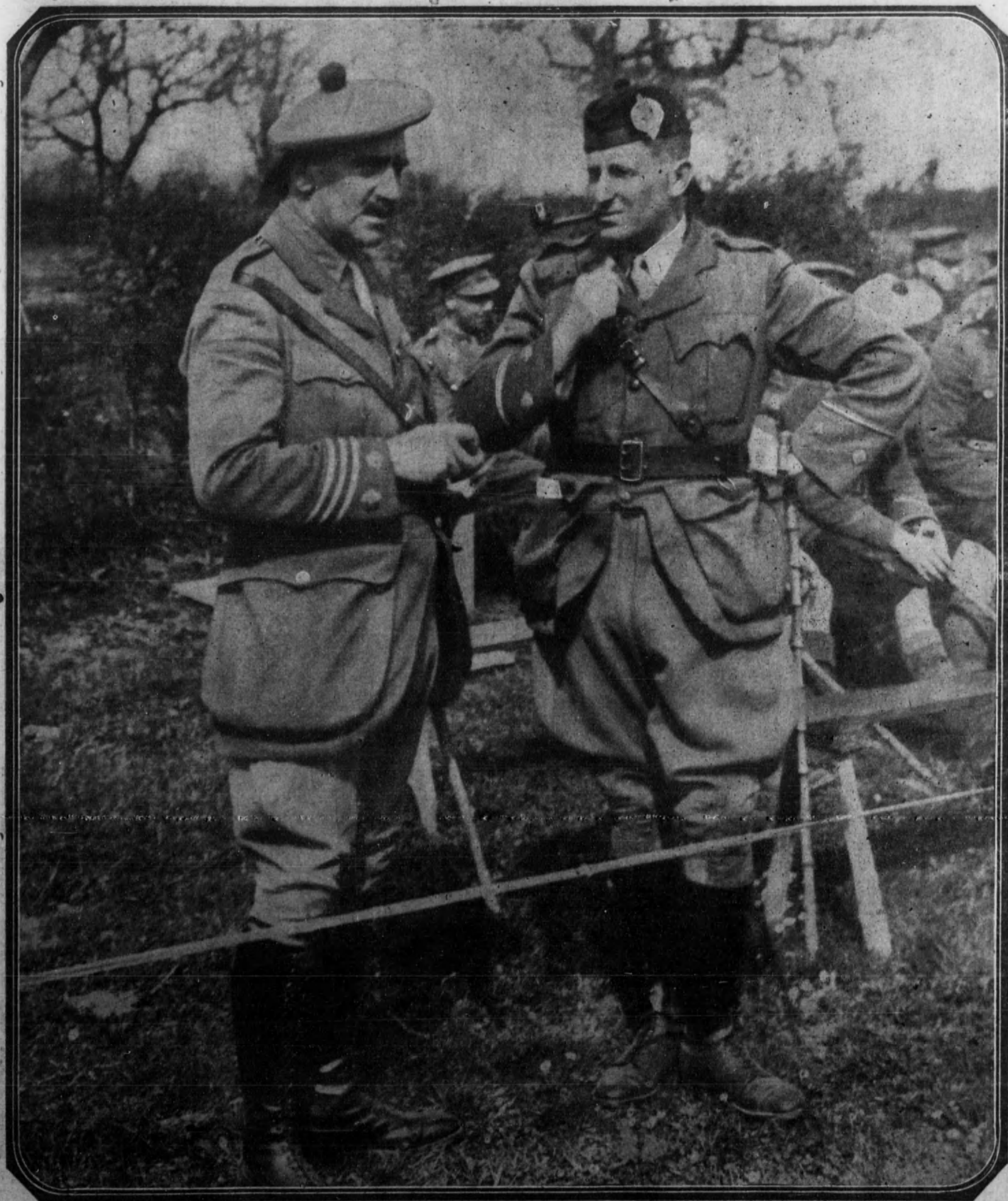
ESCENAS DE LA GUERRA.—Dos oficiales de la «Guardia negra» departiendo en un campamento del sector inglés, de ocupación en la zona neutral alemana.