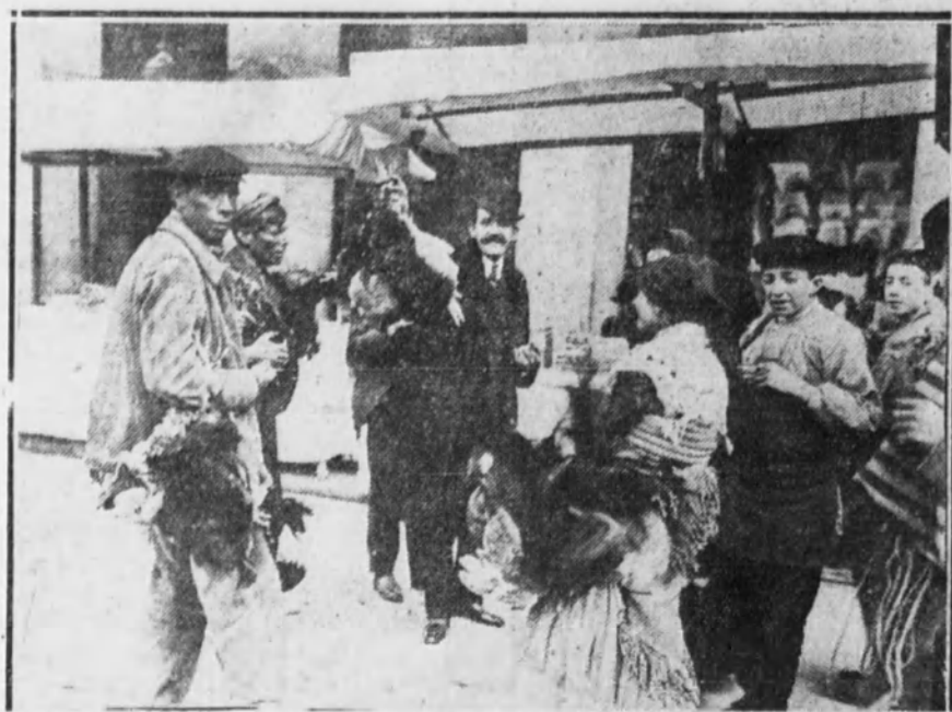
El público en los puestos de la Plaza de Santa Cruz aprovisionándose de succulentas «piezas» para la próxima celebración de la Nochebuena.