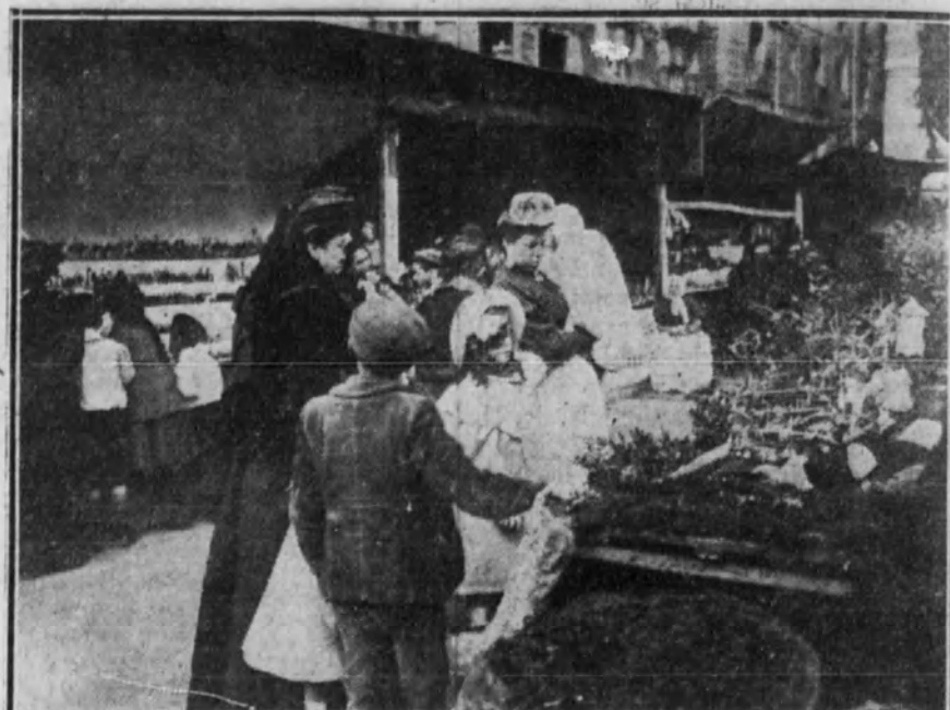
Público visitando los clásicos tenderetes de muñecos y «nacimientos», encanto de los chicos y terror de los grandes.