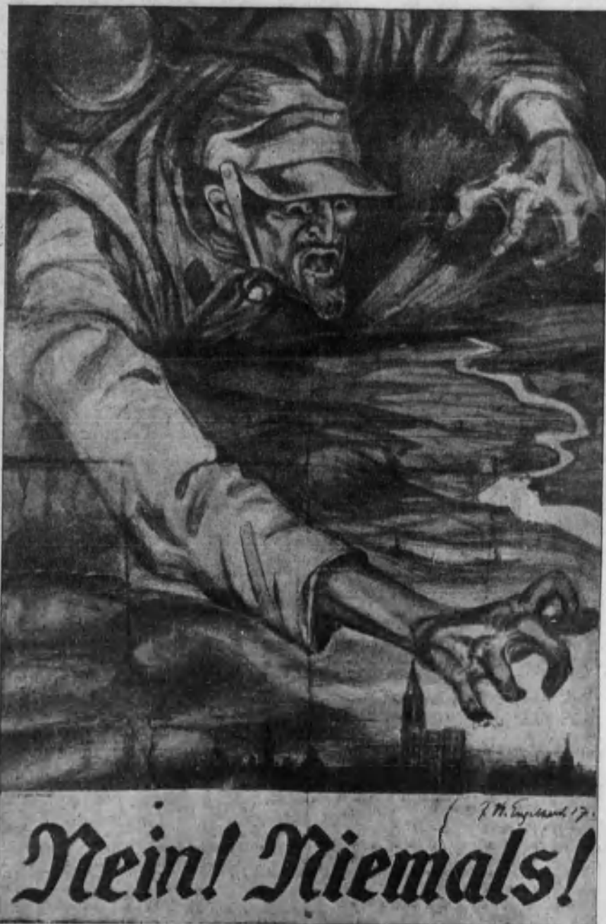
Cartel alemán con la leyenda de «¡No, jamás!»

Olvidan que cuando Alsacia-Lorena fué invitada, por primera vez después