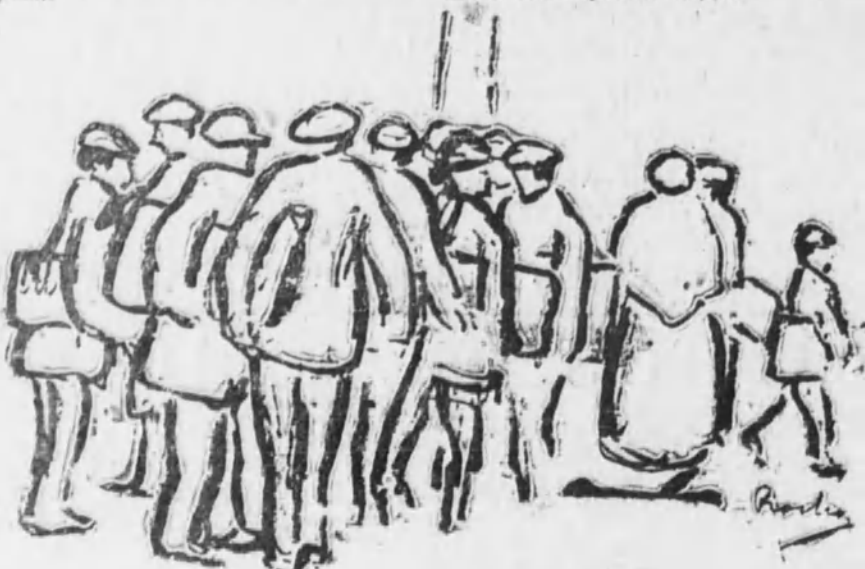
Esperando entrar a presenciar el sorteo.

Son las seis de la mañana; viene clareando el día, y no llegará a las personas que forman la clásica «cola». Una mujer que vende churros y aguardiente se muestra desconsoladísima porque no se vende. Y eso que, como dice ella, vende su mercancía a precio de tasa; pero ¡que si quiere el fagente no está para gastos! En fin, con decirles a ustedes que el número está dispuesto a ceder su puesto por un par de churros en buenas condiciones... Decididamente en estos tiempos de autonomía y separatismo todo ha venido a menos, y podemos asegurar que este año la «cola» no ha pegado.