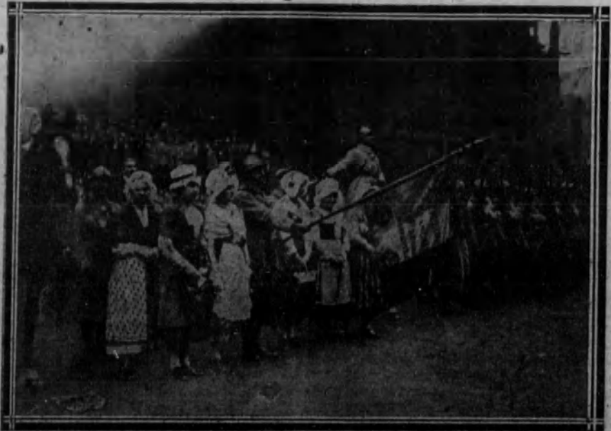
El 319 regimiento de Dragones de Infantería, durante el desfile de las tropas francesas que han ocupado la ciudad de Metz.