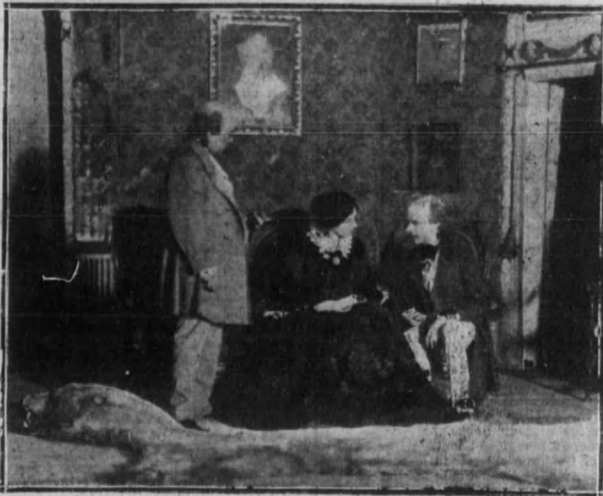
Una escena de "La felicidad de Antonieta"

entonces con el título del original francés, la comedia que nos ocupa se conoció en España con el nombre de El yerno del señor Poirier . Creo que posteriormente se han hecho algunas otras versiones. No sé. Esto mejor que yo lo