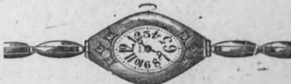
Núm. 11.—Reloj con pulsera extensible. Ancora superior, forma ovalada con seis brillantes. En oro de ley 18 k. Ptas. 275