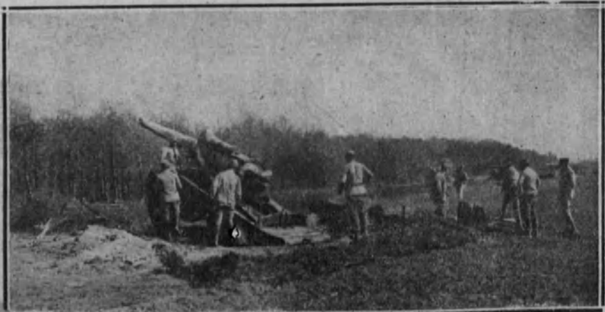
FRANCIA.—Soldados de Artillería francesa preparándose para la operación de desmontar una batería de grueso calibre, instalada en el frente.