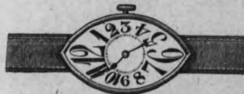
Núm. 9.—Reloj con pulsera de cuero, forma ovalada. Máquina superior. En oro de ley 18 k. Ptas. 150