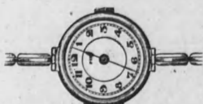
Núm. 2.—Reloj con pulsera extensible. Ancora superior. En oro de ley 18 k. Ptas. 105