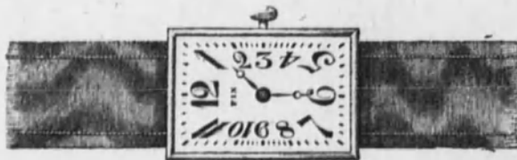
Núm. 7.—Reloj con pulsera, cinta de moiré, forma rectangular. Ancora de precisión. En oro de ley 18 k. Ptas. 165