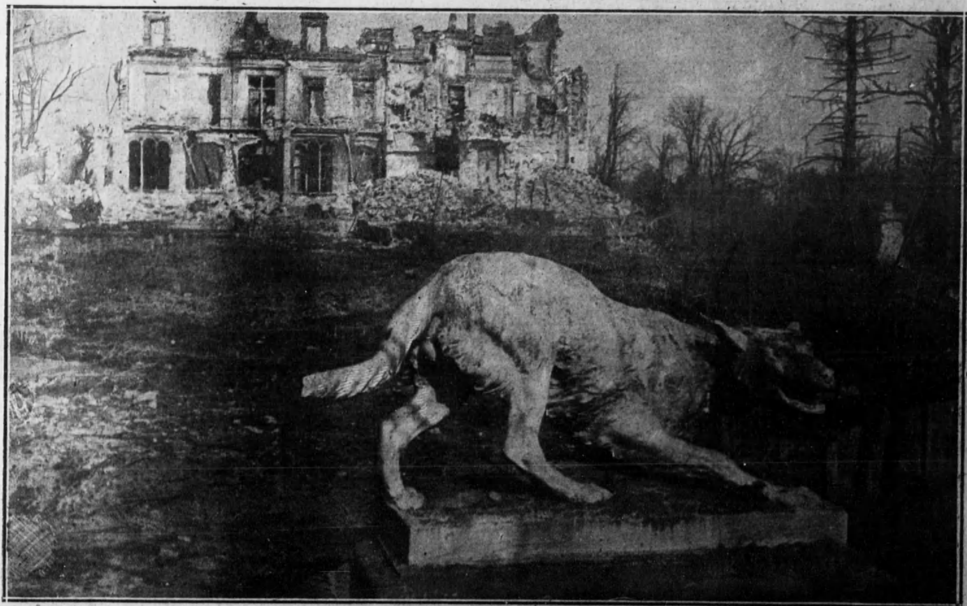
SOUPH (AISNE).—RUINAS DEL CASTILLO

El melancólico aspecto que ofrecen estas ruinas de la bella y artística construcción, que antes erguía la nota blanca de sus elegantes fachadas entre las umbras tonalidades del bosque, conserva aún, como un símbolo del indomable espíritu de independencia de Francia, la imagen escultórica de ese perro, solitario, de gesto fiero y valiente, que parece hallarse defendiendo la derruida morada de sus amos, abandonada por éstos en la trágica hora de la invasión.