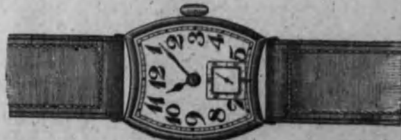
Núm. 15.—Reloj con pulsera de cuero, forma cuadrada, fantasía. Ancora superior. En oro de ley 18 k. Ptas. 245

A CADA RELOJ ACOMPAÑA EL CORRESPONDIENTE BOLETÍN DE GARANTÍA EL MAYOR SURTIDO EN RELOJES DE BOLSILLO Y PULSERA PARA SEÑORA Y CABALLERO, EN ORO, PLATA, NÍQUEL Y ACERO lisos, con artísticos grabados y ornamentados con Brillantes y Diamantes rosas, montados sobre Platino puro.