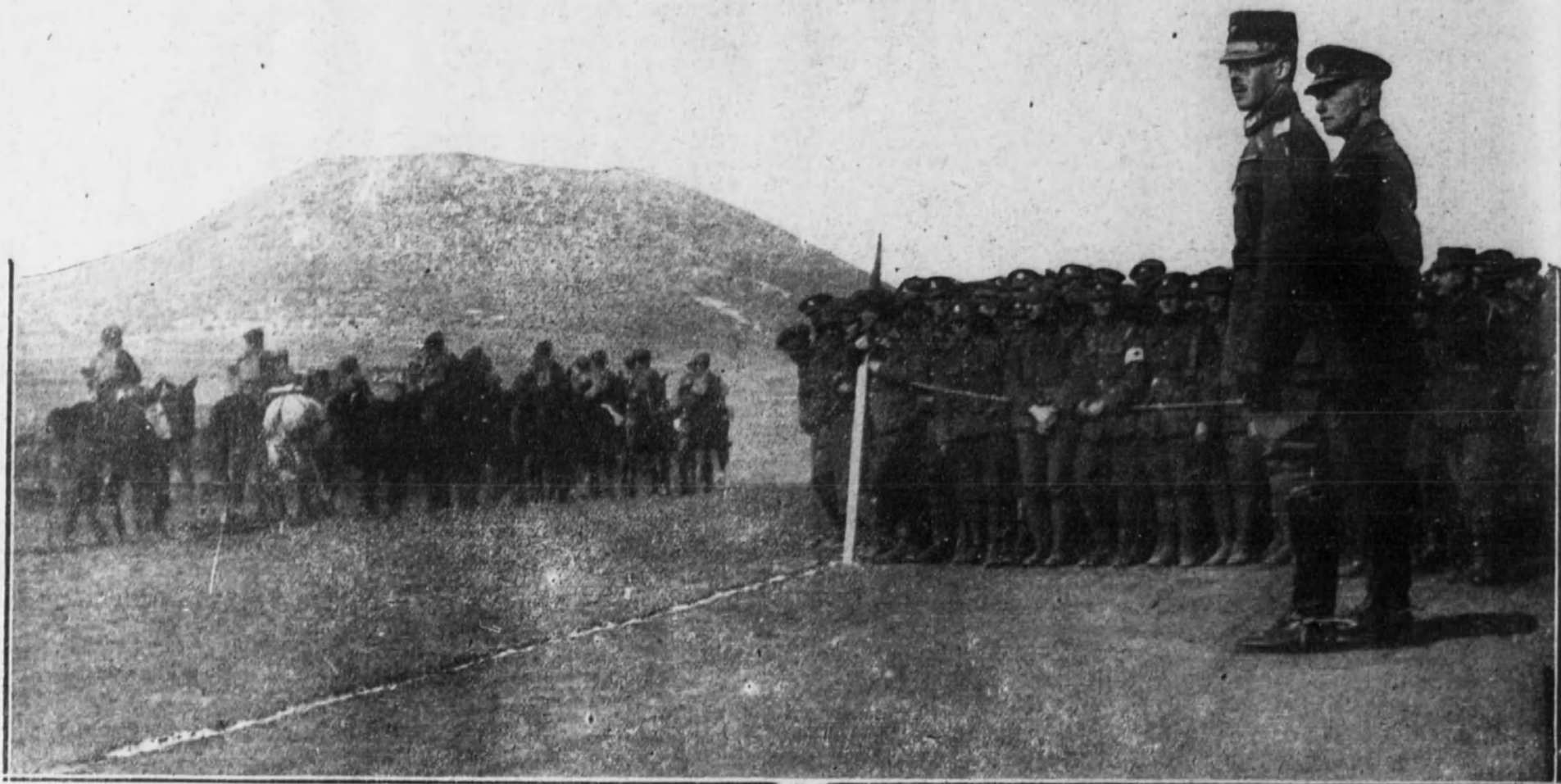
El Rey de Grecia revistando las fuerza inglesas que combatieron en Oriente.