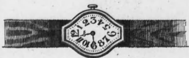
Núm. 1.—Reloj con pulsera, cinta de moiré, forma tonneau, fantasía. Máquina fina. En oro de ley 18 k. Ptas. 100

LAS MEJORES MARCAS MAQUINAS DE PRECISION RIGUROSAMENTE COMPROBADAS :: DE TODOS PRECIOS ::