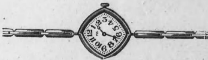
Núm. 5.—Reloj con pulsera extensible, forma cuadrada, fantasía. Máquina fina. En oro de ley 18 k. Ptas. 150