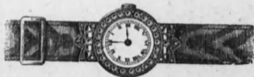
Núm. 13.—Reloj con pulsera, cinta de moiré. Ancora de precisión, cerco de brillantes sobre platino. En oro de ley 18 k. Ptas. 675