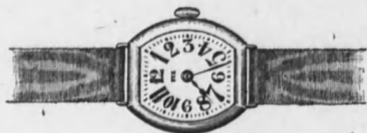
Núm. 4.—Reloj con pulsera, cinta de moiré, forma tonneau. Máquina fina. En oro de ley 18 k. Ptas. 150