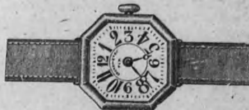
Núm. 6.—Reloj con pulsera de cuero, forma octogonal. Ancora superior. En oro de ley 18 k. Ptas. 125