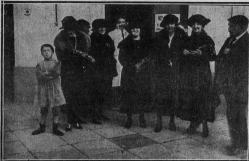
Grupo de distinguidas señoritas que postularon en el día de la Flor en San Sebastián.