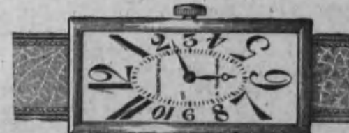
Núm. 12.—Reloj con pulsera de cuero, forma rectangular. Ancora de precisión cronométrica. En plata de ley Ptas. 90 En oro de ley 18 k. Ptas. 190