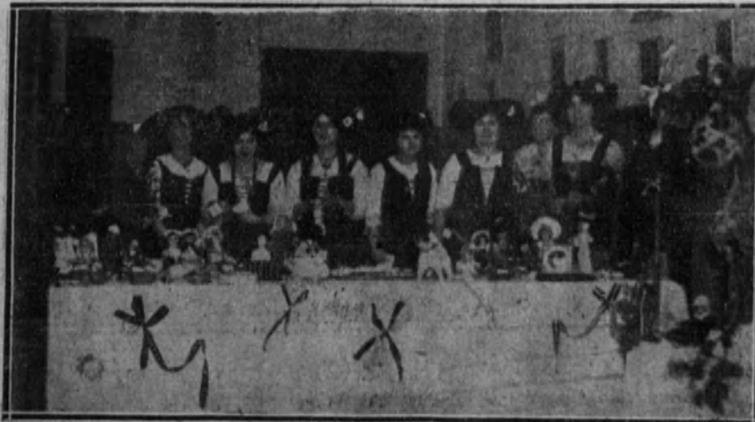
Señoritas francesas vestidas de alsacianas, que vendieron billetes de la tómbola del «Noel» francés, en San Sebastián.