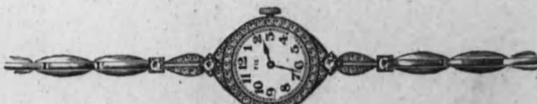
Núm. 14.—Reloj con pulsera extensible. Ancora de precisión, cerco de brillantes. Modelo elegantísimo. Todo él de platino Ptas. 1.900