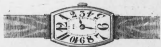
Núm. 10.—Reloj con pulsera, cinta de moiré, forma tonneau. Máquina fina. En plata de ley 70 En oro de ley 18 k. Ptas. 175