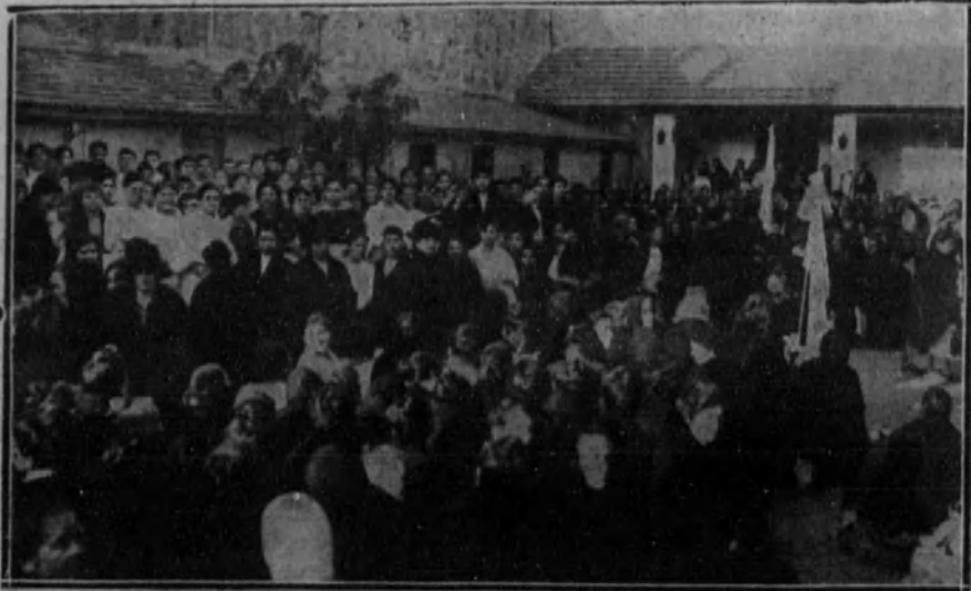
SEVILLA.—Reparto de aguinaldos a las obreras de los distintos centros que en esta capital dirigen las damas catequistas, y a cuya ceremonia asistió el cardenal Almaraz.