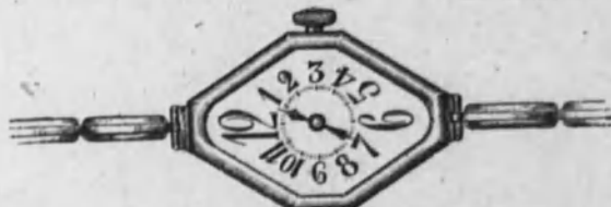
Núm. 8.—Reloj con pulsera extensible, forma tonneau octogonal. Máquina superior. En oro de ley 18 k. Ptas. 180