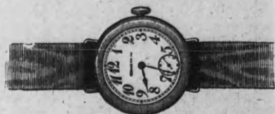
Núm. 3.—Reloj con pulsera, cinta de moiré. Máquina fina. En oro de ley 18 k. Ptas. 65