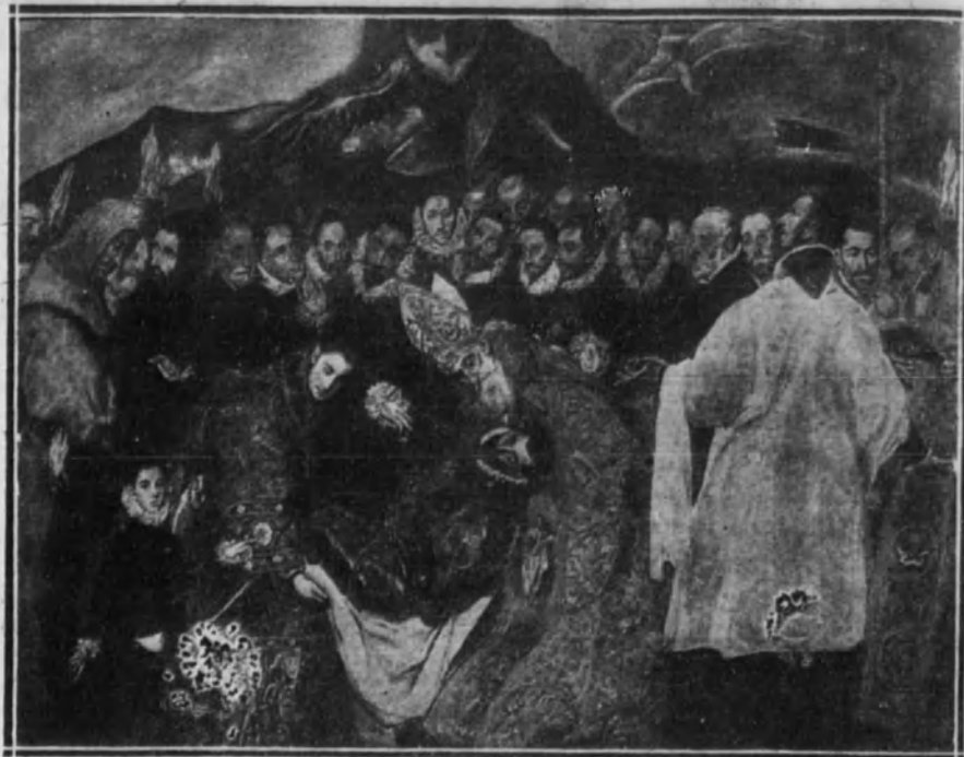
Enfermo del conde de Orgaz.

Italia, antes de la aparición auroral de Dominico Theotocopuli, abrumaba nuestra cerviz con la pesadéz gloriosa de su arte: Tiziano, Tintoretto y Pablo Veronés, esa sublime