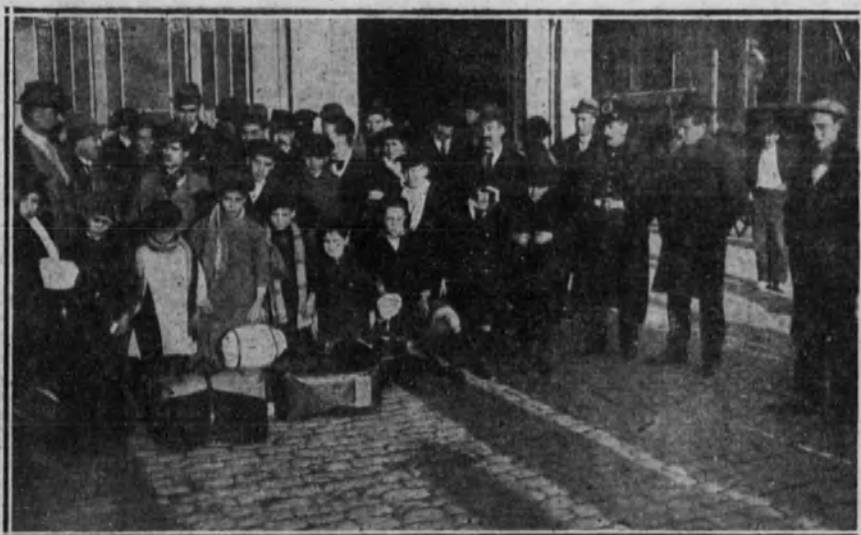
BARCELONA.—La primera colonia escolar de invierno, en el Apeadero del paseo de Gracia, esperando el tren para Sitjes.