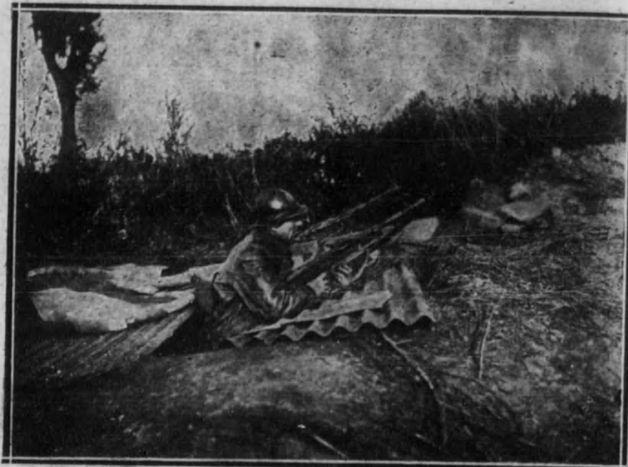
BELGICA.—Soldado belga de centinela en un hoyo de los llamados «abrigos», cerca de la frontera alemana.