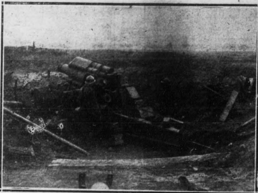
BELGICA.—Cañón de grueso calibre, perteneciente al armamento entregado por los alemanes a los aliados.