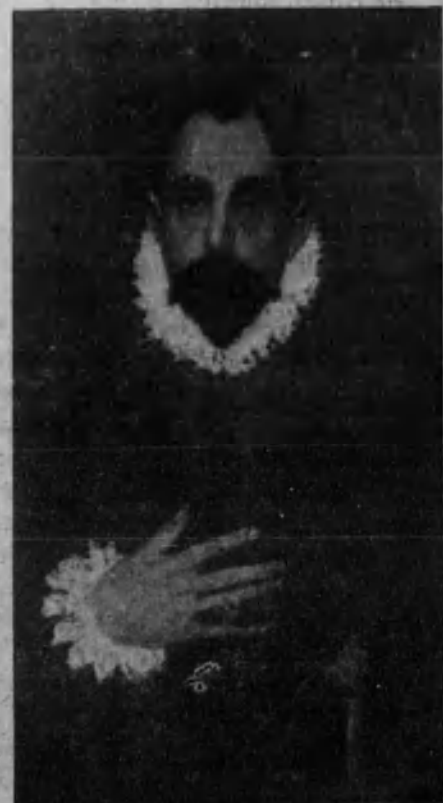
Retrato del caballero de la mano en el pecho.