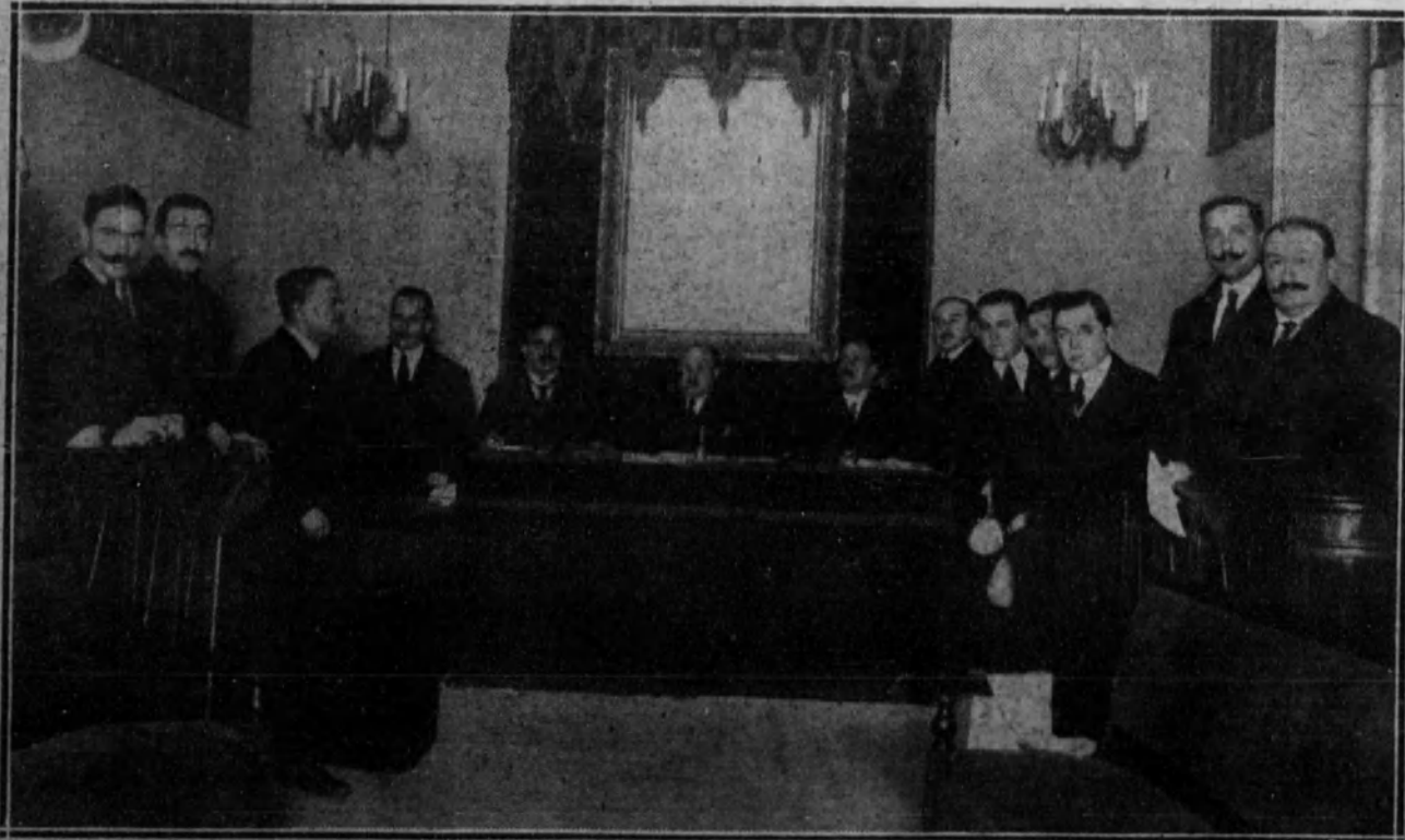
MADRID.—Mesa presidencial y grupo de algunos de los asistentes al segundo Congreso de abogados, celebrado en la Academia de Jurisprudencia de esta corte.