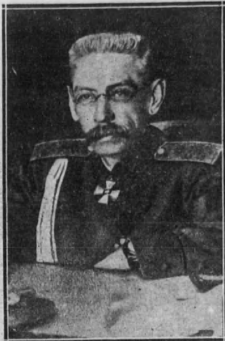
El general Russky.