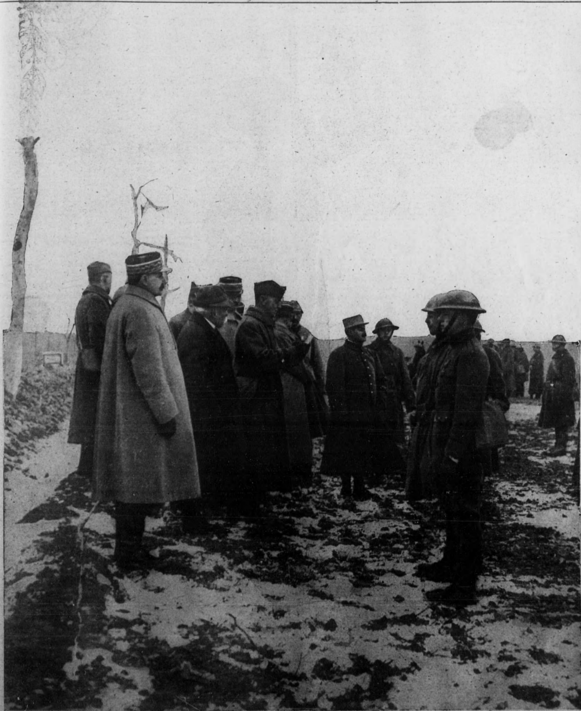
ESCENAS DE LA GUERRA. — El presidente, M. Clemenceau, durante una de sus visitas al sector norteamericano en Francia, presencia una plática del cura castrense a los "tommies" del regimiento.