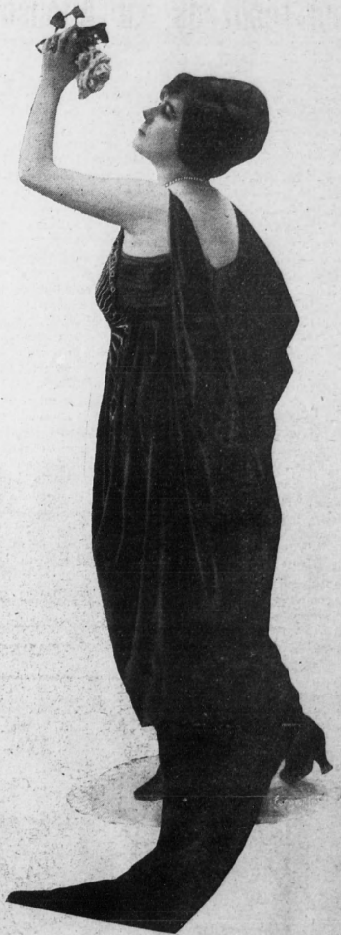
Elegante traje de sociedad