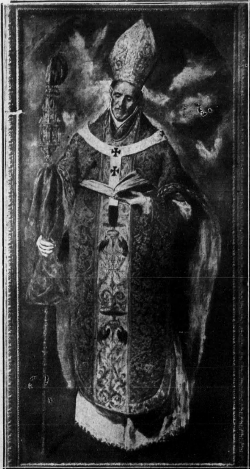
San Eugenio, Arzobispo de Toledo.