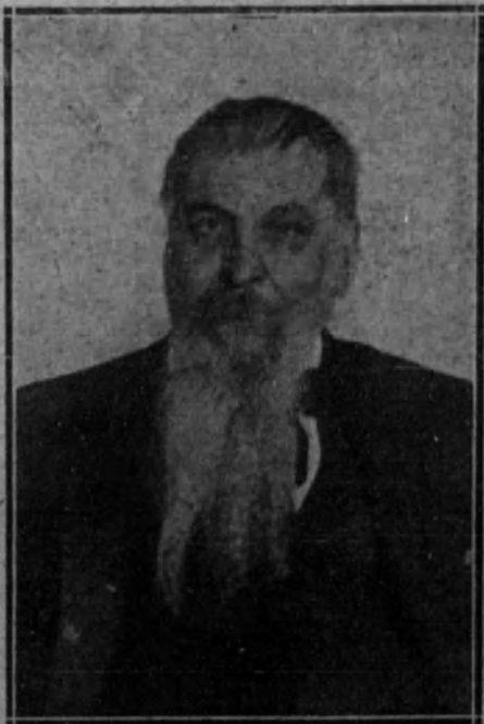
El general Ricciotti Garibaldi.