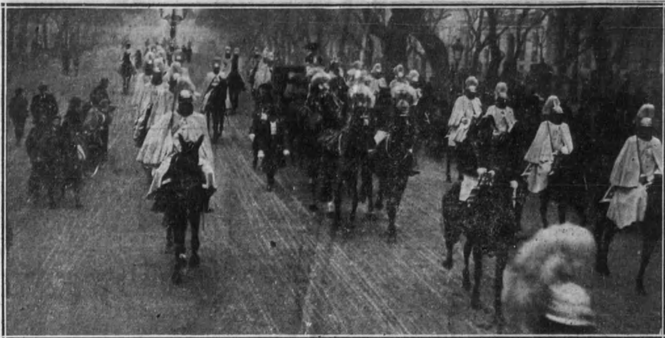
La comitiva dirigiéndose a Palacio.

vuestra persona, a la vez que al alto y meritorio funcionario que en larga carrera administrativa supo adquirir justo renombre, a la poderosa nación que representáis, unida con España, según decís con acierto, por estrechos vínculos de vecindad y de parentesco, animados por el mismo ideal civilizador y progresivo.