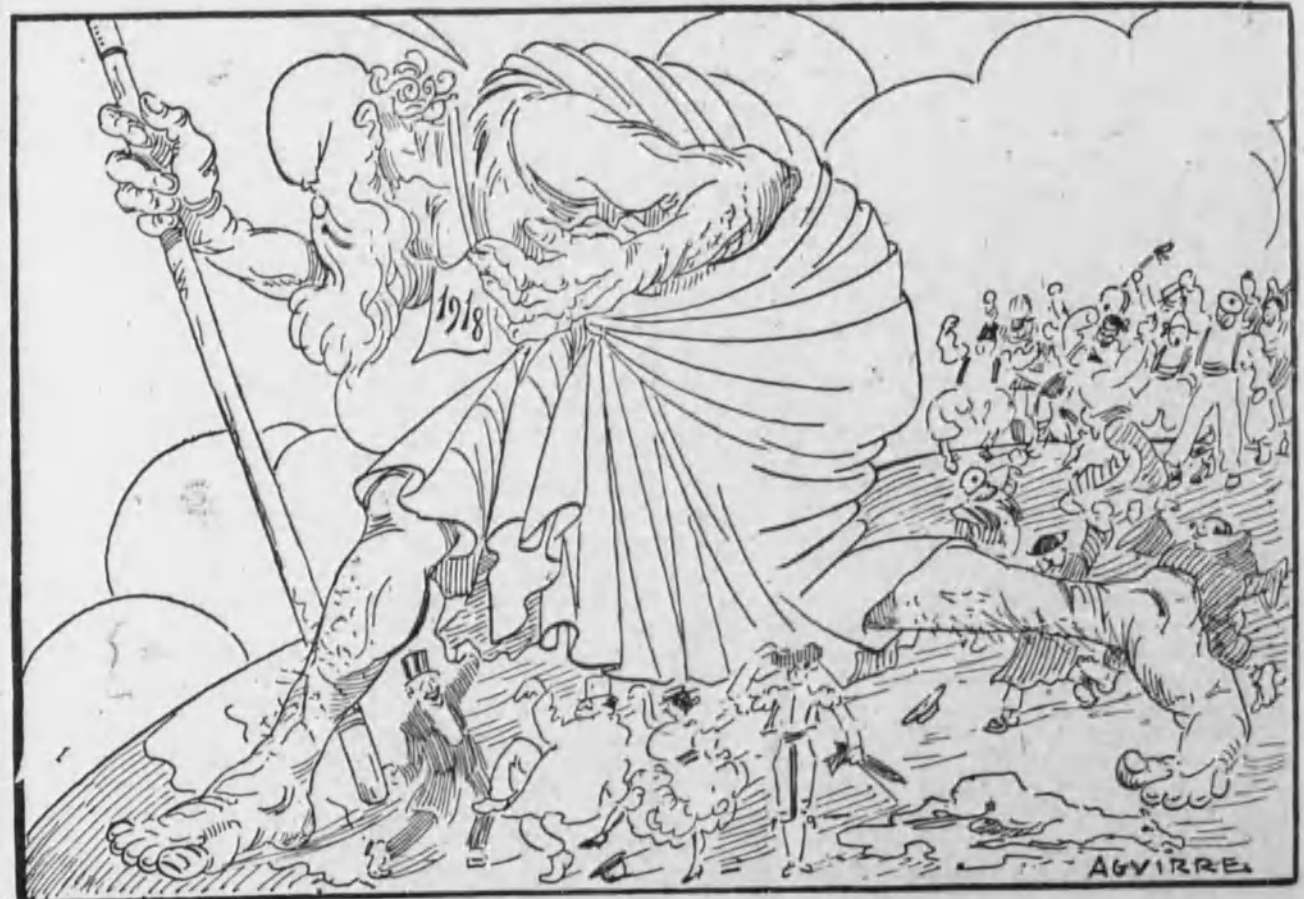
Puede el baile continuar.