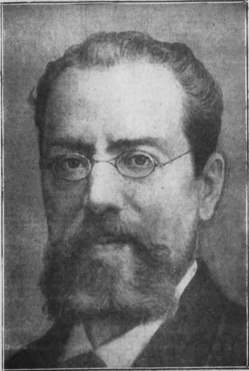
Don Manuel Tamayo y Baus