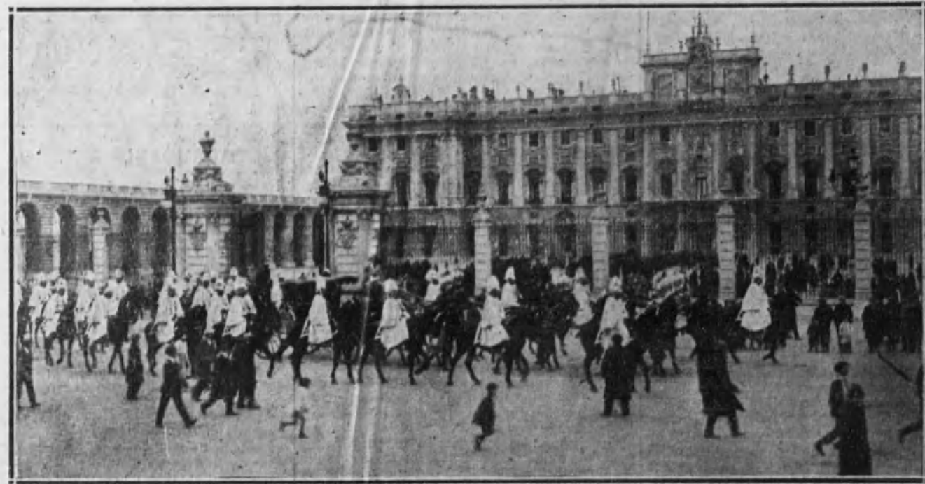
Al entrar en el regio alcázar.