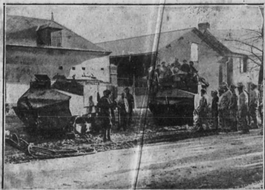
Dos curiosas fotografías tomadas en el frente francés.