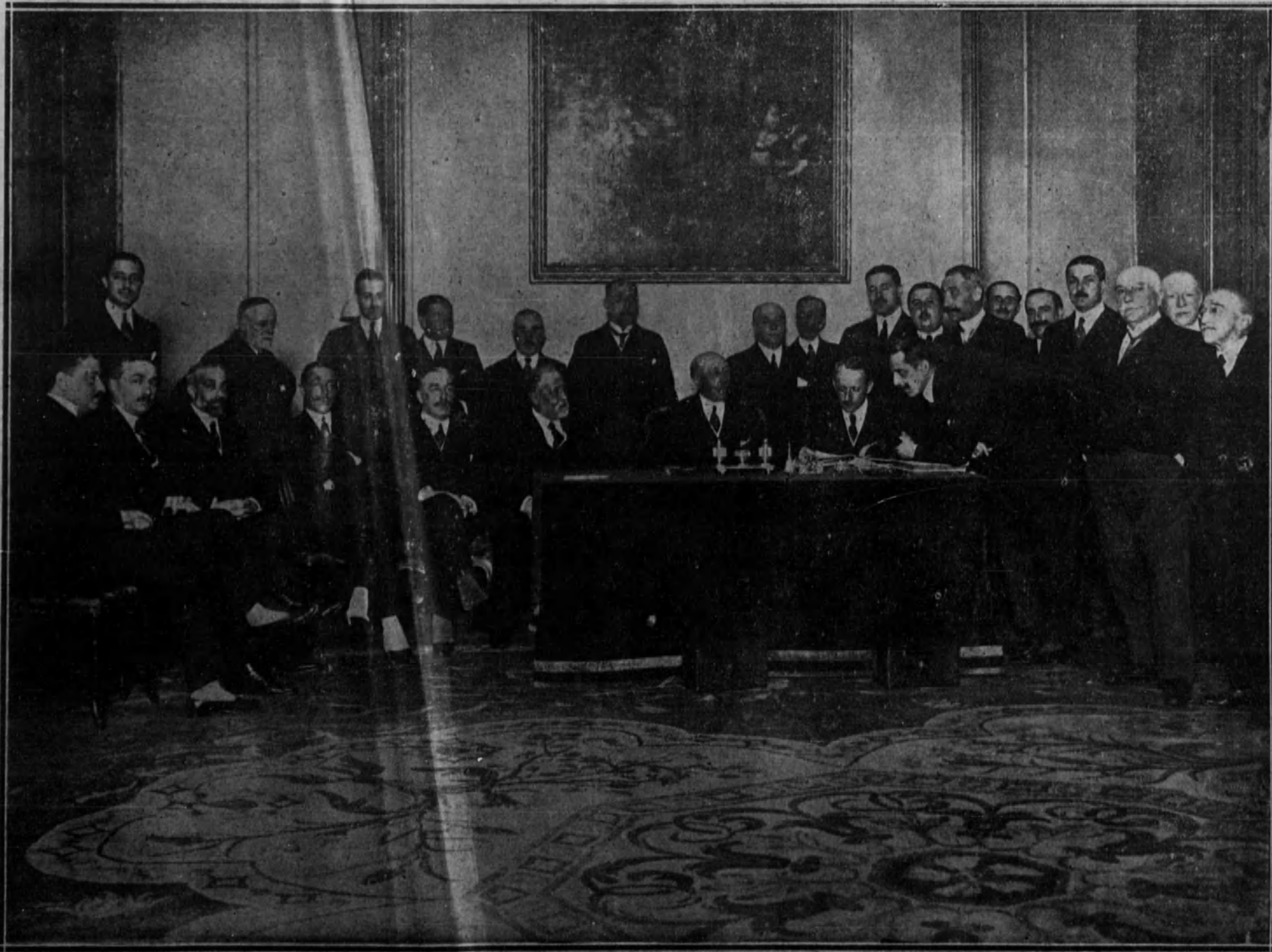
La Junta de la Grandeza de España, reunida hoy en Palacio.