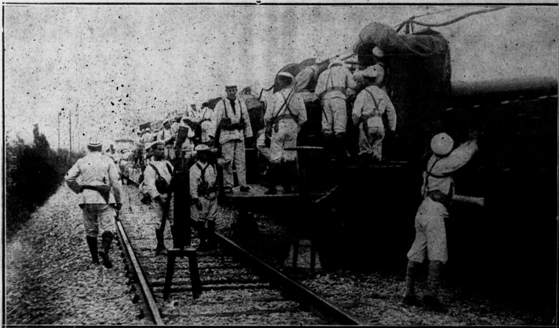
Tren armado, en el momento de hacer disparos.