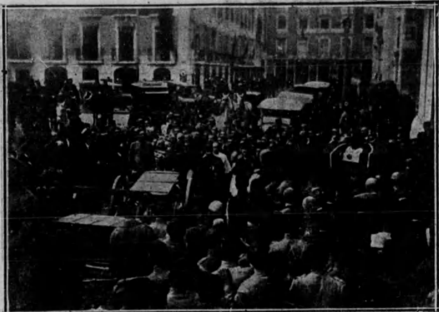
DEL ENTIERRO DEL PRESIDENTE DE LA REPUBLICA PORTUGUESA. —Momento en que los ayudantes de D. Sidonio Paes transportaron el cadáver desde el palacio de la Cámara municipal al armón de artillería.