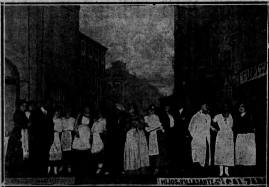
TEATRO MARTIN. —Una escena de la zarzuela «Las pícaras mujeres».