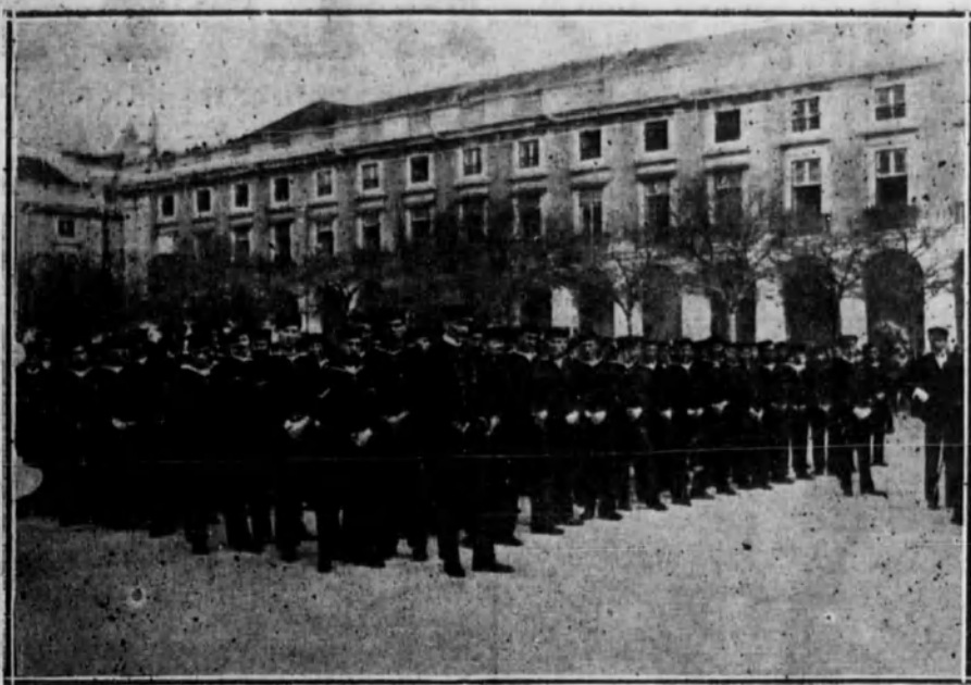
Marinos del acorazado español «Alfonso XIII», en la gran plaza del Comercio, de Lisboa, esperando el momento de incorporarse al cortejo fúnebre de D. Sidonio Paes.

Un amigo de Sidonio Paes se vuel e loco ante el cadáver de ex presidente portugués