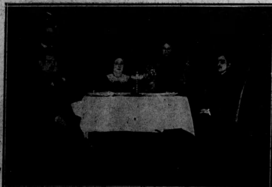
Dos escenas del drama de D. M. Tamayo y Baus «El Ecce-Homo», estrenado en el teatro de la Princesa por la compañía Guerrero-Mendoza.