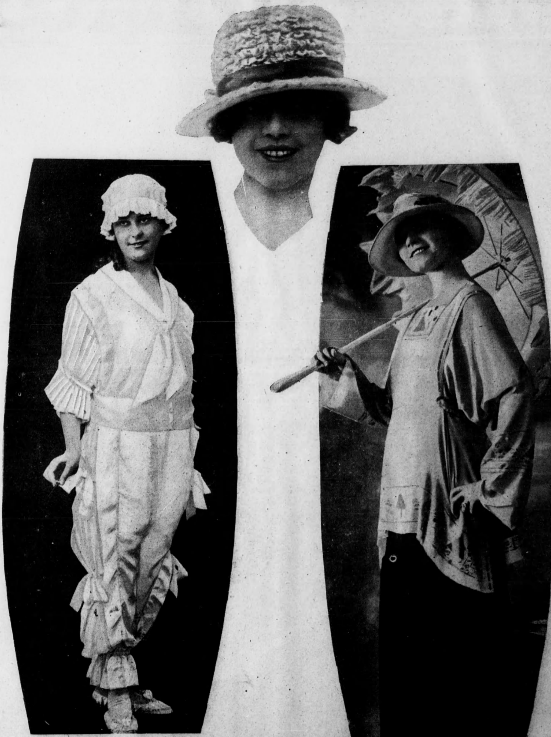
Original «deshabillé» blanco, adornado con cintas de raso del mismo color.