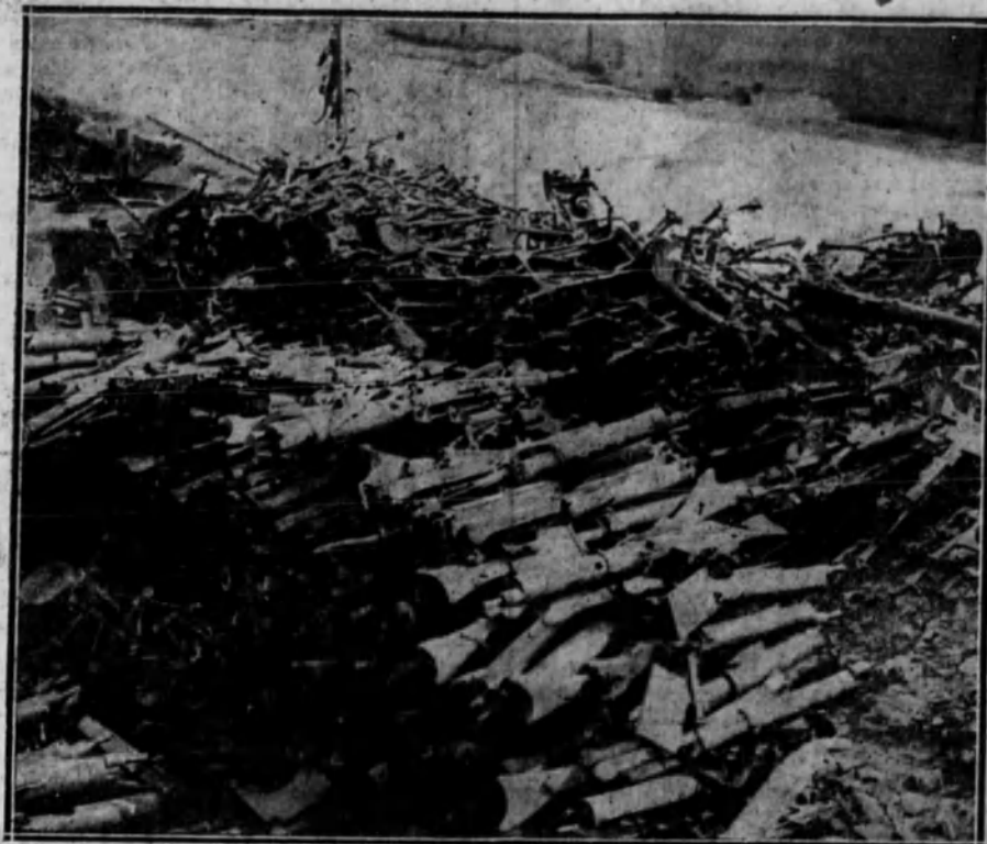
FRANCIA.—Material alemán capturado en la última ofensiva francesa, en el sector del Aisne.