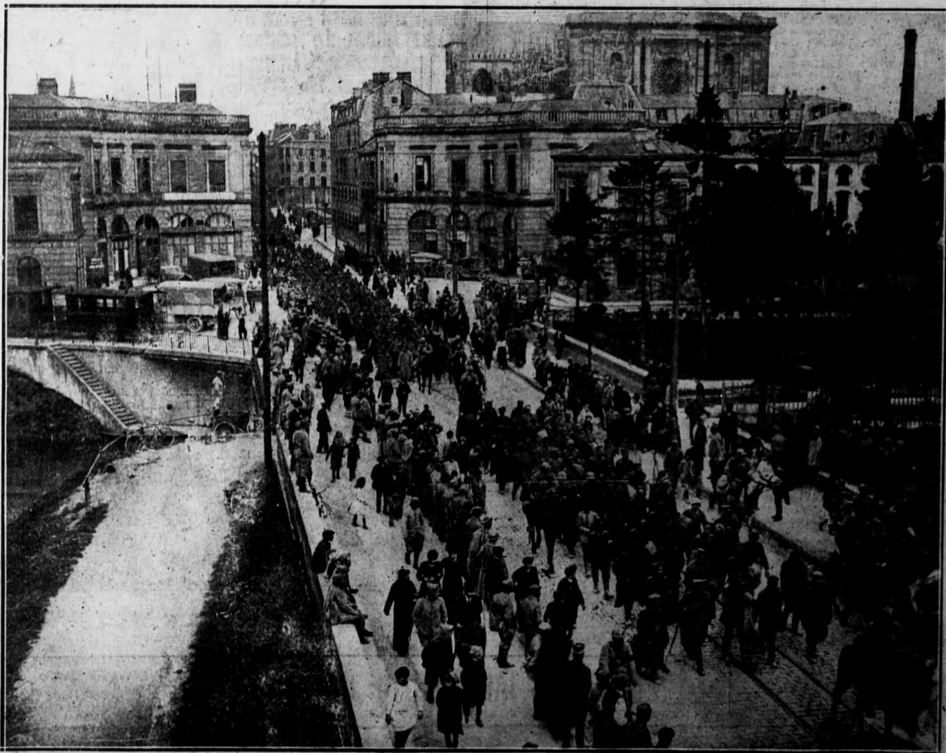
DURANTE EL ARMISTICIO.—Columna de prisioneros alemanes a su paso por una calle de Chalons-Sur-Marne, en dirección a un campamento de concentración del Sur de Francia.