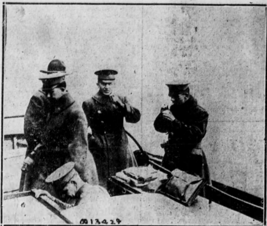
El general de brigada J. B. Wheeler, acompañado de otros oficiales, a bordo de una gasolinera, en el puerto de Ostende.