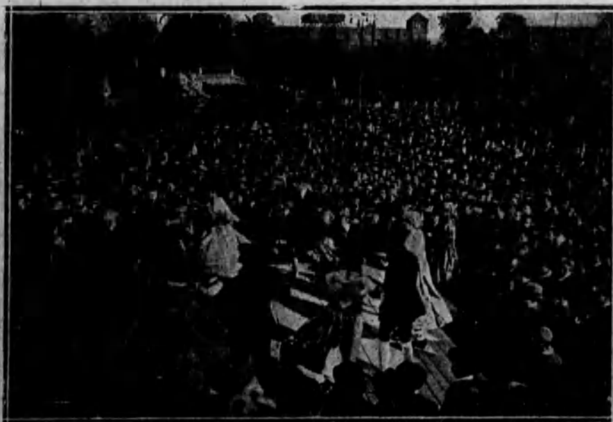
BARCELONA.—Aspecto del gran «aplech» celebrado en el Parque con motivo de la «Díada» de la lengua catalana, en cuya fiesta tomaron parte distintos orfeones y el «Estart Catalá de Dansaires».