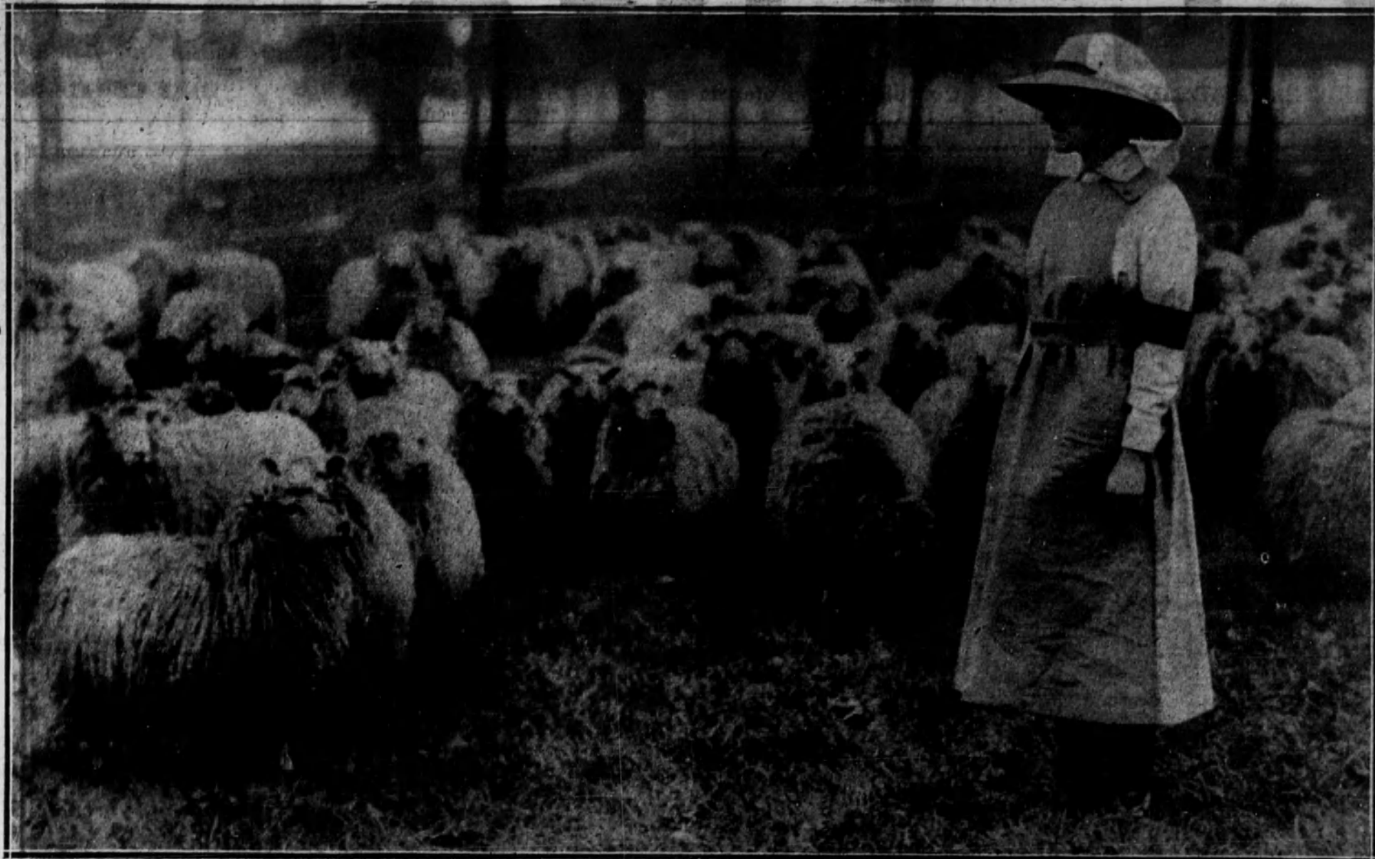
La mujer yanqui, como las mujeres de los otros países beligerantes, especialmente las de Francia, ha sustituido al hombre en las rudas faenas agrícolas.