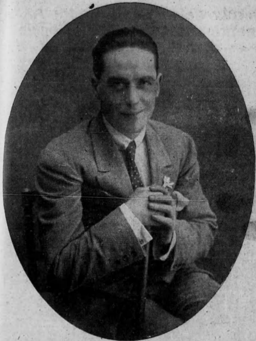
El aplaudido primer actor Ernesto Vilches, que anoche celebró su beneficio, cerrando con ello la brillante temporada que ha realizado en Madrid.