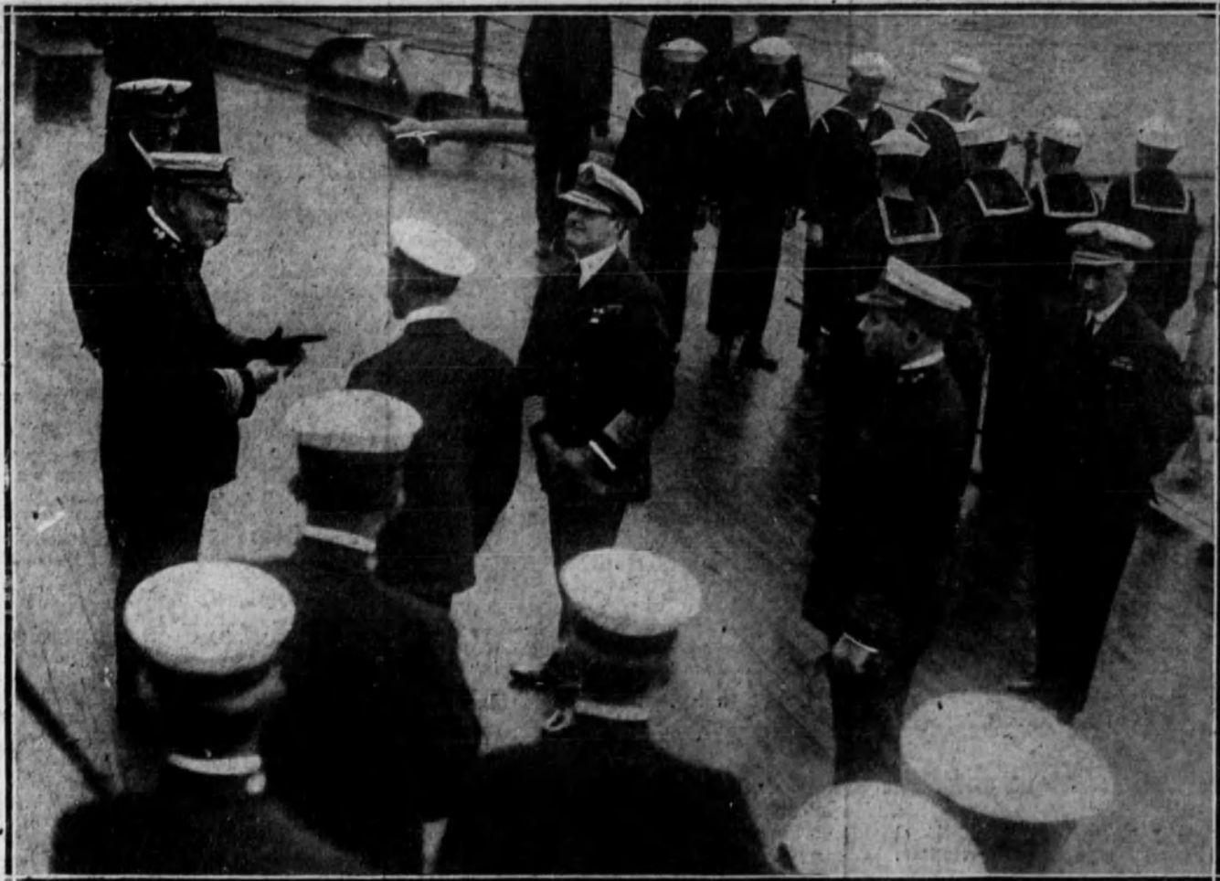
INGLATERRA.—El Rey de Inglaterra con el almirante Sir David Beatty y el almirante Rodman's Flagship, durante una de las revistas navales celebradas últimamente.