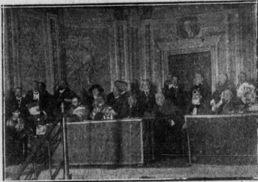
Apertura de curso de la Universidad Central celebrada en el Conservatorio.

Agrupó tales causas en patológicas, tóxicas, geográficas y sociológicas, estudiando las magistralmente todas ellas, desde las enfermedades agudas y crónicas que con la herencia incluye en el primer grupo, hasta las costumbres públicas y privadas, con sus vicios y sus remedios urgentes, que examina con gran competencia, mereciendo los calurosos aplausos y las efusivas felicitaciones con que la concurrencia sancionó su meritísima labor científica y oratoria.