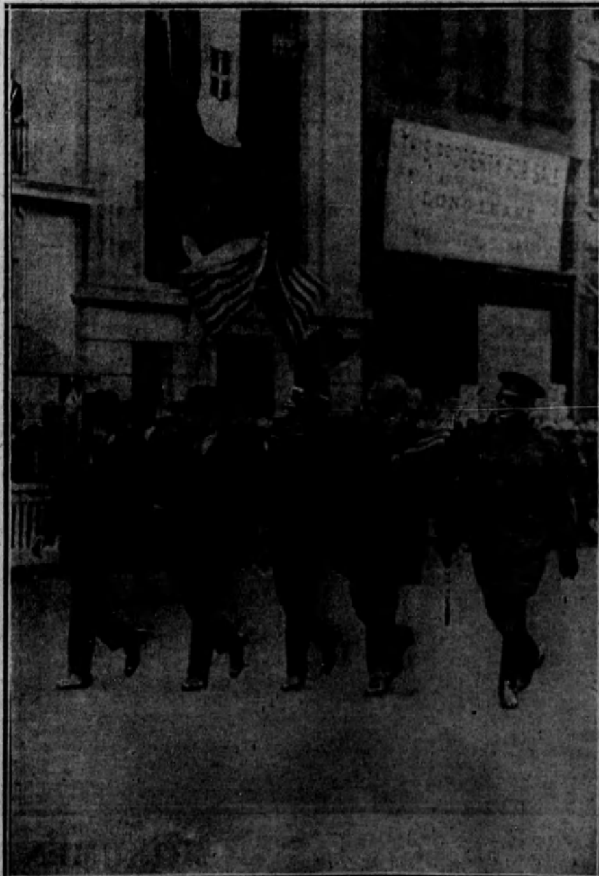
El presidente Wilson en un acto político celebrado en Nueva York poco antes de embarcar para Europa.