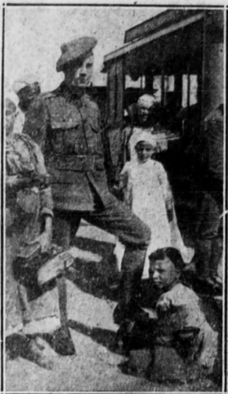
ESCENAS DE ORIENTE.—Soldado inglés utilizando los servicios de un pequeño limpiabotas, en El Cairo.