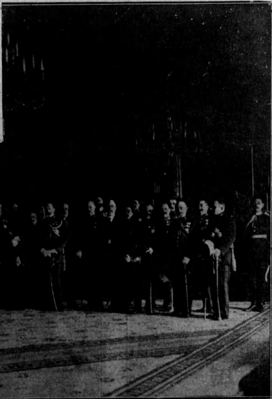
BARCELONA.—Aspecto del gran salón de la Capitanía General, durante la recepción celebrada el día de Reyes.

A la espiritual Irene L. Heredia, al gran Vilches y al resto de la compañía, enviamos un saludo cordial.