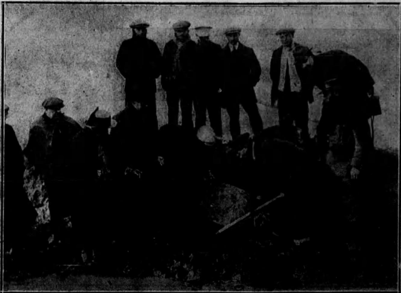
Momento de ser descubierto el cuerpo de la víctima.

Los guardias ya habían realizado un detenido reconocimiento por los alrededores, encontrando un dedo y unos trozos de piel humana.