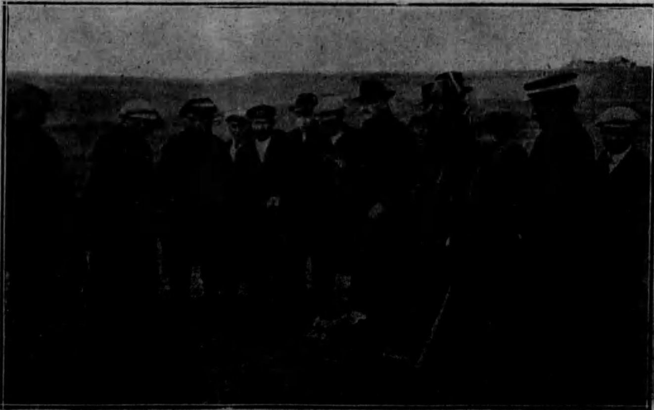
El Juzgado viendo el contenido del saco donde apareció el cuerpo de la víctima.

Si el hombre que vió el pastor es el mismo que vió la muchacha, y hace precisamente ocho o diez días, es fácil presumir que éste sea uno de los autores o el autor del crimen.