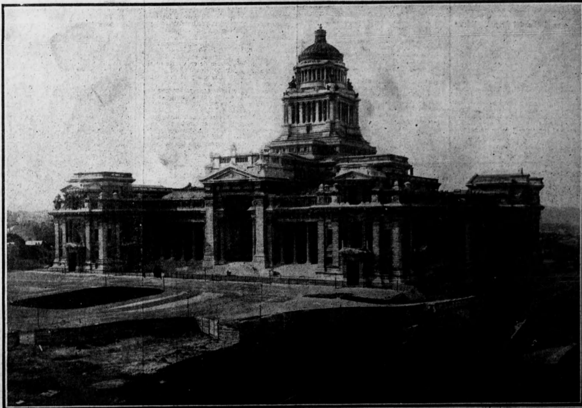
Ayuntamiento de Madrid Fotografía del grandioso y monumental edificio del Palacio de la Justicia, de Bruselas. Vista obtenida hace algunos años, cuando no era aún sospechada la catástrofe guerrera que tanto dolor y ruina han producido en el mundo.