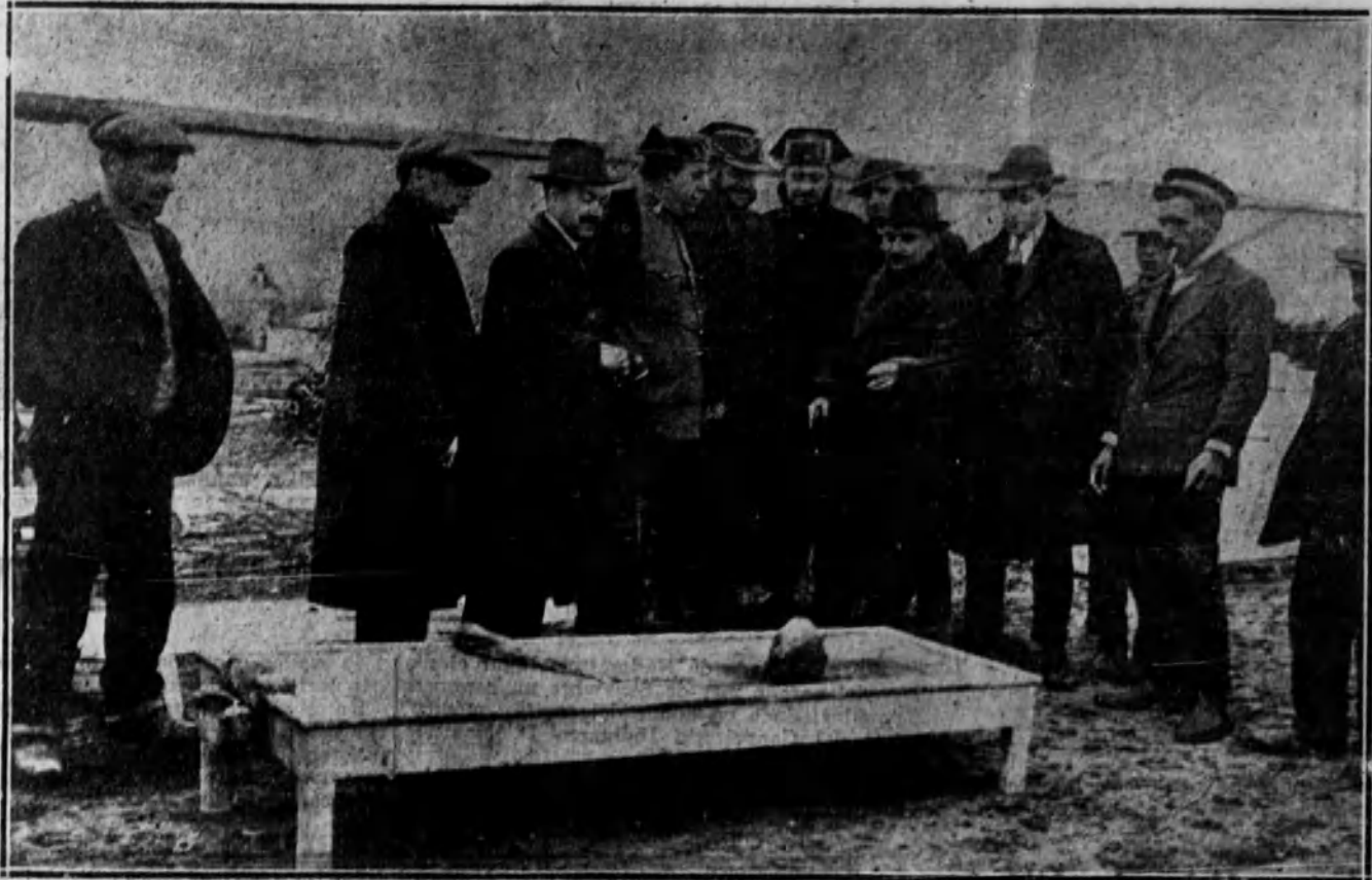
El juez de Vallecas y los jefes de la Guardia civil viendo los primeros restos encontrados.

Los detenidos en el Juzgado de Vallecas fueron hábilmente interrogados por el tenien-