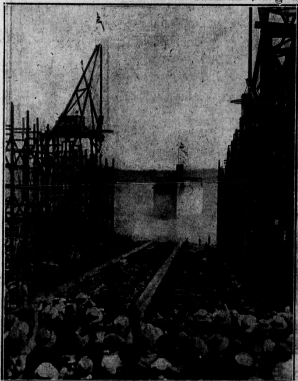
El último barco botado al agua en los Estados Unidos, días antes de ser firmado el armisticio.