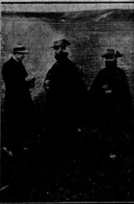
Nuestro redactor Sr. Avello interrogando a la pareja de la Guardia civil que descubrió el crimen.

El teniente de la Guardia civil, en cuanto tuvo el éxito de haber encontrado el cuerpo de la víctima por sus investigaciones y excavaciones hechas, dió cuenta del resultado de