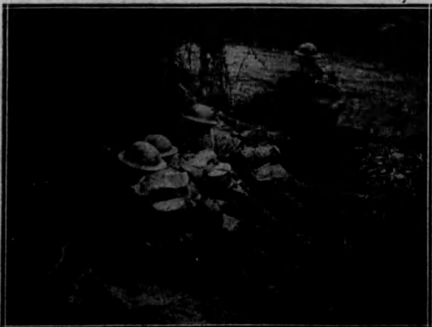
Soldados ingleses de servicio de centinela en la nueva línea marcada en las condiciones del armisticio.