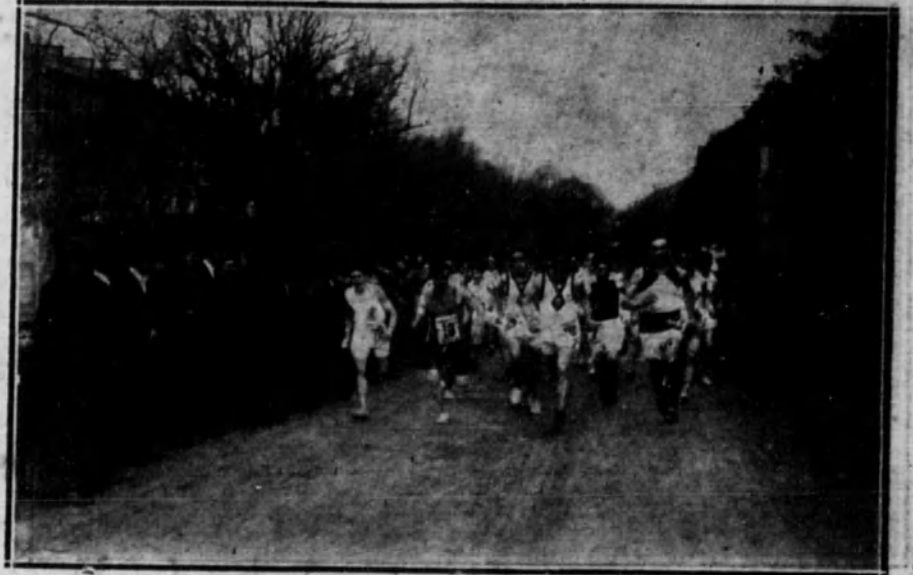
SAN SEBASTIAN.—Momento de salir los corredores que se disputaron el campeonato de «cross-country».