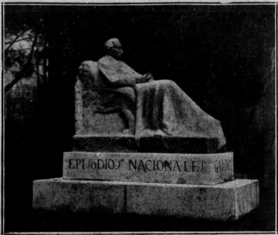
Monumento de D. Benito Pérez Galdós. (Obra de Victorio Macho.)

Victorio Macho, el insigne autor del monumento a Galdós, es hijo de la fuerte y sobria Castilla. Sirva esta observación de prólogo a las líneas que siguen, pues sabiendo el que las lee que Victorio Macho es castellano, comprenderá claramente el porqué y el cómo de su arte.