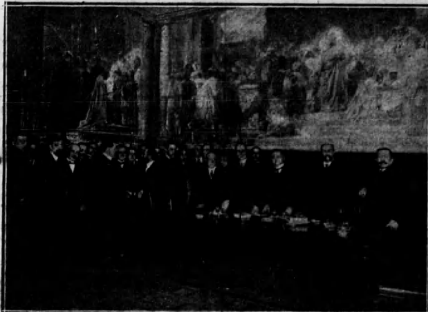
BARCELONA.—Acto inaugural del gran salón del Colegio Notarial de la capital de Cataluña.