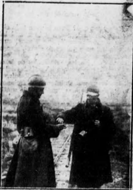
BELGICA.—Dos soldados belgas, camaradas de un mismo regimiento, compartiendo, durante un descanso en el servicio, la ración de tabaco.