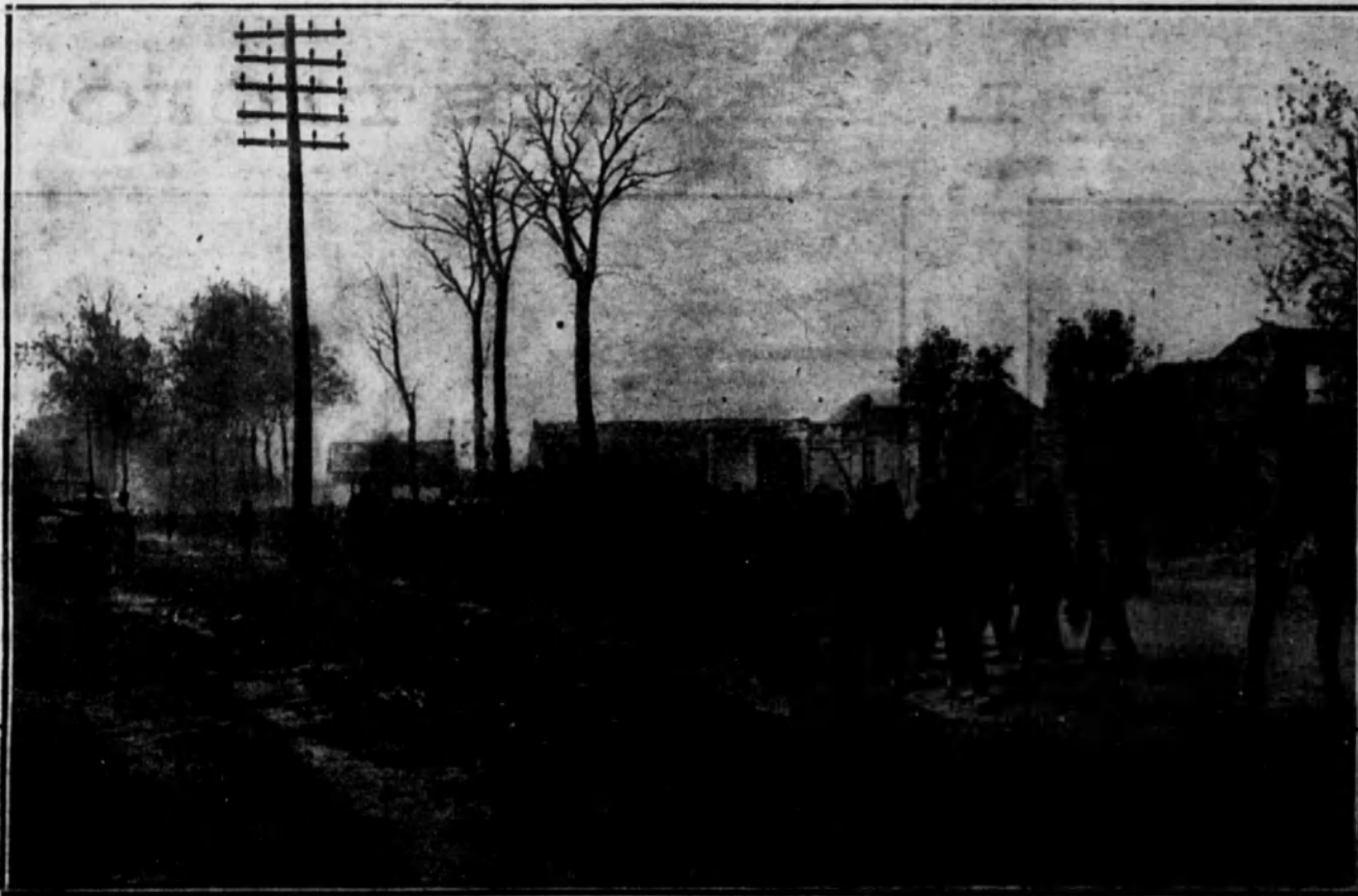
FRANCIA.—Columna de prisioneros alemanes conducida por soldados ingleses hacia un campamento de concentración del sector.

En la tierra magnífica y luminosa en donde florecen el arte y el ingenio con lozanía y vigor incomparables, en la sin par y legendaria Sevilla, el egregio poeta Muñoz San Román ha sido glorificado por la Ilustre Academia, cuya historia es síntesis de las más puras grandezas literarias de la nación española.