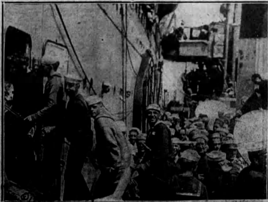
EN FRANCIA.—Marinería yanqui perteneciente a las fuerzas desmovilizadas embarcando en el puerto de Brest a bordo de un acorazado de su nacionalidad, para regresar a Norteamérica.