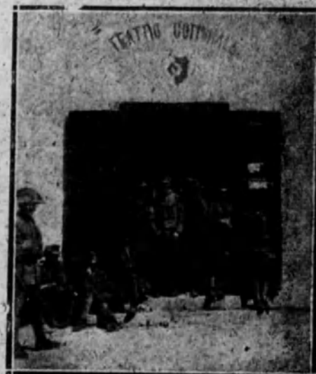
ITALIA.—Prisioneros austriacos alojados provisionalmente en un teatro comunal de un pueblecito del frente de Italia.