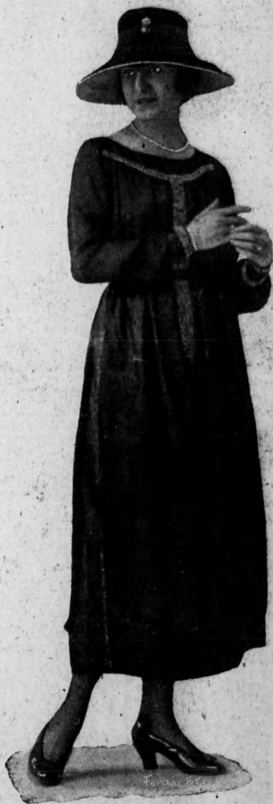
Elegante traje de tarde.