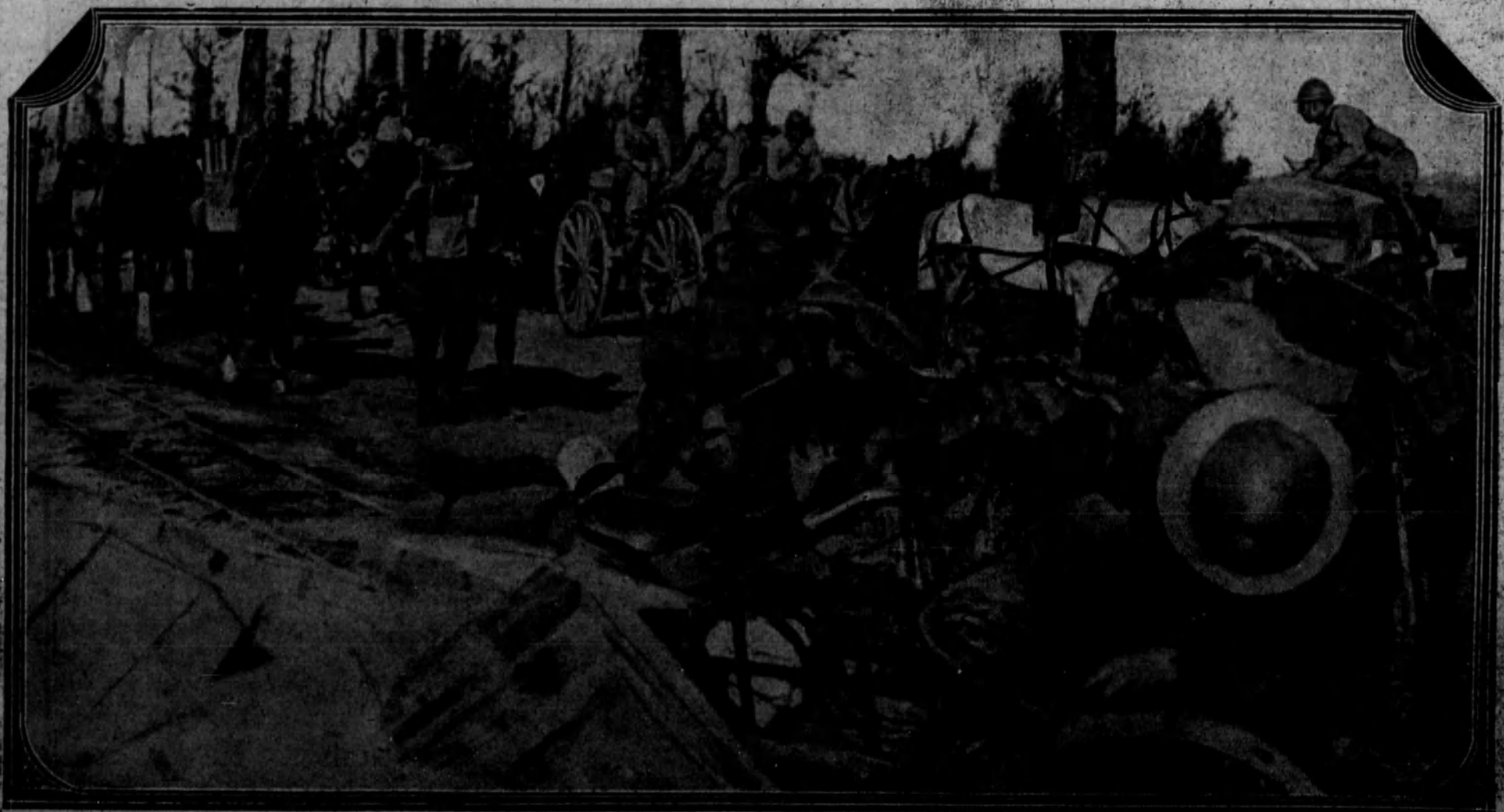
EN FRANCIA.—Tropas inglesas y francesas organizando los convoyes en los campamentos, en espera de la desmovilización.