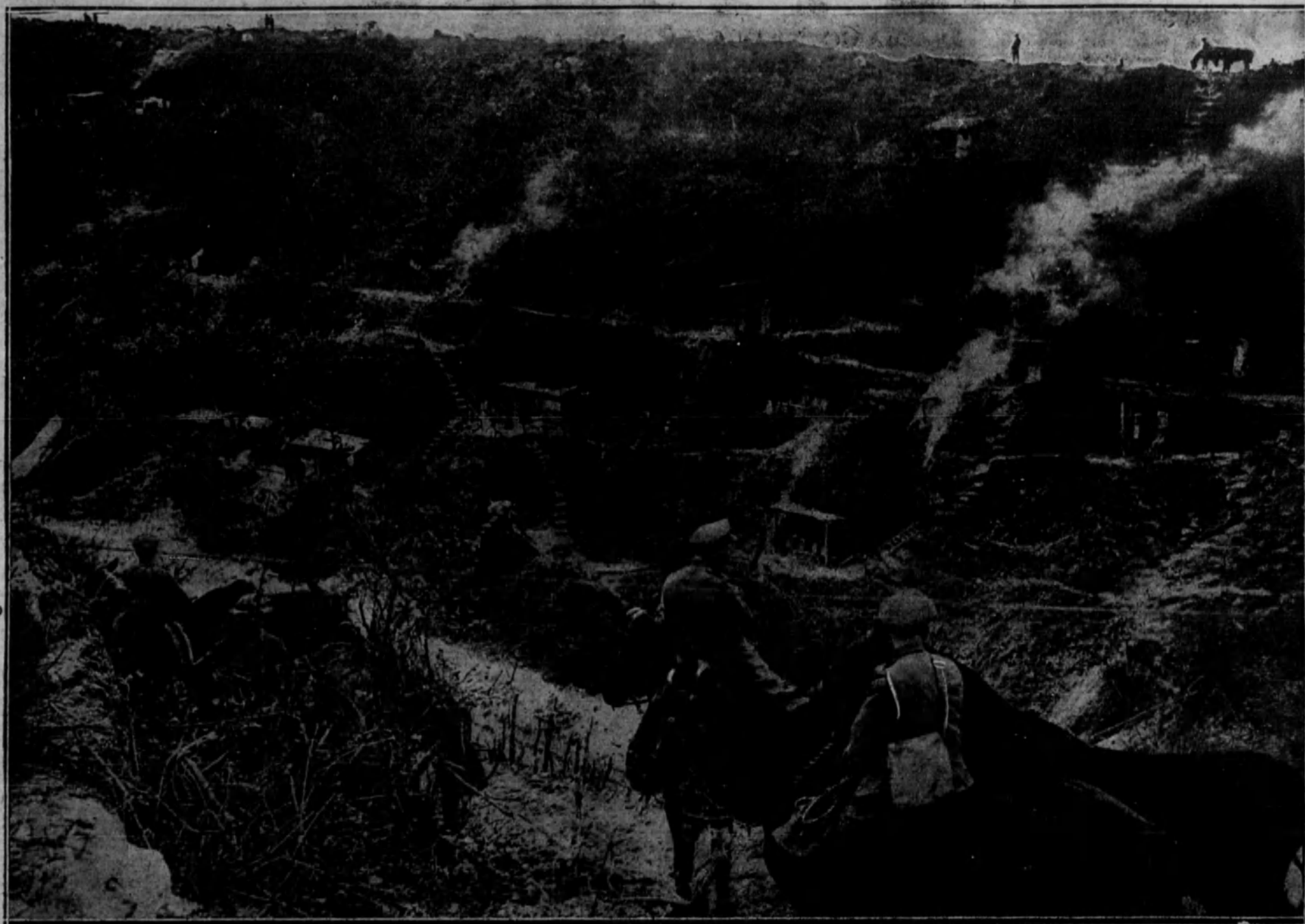
EN FRANCIA.—Fuerzas inglesas descansando en sus acantonamientos en espera de la desmovilización.