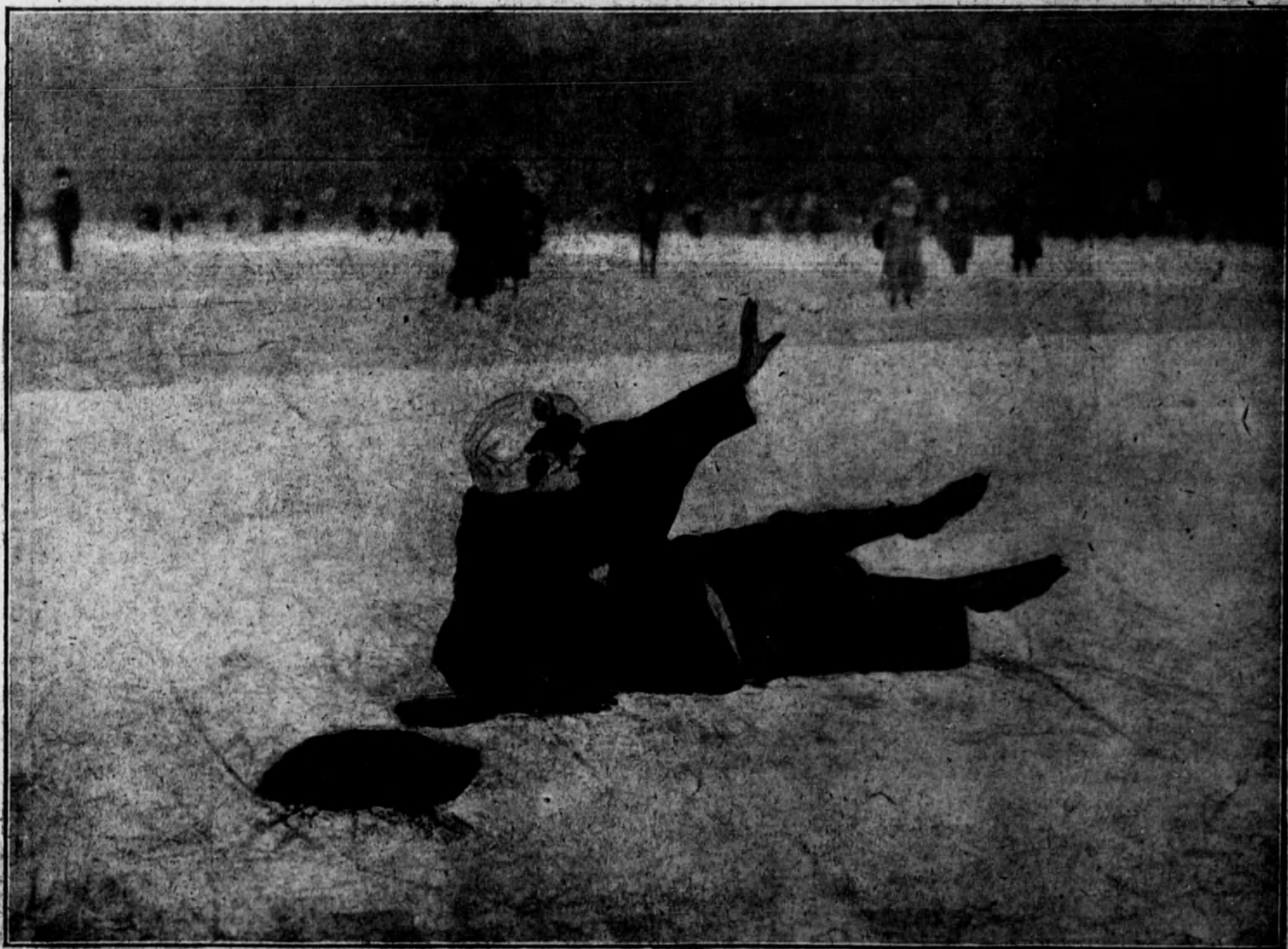
FRANCIA.—En el bosque de Boulogne. Una elegante patinadora, al realizar un ejercicio difícil, sufre un pequeño accidente sin importancia, aunque de cierta visualidad.