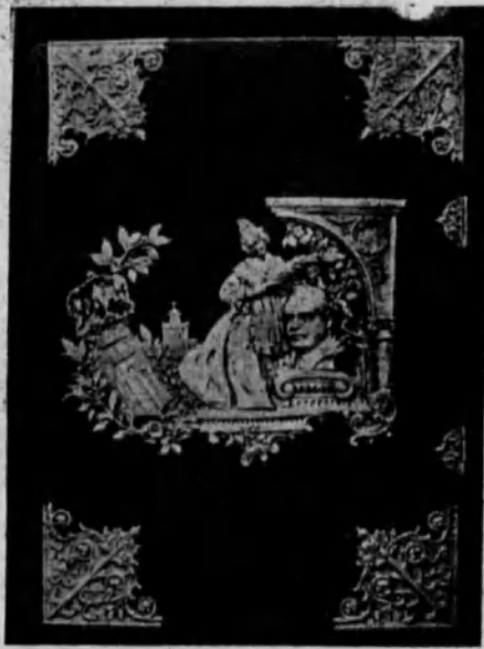
Cubierta del álbum con una alegoría del homenaje, hecha en plata repujada, alarde de la orfebrería valenciana.