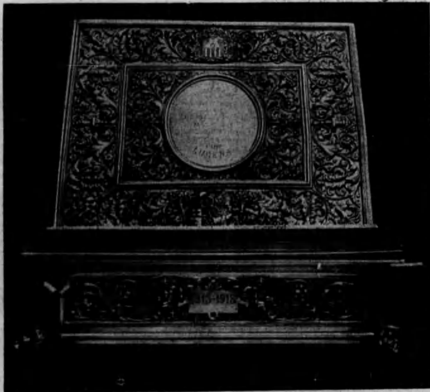
Arquilla de plata repujada, estilo Renacimiento, que guarda el álbum.