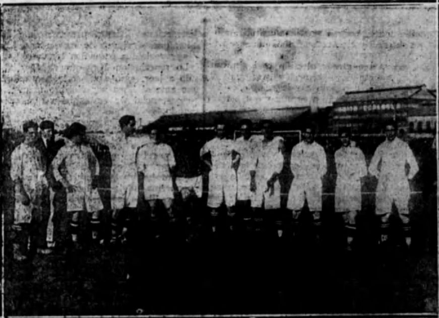
SEVILLA.—El equipo Sevilla F. C., actual campeón de la región andaluza para el año 1919.