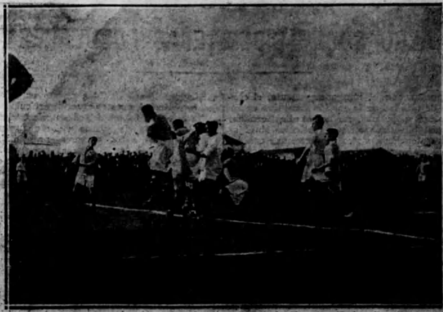
SEVILLA.—Interesante momento del campeonato jugado entre los equipos Real Betis Balompié y Sevilla F. C., resultando vencedor el último.