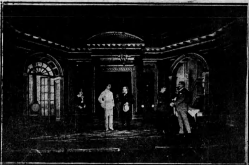
BARCELONA.—Una escena de «Pape lones», comedia en tres actos, original de los Sres. Pous y Pages, estrenada con buen éxito en el teatro Romea, de dicha capital.