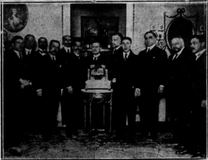
Diputados y senadores de Castellón haciendo entrega del precioso álbum al ex subsecretario de Fomento D. Vicente Cantos Figuerola.

El álbum, si es una maravilla de la orfebrería valenciana, tiene todavía más mérito por el número de firmas que contienen sus artísticos pergaminos y significación de las mismas, pues se da el caso verdaderamente excepcional de reunirse en ese álbum las fir-