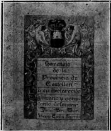
Lámina primera del álbum con la preciosa ornamentación de la dedicatoria, dibujada en pergamino.

La arquilla y el álbum, verdadera joya del arte castellanense y de la reputada orfebrería valenciana, será expuesto en esta corte para que pueda admirarla el público madrileño.